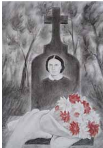
Rysunek Wiktorii Rakytiańskiej, pt. „Ocalić od zapomnienia” przedstawia nagrobek Polikseny Paderewskiej w Kurytówce, matki genialnego kompozytora i polityka Ignacego Jana Paderewskiego

Konkurs odbywał się w czterech kategoriach: praca plastyczna, prezentacja multimedialna, film i album/folder/przewodnik/kolaż.