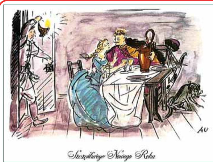
Pocztówka z XX wieku. (rys. Antoni Uniechowski)