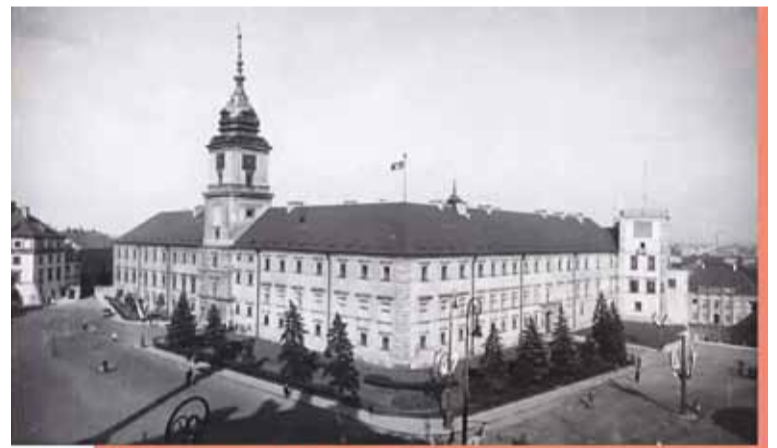
Zamek Królewski w Warszawie lata 30. XX w.

Głosy wzywające do odbudowy Zamku Królewskiego odezwały się tuż po zakończeniu