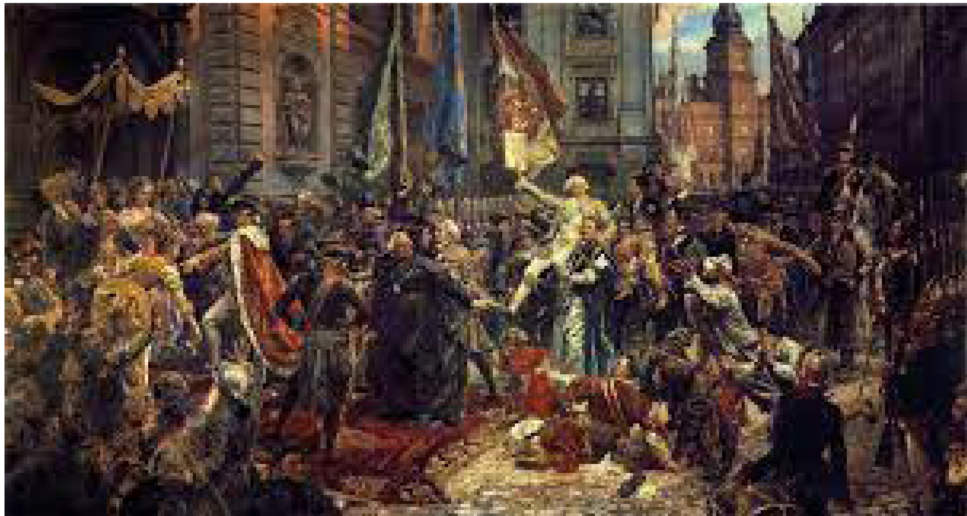
„Uchwalenie Konstytucji 3 maja” – obraz Jana Matejki, 1891 r.

Święto Narodowe Trzeciego Maja przywrócono ustawą z 6 kwietnia 1990 (weszła w życie 28 kwietnia).