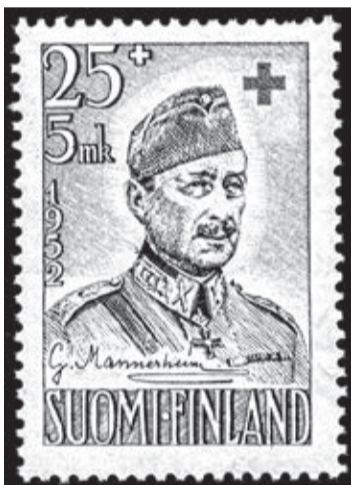
MARSZAŁEK MANNERHEIM NA FIŃSKIM ZNACZKU POCZTOWYM, 1952 R.

że warunki i stanowisko Finlandii istotnie różniły się od tych charakterystyk Ukrainy. Wykorzystując pomyślnie okoliczności, Imperium Rosyjskie w 1809 roku zaanektowało terytorium Finlandii, należące wcześniej do Szwecji. W wyniku tego przejścia Rosja otrzymała złożony region, zasadniczo różny od innych jej części.