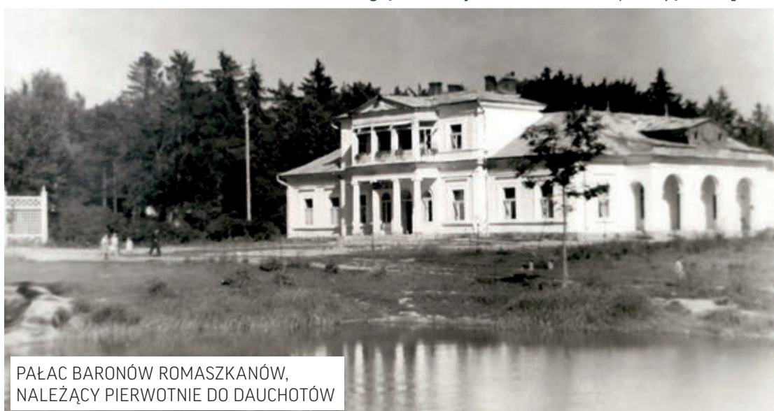
PAŁAC BARONÓW ROMASZKANÓW, NALEŻĄCY PIERWOTNIE DO DAUCHOTÓW