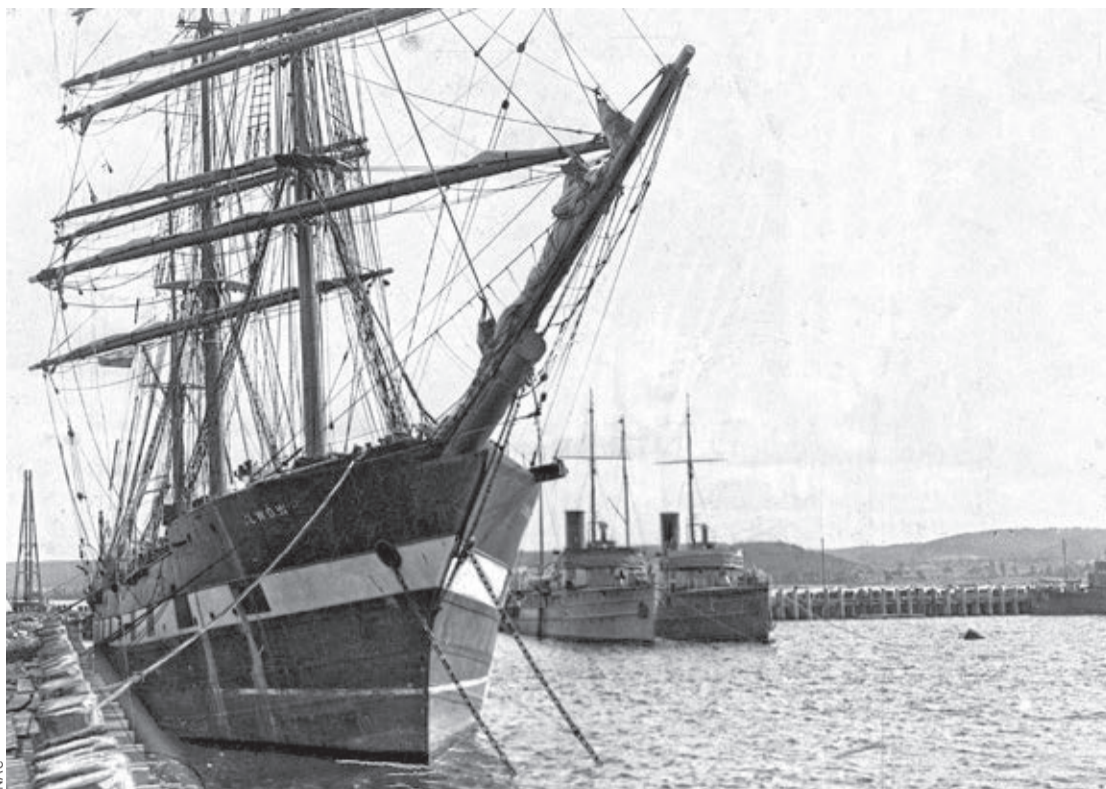
STATEK SZKOLNY „LWÓW” PRZY NADBRZEŻU W GDYNI