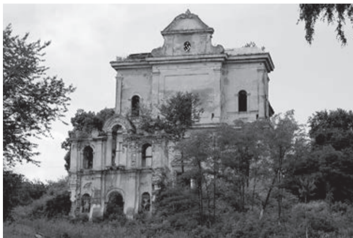
KOŚCIÓŁ W KONKOLNIKACH

Zanik Kościoła na tym obszarze rozpoczął się jeszcze w 1945 roku, kiedy tereny te