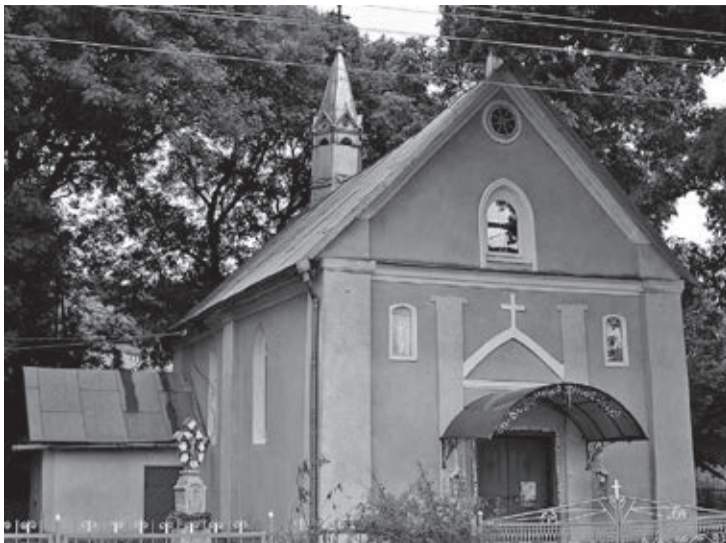
KOŚCIÓŁ W KOŃCZAKACH