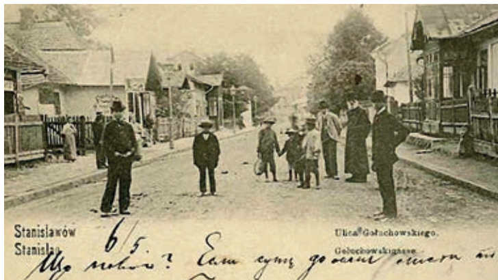
W STANISŁAWOWIE NIE BRAKOWAŁO DZIWAKÓW

W okresie międzywojennym działała w mieście spółdzielnia „Pomoc Kapłańska”. Jej sklep