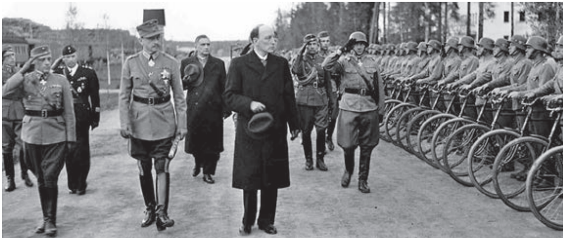
MARSZAŁEK MANNERHEIM I PREZYDENT RIUTI PODCZAS INSPEKCIJ WOJSK W ENSO (OB. SWIETOGORSK, ROSJA), 4 CZERWCA 1944 R.

Wychodząc z powyższego opisu, droga „finlandyzacji” jest dla nas potencjalnie bardzo niebezpieczna. Czy Ukraina nie zmierzała w tym kierunku przed 2015 rokiem? Czy teraz całkowicie od tego odeszliśmy? Czyż słowa pisarza ukraińskiego Mykoły Chwyłowego; „Precz od Moskwy!” nie są odpowiedzią na wszystkie pytania? Jeśli zaś chodzi o taktykę, można o tym przeczytać we wspomnieniach Carla Gustafa Emila Mannerheima. Zachęcam do lektury.