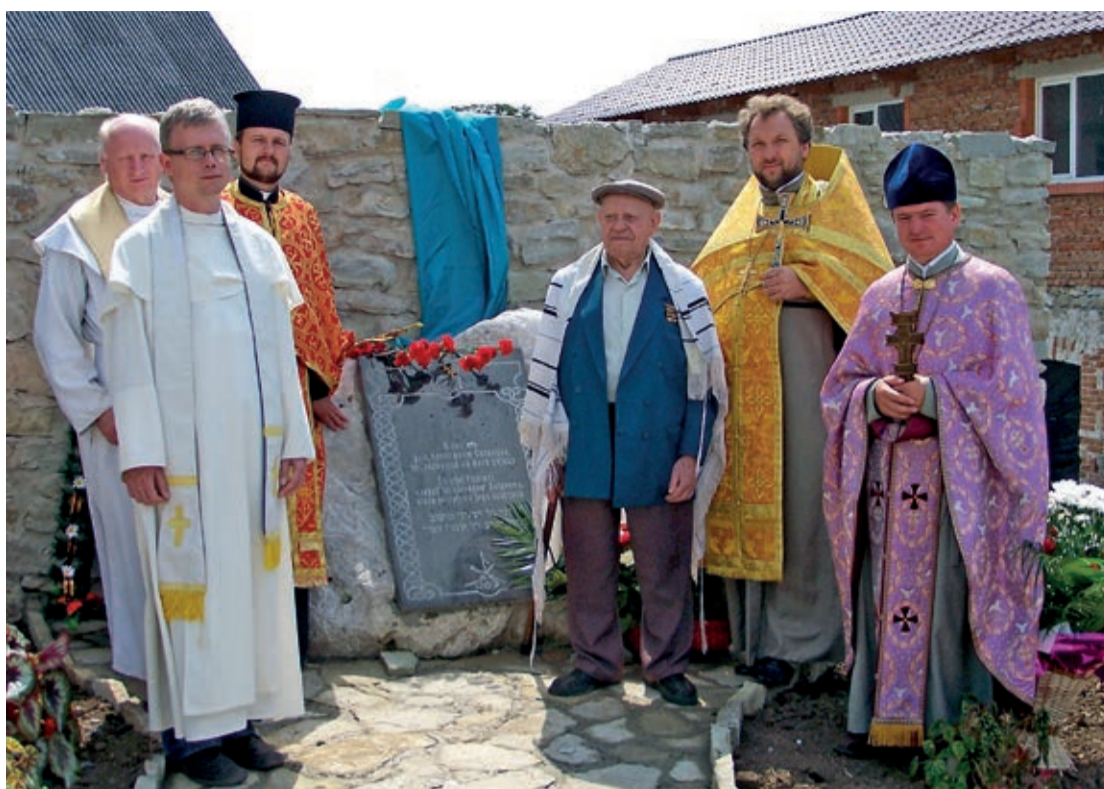
ZNAK KU PAMIĘCI DAWNYCH OBROŃCÓW SATANOWA POŚWIĘCONY PRZEZ KAPŁANÓW RÓŻNYCH KONFESJI

Los bramy zmienił się kardynalnie po wydarzeniach powstania listopadowego na Podolu. Potoccy, którzy byli w tym czasie właścicielami miasta, bardzo aktywnie uczestniczyli w wystąpieniach antyrosyjskich.