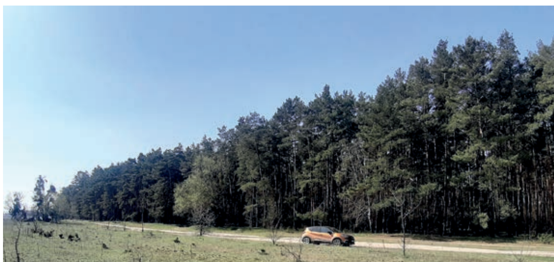
LAS POD GRÓDKIEM

Powstańcy szli chaotycznie, bez policji marszowej w stronę