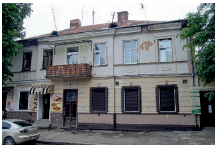
DOM DAUCHOTÓW PRZY UL. LIPOWEJ (OB. SZEWCZENKI 13)

Pierwsza wzmianka o Dauchotach widnieje na planie Stanisławowa i okolic, wykonanym przez inżyniera Walthauzena w 1805 roku. Zaznaczono w nim, że wioski Krechowce i Opryszowce należą do „szlachetnego Dauchota”.