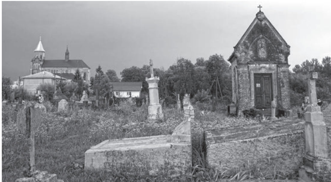
ZABŁOTÓW. WIDOK NA KOŚCIÓŁ PARAFIALNY ZE STRONY KATOLICKIEGO CMENTARZA

Z tej też racji od 1945 roku rozpoczęto walkę z duchowieństwem rzymskokatolickim,