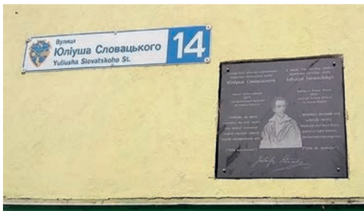
TABLICA JULIUSZA SŁOWACKIEGO

Została tam odsonięta tablica pamiątkowa. Każdej wiosny sprzątamy to miejsce. Prowadzimy otwarte lekcje historii i geografii Polski na terenie byłej Twierdzy Kudak (nad Dnieprem poniżej ujścia Samary). Zapalamy tam znicze i odmawiamy modlitwę za Polaków, którzy pozostali w tej ziemi. Również 15 maja, podczas obchodów Dnia Europy na budynku Uniwersytetu Alfreda Nobla przy ulicy Juliusza Słowackiego z inicjatywy Polaków Dniepru odsonięto tablicę pamiątkową, która jest poświęcona 210. rocznicy urodzin wybitnego polskiego poety. Projekt finansowany ze środków Kancelarii Prezesa Rady Ministrów w ramach zadania publicznego dotyczącego pomocy Polsce i Polakom za granicą 2020 roku przy