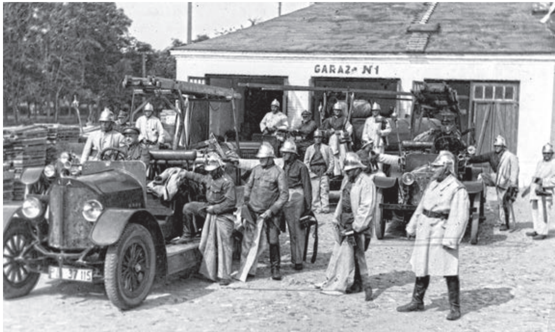
STRAŻACY SZYKUJĄ SIĘ DO AKCJI