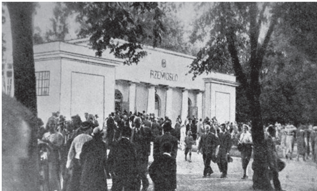
FASADA BUDYNKU WYSTAWOWEGO MIESZCZĄCEGO GRUPĘ RZEMIOSŁA

W XVII Targach Wschodnich wzięło udział 904 wystawców krajowych i 254 zagranicznych z 16 państw, mianowicie USA, Anglii, Austrii, Belgii, Bułgarii, Czechosłowacji, Francji, Holandii, Japonii, Jugosławii, Niemiec, Norwegii, Rumunii, Szwajcarii, Szwecji, Węgier. Wystawcy z Bułgarii uczestniczyli w Targach po raz pierwszy. Osobne pawilony zajmowały wystawy Rumunii, Bułgarii, Niemiec. Król Bułgarii Borys osobiście nadesłał telegram do Dyrekcji Targów: „Serdeczne pozdrowienia dla wszystkich. Życzę powodzenia Targom Wschodnim we