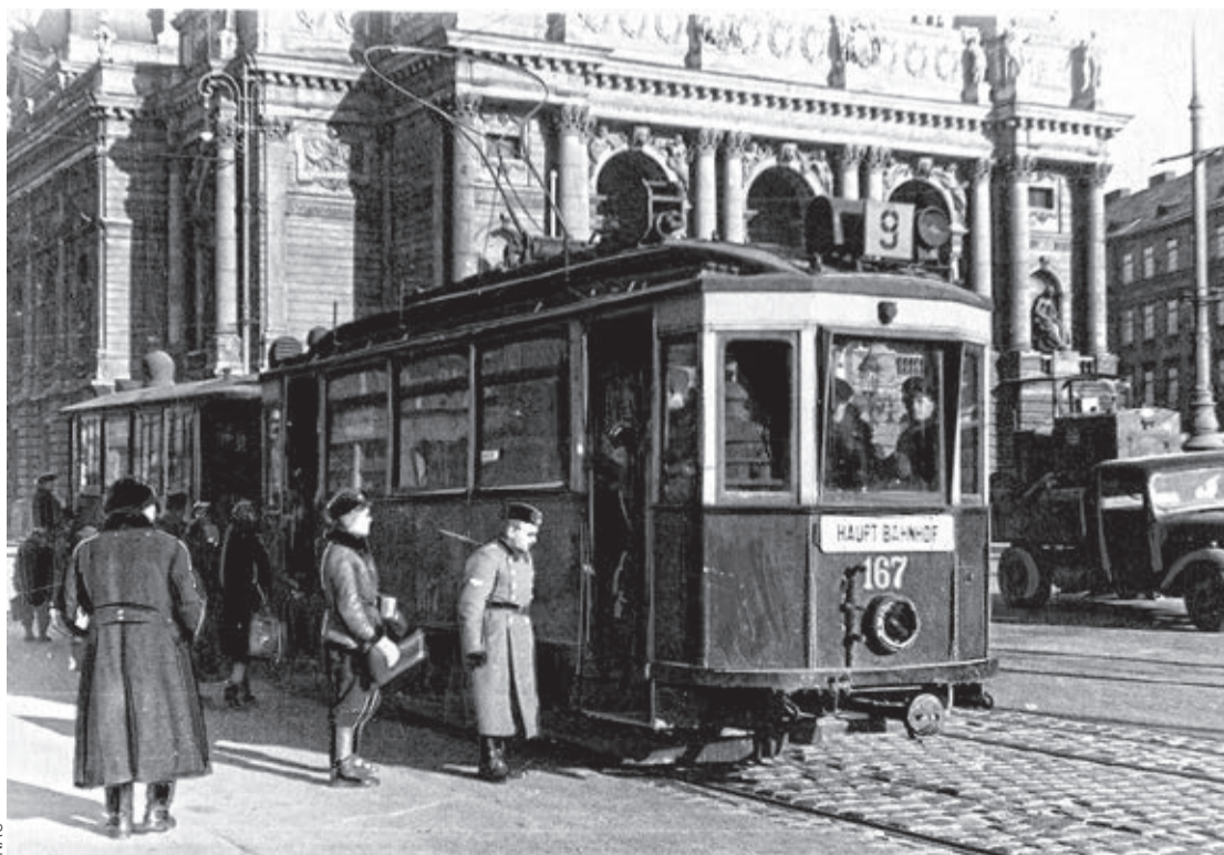
TRAMWAJ LWOWSKI PRZED OPERĄ