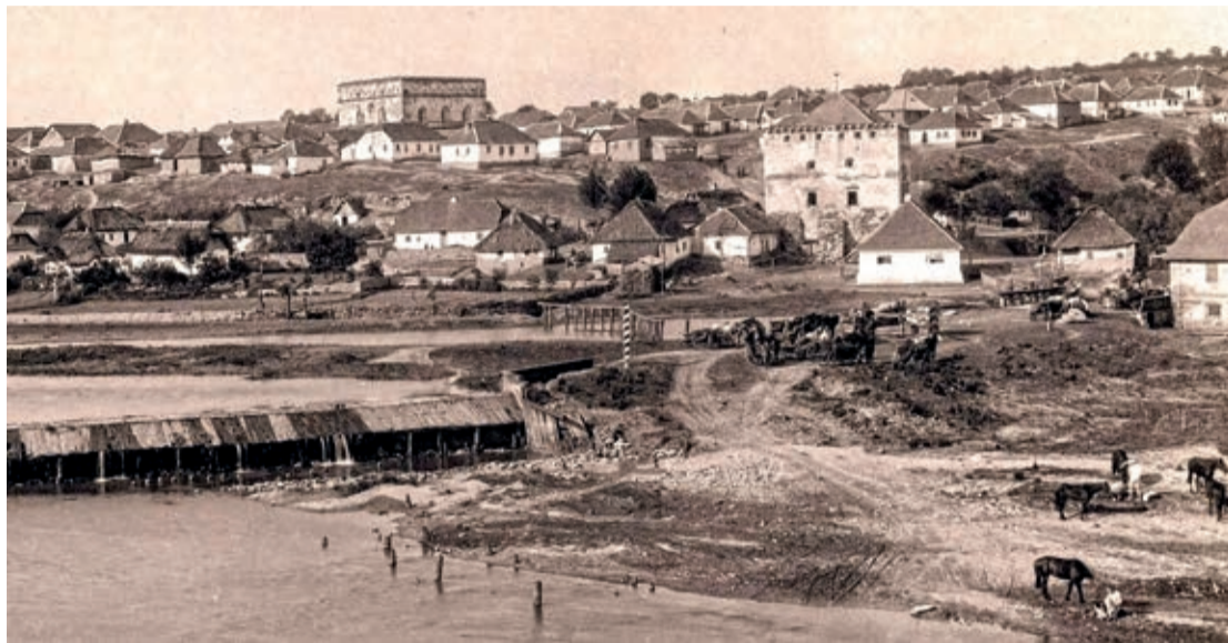
BRAMA, ZDJĘCIE Z 1890 ROKU

– 22 kwietnia 1676 roku, w czasie panowania nad Podolem Porty Otomańskiej, Turcy spalili Satanów. Wówczas jego mieszkańcy chronili się gdzie kto mógł: w murach bram miejskich, w cerkwiach Zwiastowania, Zmartwychwstania i św. Jerzego, w żydowskiej szkole lub też synagodze. Legenda głosi, że Turcy, dowiedziawszy się o mieszkańcach, którzy schronili się w bramie miejskiej, obłożyli ją wokół drewnem i podpálili, chcąc rozgrzać ściany i przez to zmusić oblężonych do poddania się. Ale obrońcy bramy, polewając Turków wrzątkiem przymusili ich do odstąpienia.