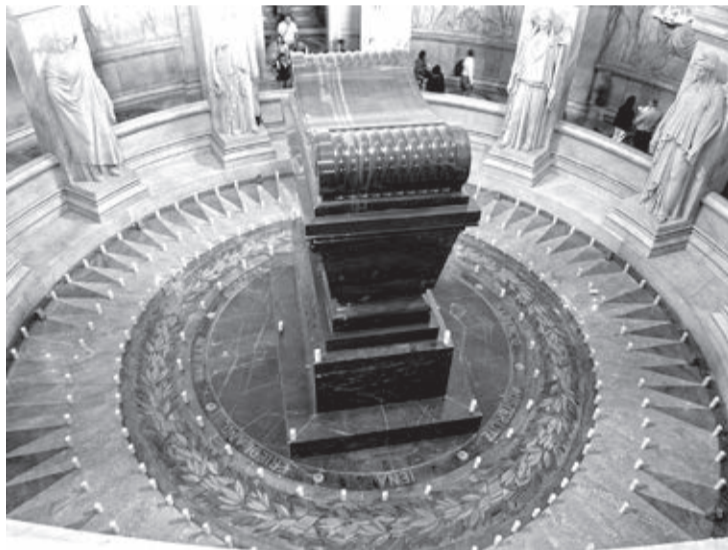
SARKOFAG NA GROBIE NAPOLEONA W KOŚCIELE INWALIDÓW W PARYŻU

chwili łączy się z całym narodem polskim w głębokim hołdzie dla pamięci wielkiego bohatera Francji i upoważnia prezydium do dania wyrazu tym uczuciom za pośrednictwem przedstawicielstwa Francji we Lwowie.