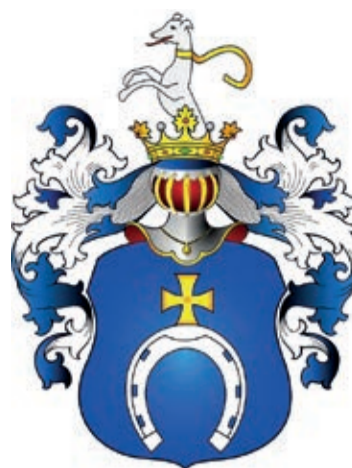
W 1811 R. DAUCHOCI OTRZYMALI SZLACHECKI HERB „POBÓG”

Rodzice wrócili pod wieczór i nie znalazłszy córki w domu, wszczęli poszukiwania. Przeglądali wszystkie