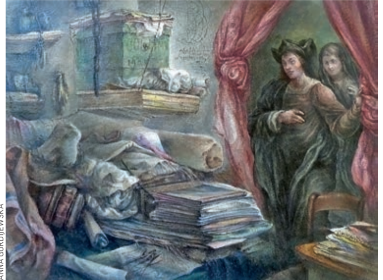
SYN KOLUMBA POKAZUJE MAŁŻONCE ŁAŃCUCHY OJCA. AKWARELA