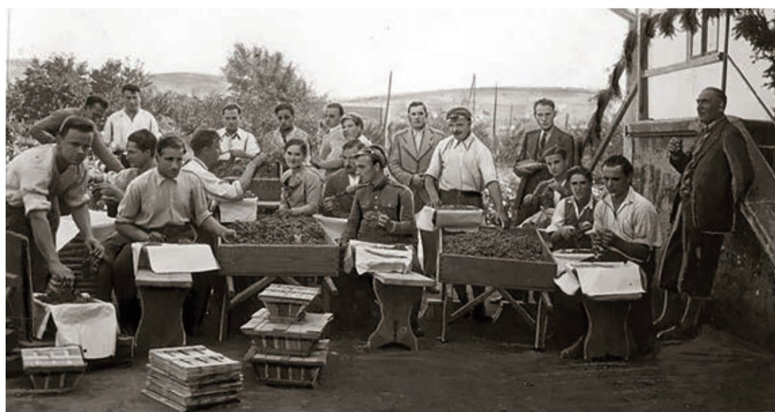
PAKOWANIE WINOGRON DO SKRZYŃ