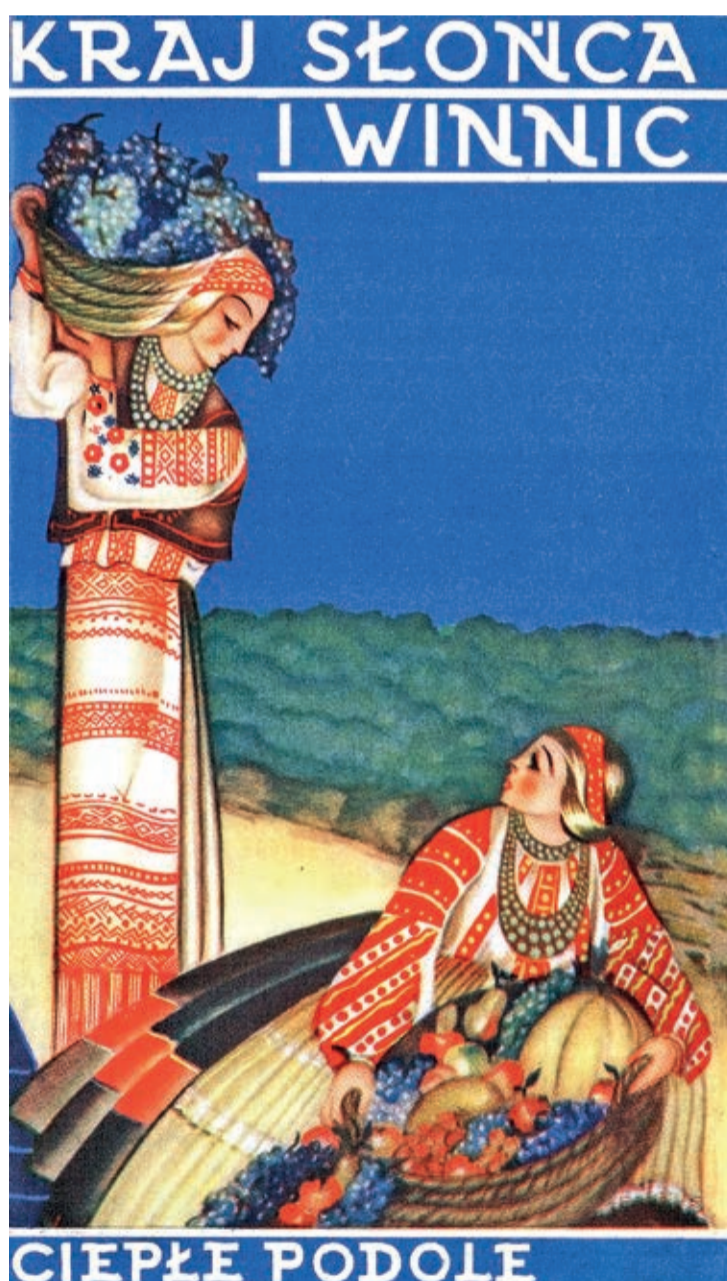
FOLDER „KRAJ SŁOŃCA I WINNIC” (POLSKIE KOLEJE PAŃSTWOWE I LIGA POPIERANIA TURYSTYKI, TARNOPOL 1938)