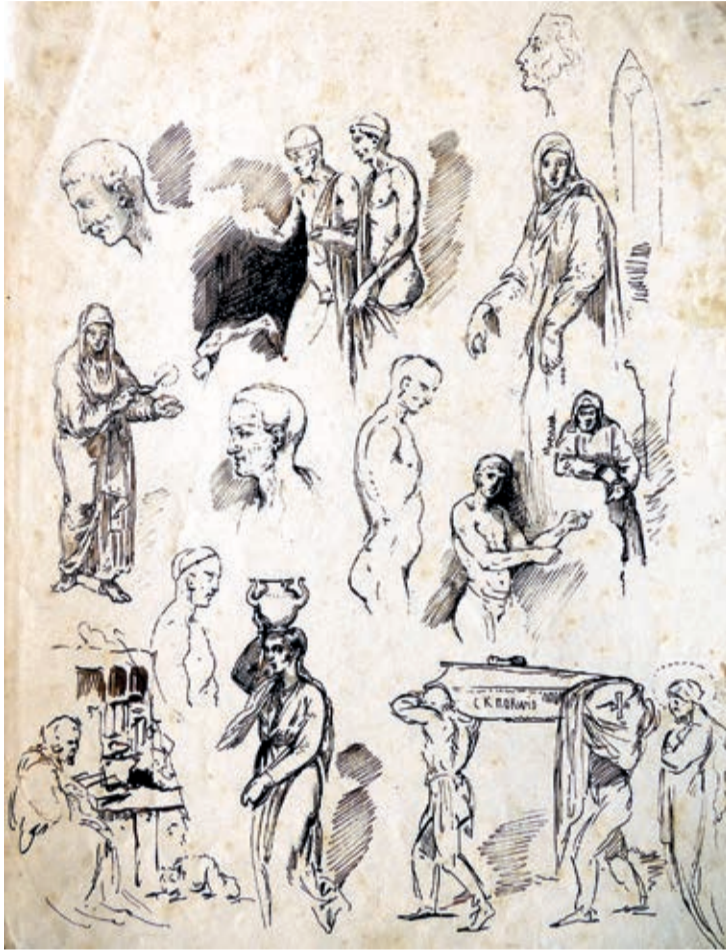
12 SZKICÓW NA JEDNYM PAPIERZE

Stolica Francji po upadku powstania listopadowego stała się centrum polskiej myśli niepodległościowej, siedzibą wielu organizacji, jak Hotel Lambert Czartoryskich, świeżo powołana do istnienia Biblioteka Polska, Towarzystwo Historyczno-Literackie