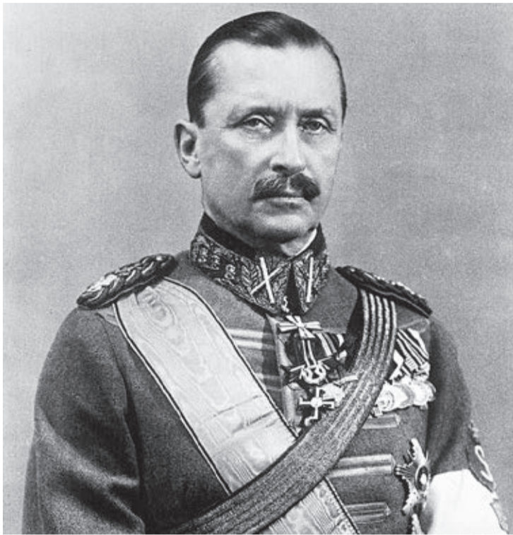
CARL GUSTAF EMIL MANNERHEIM. ZDJĘCIE Z 1940 R.

Czy jednak sięgając po analogie nie popełniamy metodologicznego błędu? Zapominamy,