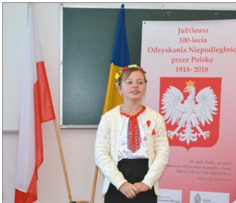
Wśród utworów, zaprezentowanych przez młodzież dominowała poezja patriotyczna, dedykowana Polsce Niepodległej