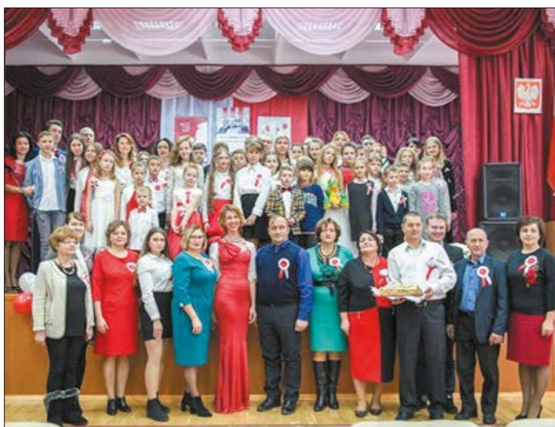
Radosna atmosfera bycia razem, mnóstwo występów zespołów, krótkometrażowe filmy historyczne, głęboka poezja, pieśni patriotyczne złożyły się na wyjątkowe spotkanie