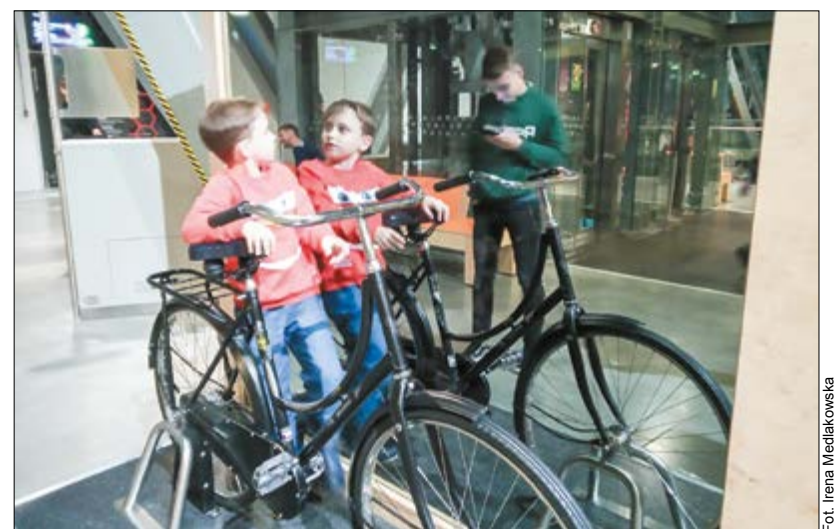
Najwięcej radości dzieciom przyniosła wycieczka do Centrum Nauki Kopernik

Zwiedzanie Muzeum Powstania Warszawskiego było wręczającym przeżyciem. Uczniowie zachwyceni byli bohaterstwem warszawiaków w czasie II wojny światowej. W Zamku Królewskim ich uwagę