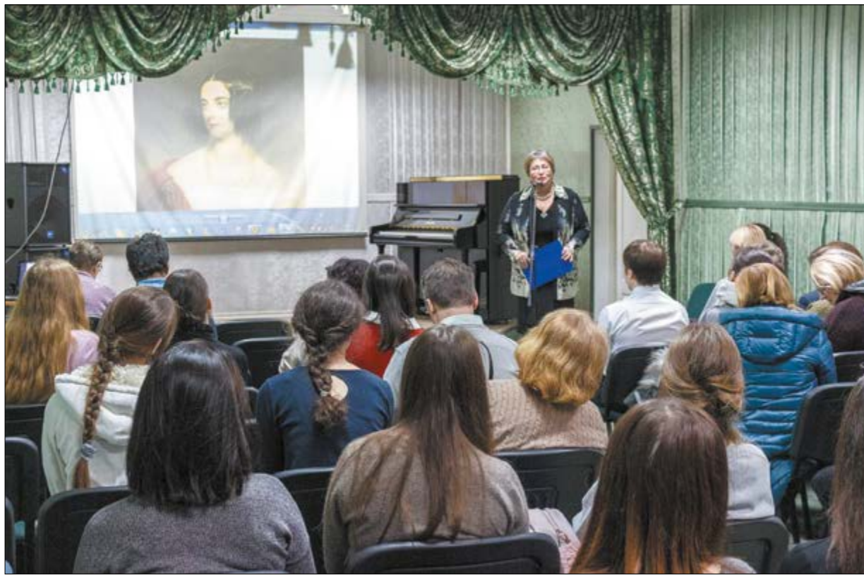
Goście wieczoru muzycznego, który odbył się 22 listopada w Winnickim Koledżu Kultury i Sztuki im. Leontowicza, dowiedzieli się co łączyło Fryderyka Chopina z Podolem

Urodzona w Kuryłowcach Murawianych Delfina Potocka z domu Komar otrzymała wszechstronne domowe wykształcenie: znała języki obce (rodzina zachwycała się kulturą francuską), grała na fortepianie i miała zdolności wokalne. Jej urodę i talentami zachwycali się