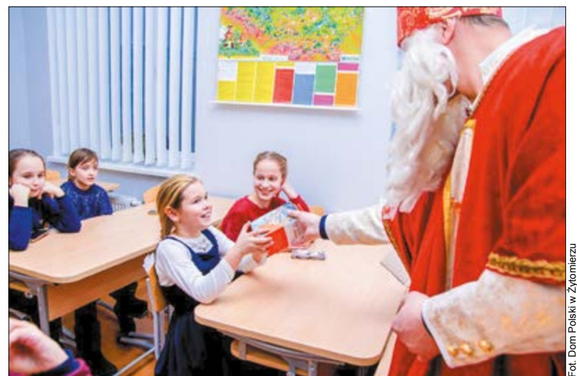
W takt piosenki „Kochany Panie Mikołaju” do sali wkroczył długo oczekiwany gość z workiem pełnym prezentów