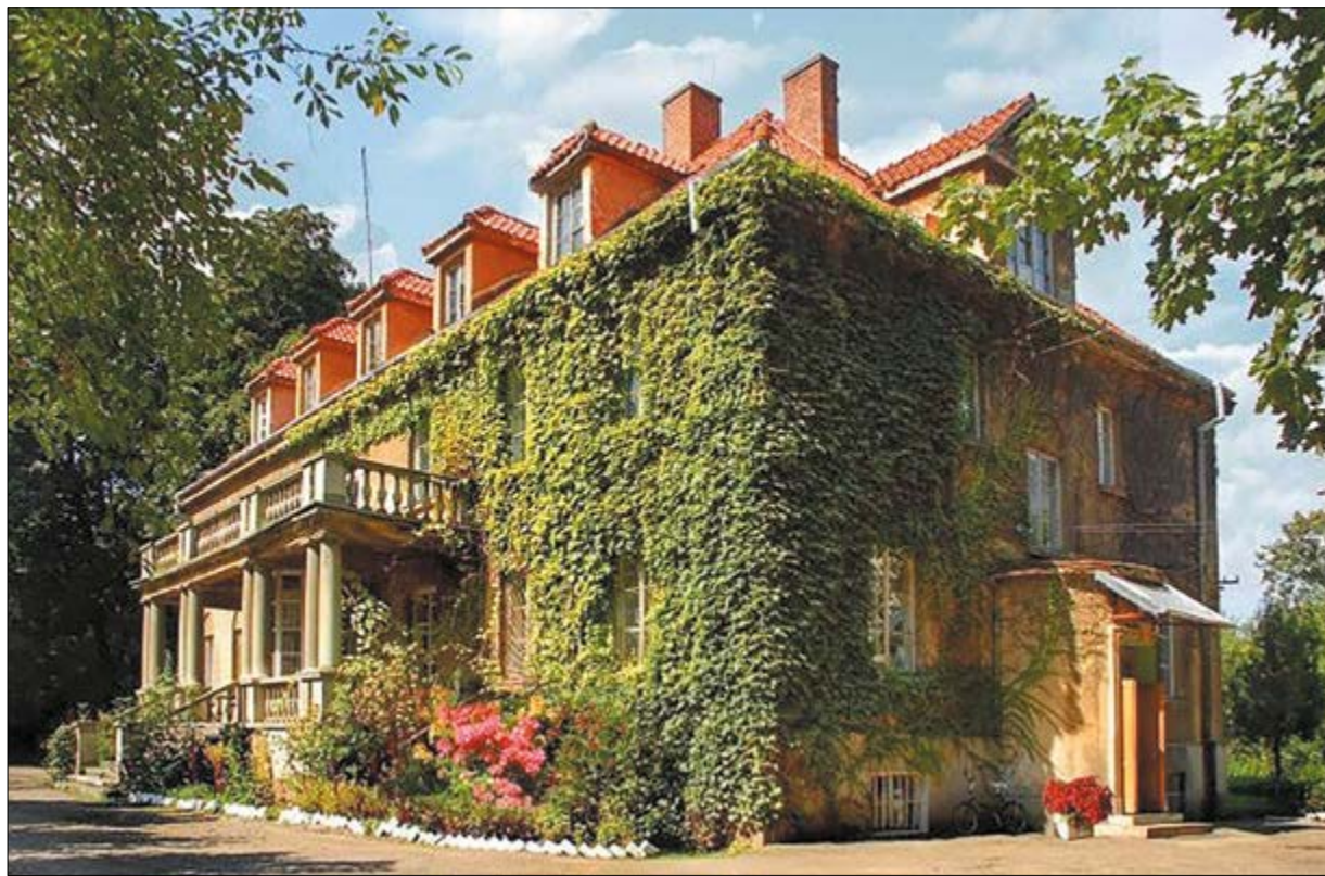
Dziś pałac Lubomirskiego de Vaux w Chodorowie wchodzi w skład kompleksu szpitalnego

Dziś pałac ów wchodzi w skład kompleksu szpitalnego. Jego wnętrza są całkowicie przebudowane i nie ma tam czego oglądać. Za to z zewnątrz nie stracił swego pierwotnego wyglądu. Od frontu i z tyłu zachowały się ganki z czterema ko-