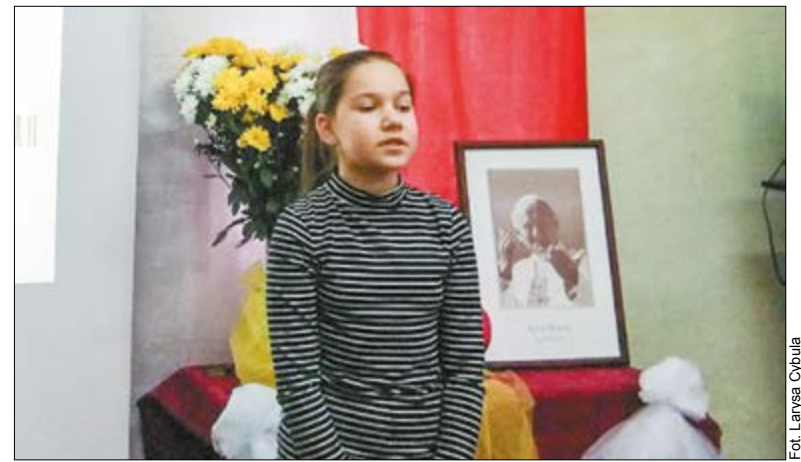
W niewielkiej, ale bardzo przytulnej klasie Szkoły Sobotniej Języka Polskiego zabrzmiały piękne i ciepłe słowa o Ojcu Świętym, o jego pełnym wiary życiu

Słowo Polskie na podstawie informacji KG RP w Odessie