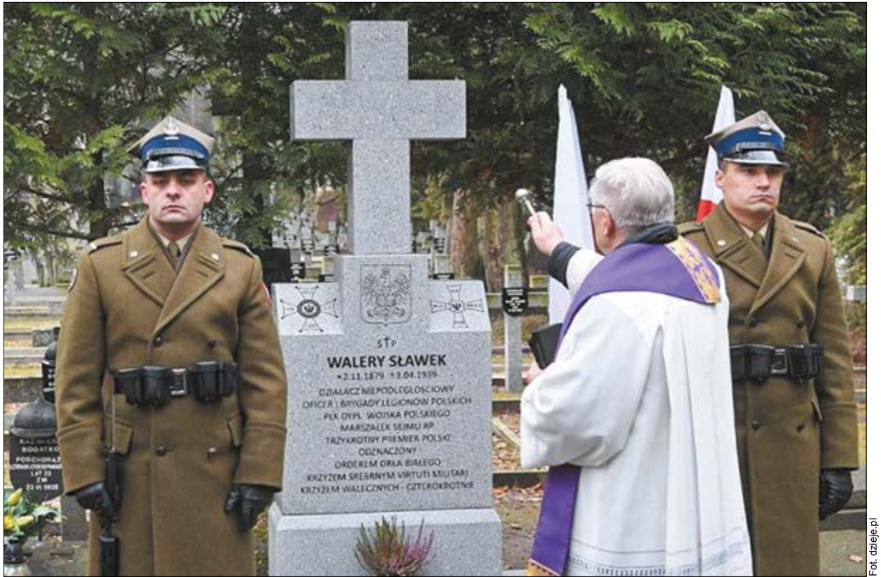
Obecnie Walery Sławek jest pochowany na Cmentarzu Wojskowym na Powązkach w Warszawie