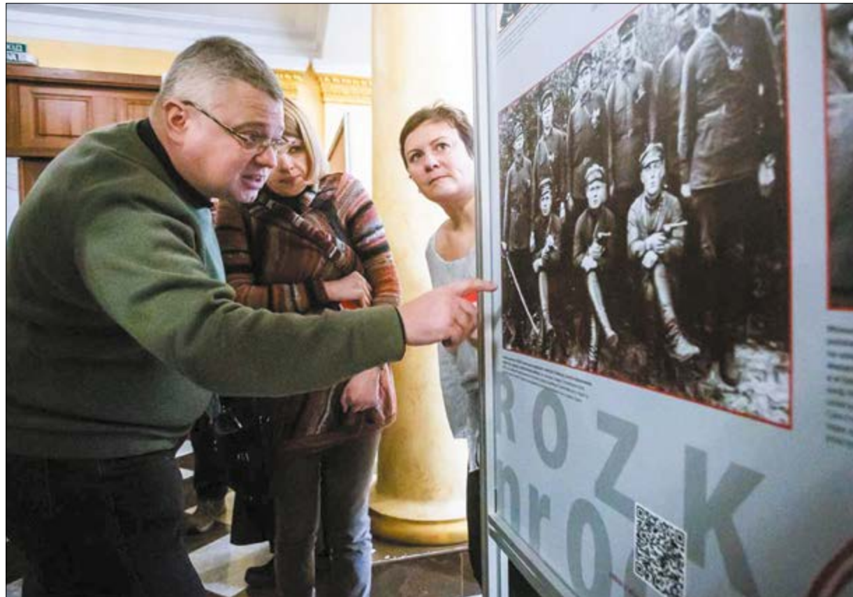
Ekspozycja powstała dzięki materiałom archiwalnym przekazanych do IPN przez ukraińskie państwowe archiwa obwodowe w Odessie, Chmielnickim i Winnicy