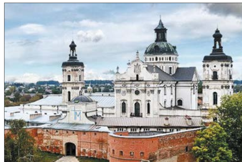
Karmelitański zespół klasztorny nad Hniliopiatem