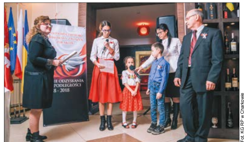
W spotkaniu wzięli również udział m.in. przedstawiciele KG RP w Charkowie, miejscowi Polacy, duchowieństwo oraz przedsiębiorcy