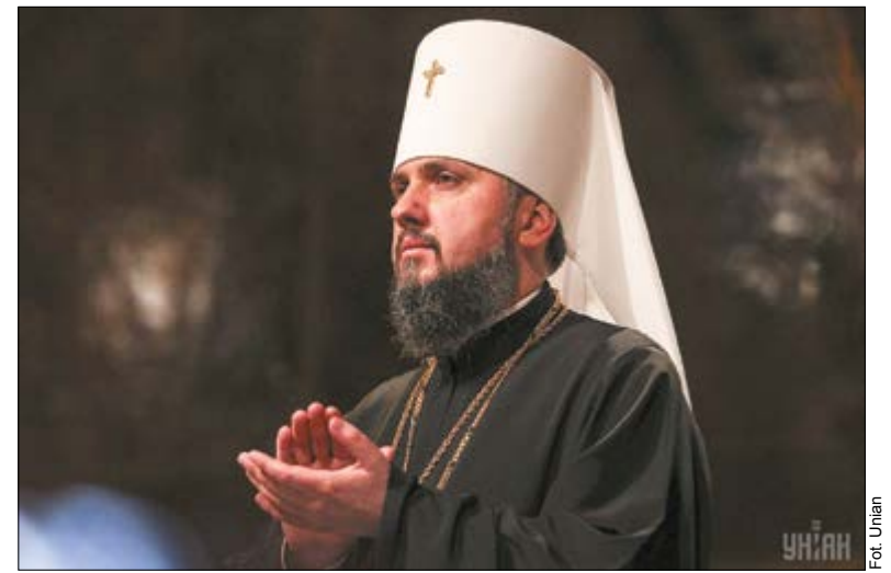
Biskup Epifaniusz - wybrany przez synod zwierzchnik Ukraińskiej Cerkwi Prawosławnej

Minister spraw zagranicznych Jacek Czaputowicz w rozmowie telefonicznej z Wysoką Przedstawicielką ds. Polityki Zagranicznej i Bezpieczeństwa Federicą Mogherini odniósł się do ostatnich wydarzeń na Morzu Azowskim. Szef polskiej dyplomacji podkreślił konieczność jasnej i zdecydowanej reakcji ze strony Unii Europejskiej w związku z działaniami Federacji Rosyjskiej wobec okrętów ukraińskiej marynarki wojennej. Uznał, że w przyjmowanych przez UE dokumentach powinno mocno wybrzmieć potępienie otwartego użycia przez Rosję siły militarnej wobec Ukrainy.