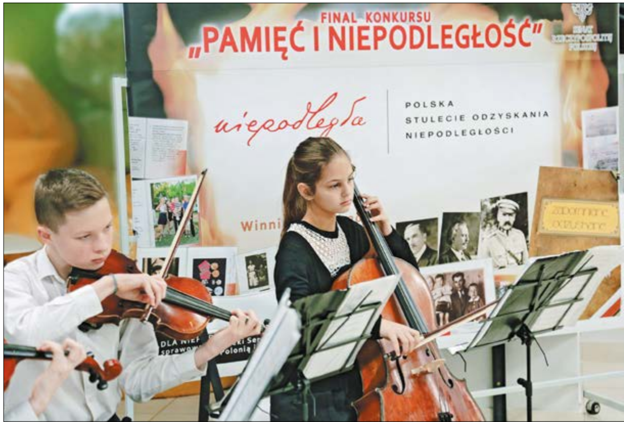
Dzieci i młodzież recytowały wiersze o tematyce niepodległościowej, zespół muzyki dawnej działający przy Chrześcijańsko-Demokratycznym Związku Polaków Winnicy zagrał „Cantio Polonica”, wysłuchano utworów Fryderyka Chopina

Po odśpiewaniu hymnu dzieci i młodzież recytowały wiersze o tematyce niepodległościowej, zespół