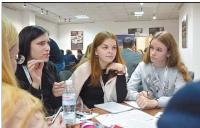
W spotkaniu tym biorą udział młode i aktywne osoby polskiego pochodzenia z całej Ukrainy