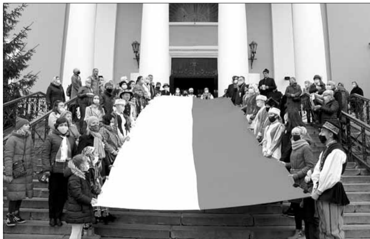
Kijowscy Polacy z flagą narodową

- Dwie z nich są parafiami diecezjalnymi, pozostałe prowadzą zakonnicy: Oblaci, Karmelici, Kapucyni, Palotyni,