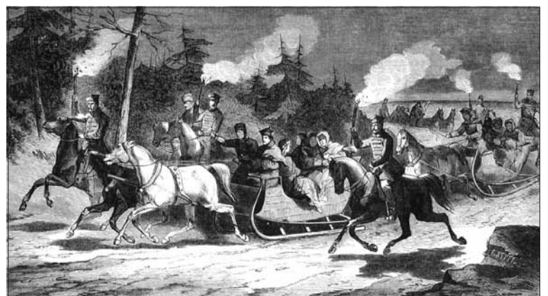
Wodzirejowi na najszybszych saniach, zwanemu kuligiem (zazwyczaj w masce z długim ptasim dziobem) i jego towarzystwu pod groźbą bankructwa gospodarza nie wolno było odmówić gościny przerstającej zazwyczaj w kilkudobowe libacje