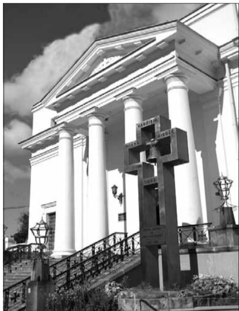
Kościół pw. św. Aleksandra w Kijowie

Prowadzimy tu duszpasterstwo w kilku językach. Najliczniejszą grupę stanowią