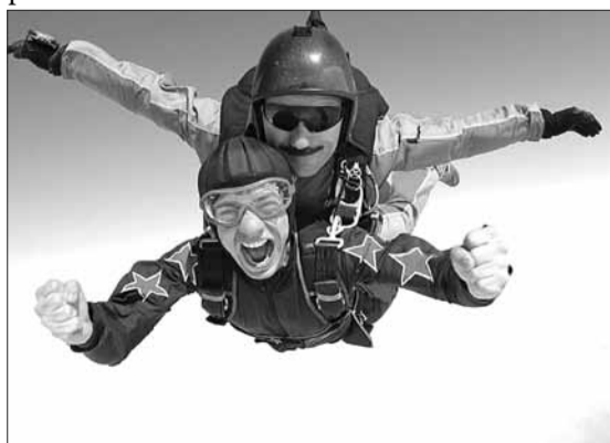
Adrenalina – hormon stresu

cel podniesienie poziomu oświaty i kultury rolnej w regionie podkrakowskim. Prowadzi nawet badania nad dietą ludu wiejskiego w Galicji. Wspólnie z profesorem Odo Bujwidem zakłada pierwsze w Krakowie żeńskie gimnazjum, co więcej – głośno postuluje dopuszczenie kobiet do studiów wyższych. Napoleon