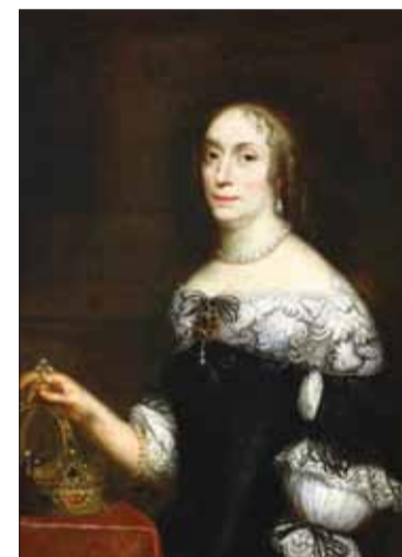
Daniel Schultz – „Portret Ludwiki Marii Gonzagi”

Każda epoka ma swój styl, swoje subtelności, uroki i niedomogi. Barok stał się okresem odmiennych zwyczajów kulturowych w tym i prominentnego upiększania ciała. Kobiety chciały być wiecznie młode, wesole i kokieteryjne. Stroje kobiece, szczególnie magnaterii inspirowane były modą zagraniczną. Modne stały się duże dekolty, ciasne gorsety. Prawdziwy przełom w kroju polskich sukien „pod szyję” nastąpił dopiero wraz z przy-