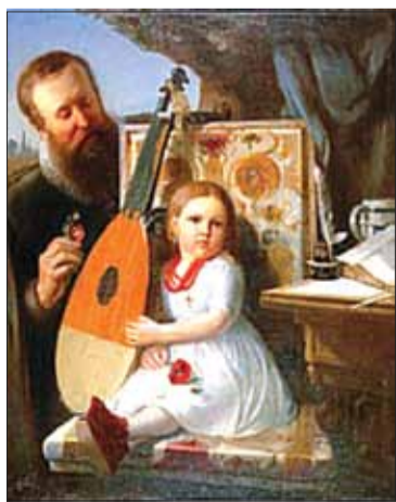
Władysław Łuszczkiewicz – „Jan Kochanowski z Urszulką”

Radosne tańce i śpiewy przy rozpalonych sobótkach,