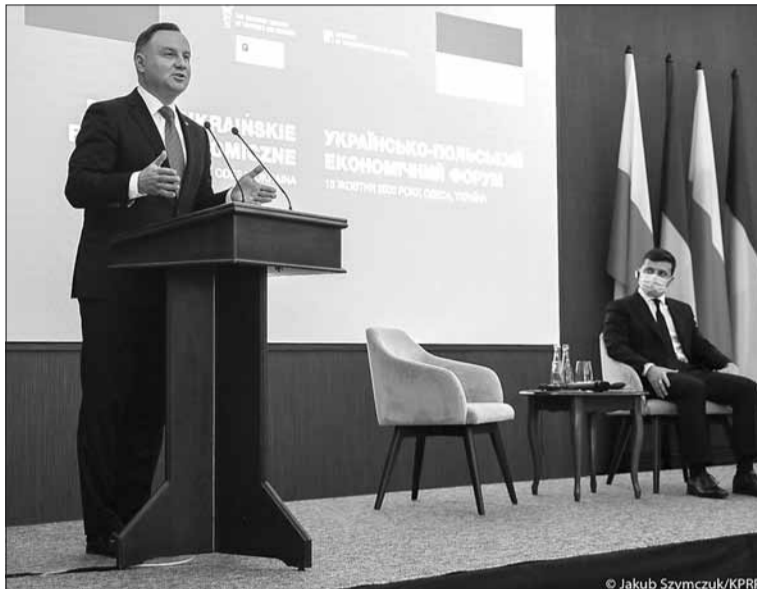
Andrzej Duda i Wołodymyr Zełenski zainaugurowali polsko-ukraińskie forum gospodarcze

w Medyce, do portu morskiego Gdańsk i dalej w kierunku Skandynawii, Wielkiej Brytanii oraz innych państw Europy Zachodniej. Projekt ten ma duży potencjał rozwojowy. W Porcie Gdańsk funkcjonują wyspecjalizowane terminale. Gdańsk jest naszym polskim oknem na świat”.