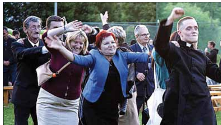
Mieszkańcy Jaślik z Bartoszem Bielenią w roli księdza na planie filmowym „Boże Ciało” w reżyserii Jana Komasy