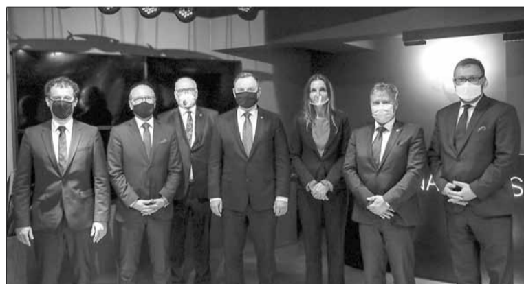
W Odessie Andrzej Duda spotkał się z przedsiębiorcami zrzeszonymi w Stowarzyszeniu Przedsiębiorców Polskich na Ukrainie

Apelował do przedstawicieli polskiego biznesu do aktywniejszego inwestowania w gospodarkę Ukrainy i do udziału