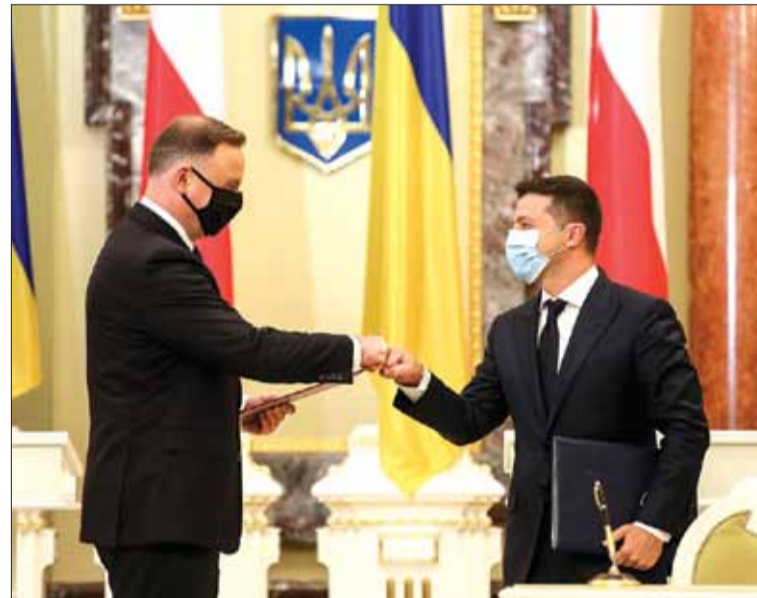
Kijów, 12 października. Przywitanie Prezydentów (niezwykle z uwagi na pandemię).

Uznajemy, że współpraca humanitarna i kulturalna pozostaje ważną częścią dwustronnej agendy i będzie skierowana na promowanie kontaktów międzyludzkich, opracowywanie nowych inicjatyw oraz wdrażanie wspólnych projektów w dziedzinie edukacji, nauki, opieki zdrowotnej, sportu, wymiany młodzieży i turystyki.