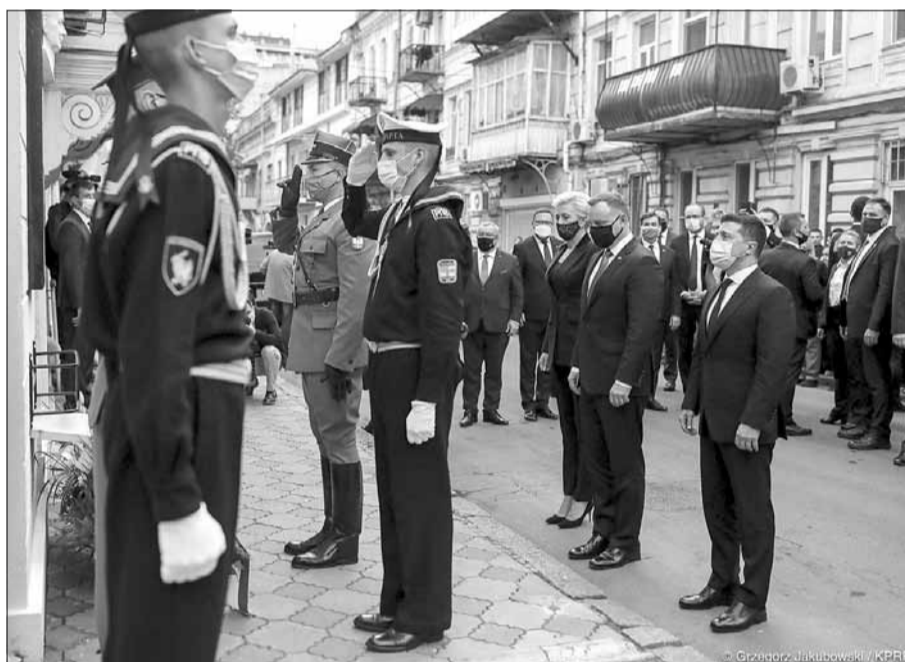
Para Prezydencka oraz Prezydent Ukrainy przed pamiątkową tablicą upamiętniającą tragicznie zmarłego Prezydenta Lecha Kaczyńskiego

z Ukrainą, omówię zarówno perspektywę tej współpracy, jak i jej możliwą formę, aby ta współpraca jak najszybciej była możliwa. Wierzę w to, że uda się to zrealizować jako jeszcze większe zbliżenie Ukrainy z Unią Europejską, a przede wszystkim z państwami Unii Europejskiej naszej części europejskiego kontynentu.