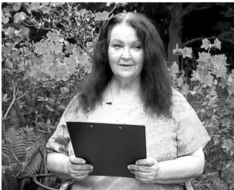
Anna Dymna – wybitna polska aktorka teatralna i filmowa

Pani Anna Dymna – wybitna polska aktorka teatralna i filmowa ma w dorobku blisko trzysta ról (na Ukrainie widzowie pamiętają ją z filmu „Znachor”). Jest zdobywczynią wielu prestiżowych nagród. Odznaczona m.in. Krzyżem Komandorskim Orderu Odrodzenia Polski oraz Złotym Medalem „Zasłużony Kulturze Gloria Artis”, Orderem Uśmiechu, Orderem Ecce Homo. Jest pedagogiem PWST, założycielką charytatywnej fundacji „Mimo wszystko”, pomagającej osobom cho-