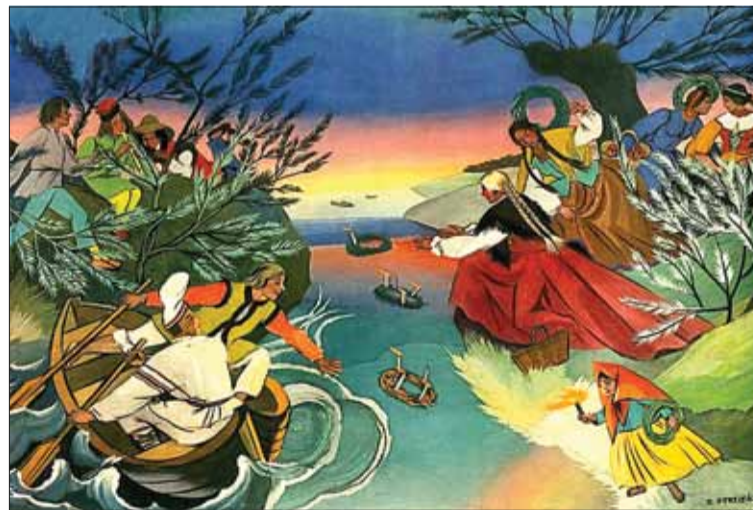
Zofia Stryjeńska – „Wianki”

byciem do Polski na początku 1646 r. świeżo zaślubionej polskiemu królowi Francuzki Ludwiki Marii Gonzagi.