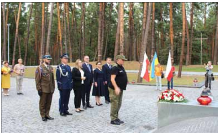
Podczas uroczystości na Cmentarzu Wojennym w Bykowni