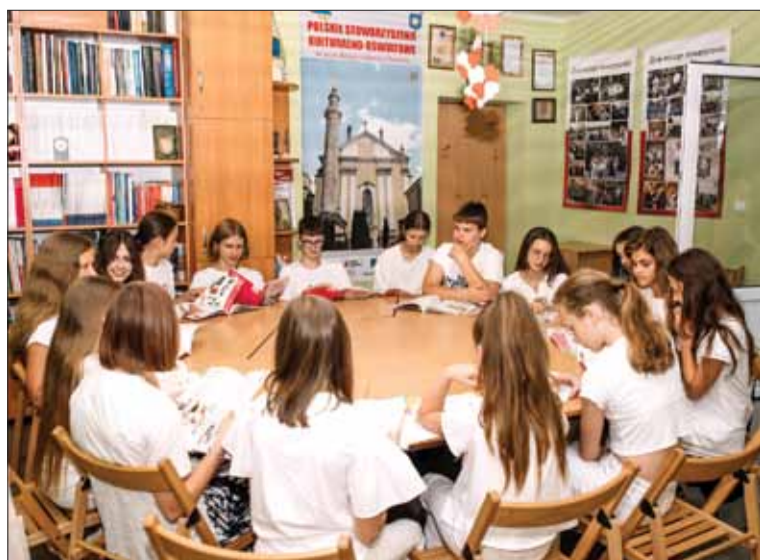
Uczymy się polskiego