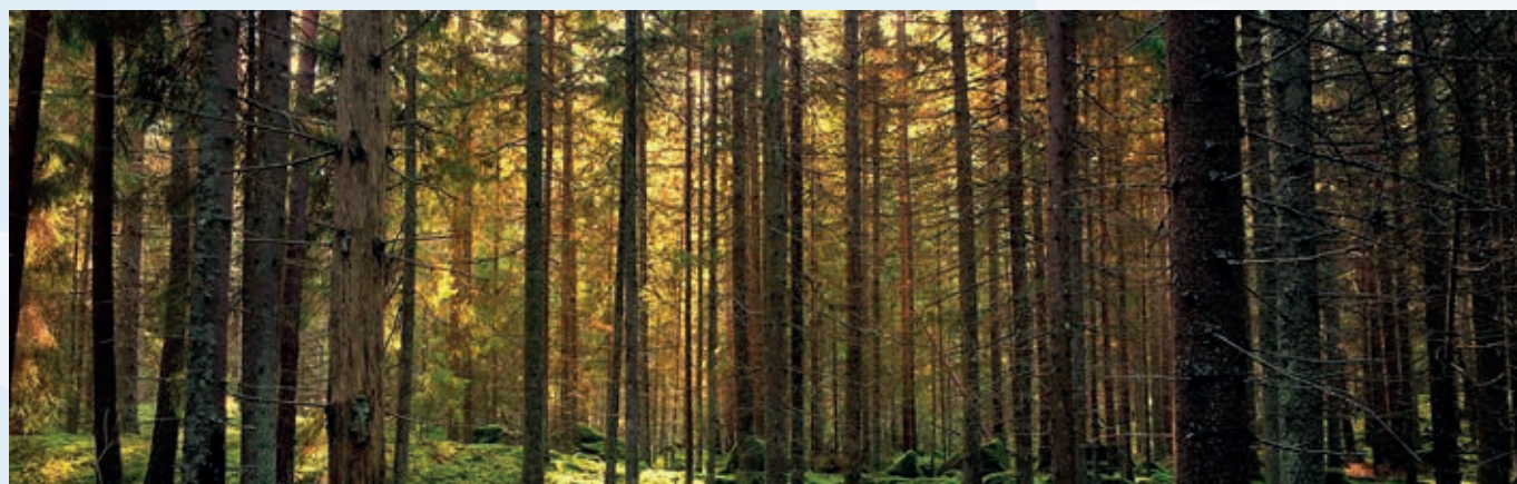
PUSZCZA BIAŁOWIESKA, POLSKA