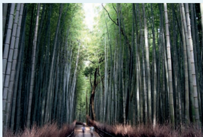
LAS BAMBUSOWY, JAPONIA