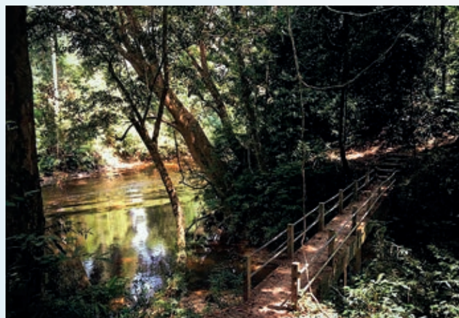
OMSZONY LAS, MALEZJA