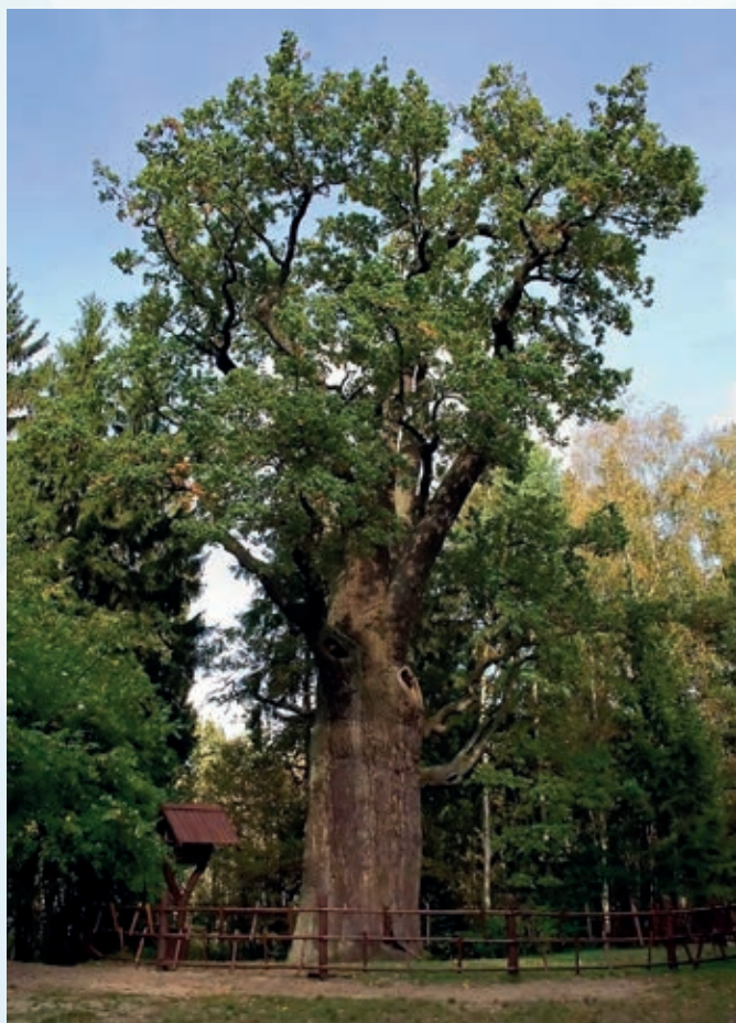
NAJSTARSZE DRZEWO W POLSCE: DĄB CHROBRY

Do najstarszych drzew na naszej planecie należy dąb. Istnieje na ziemi już od 65 mln lat. Przez wieki botanicy opisali ponad 200 gatunków dębów z różnych stron świata. Dęby rosną wzwyż ok. 200 lat, później rozrastają się jedynie wszerz – czyli pień drzewa zwiększa swój obwód.