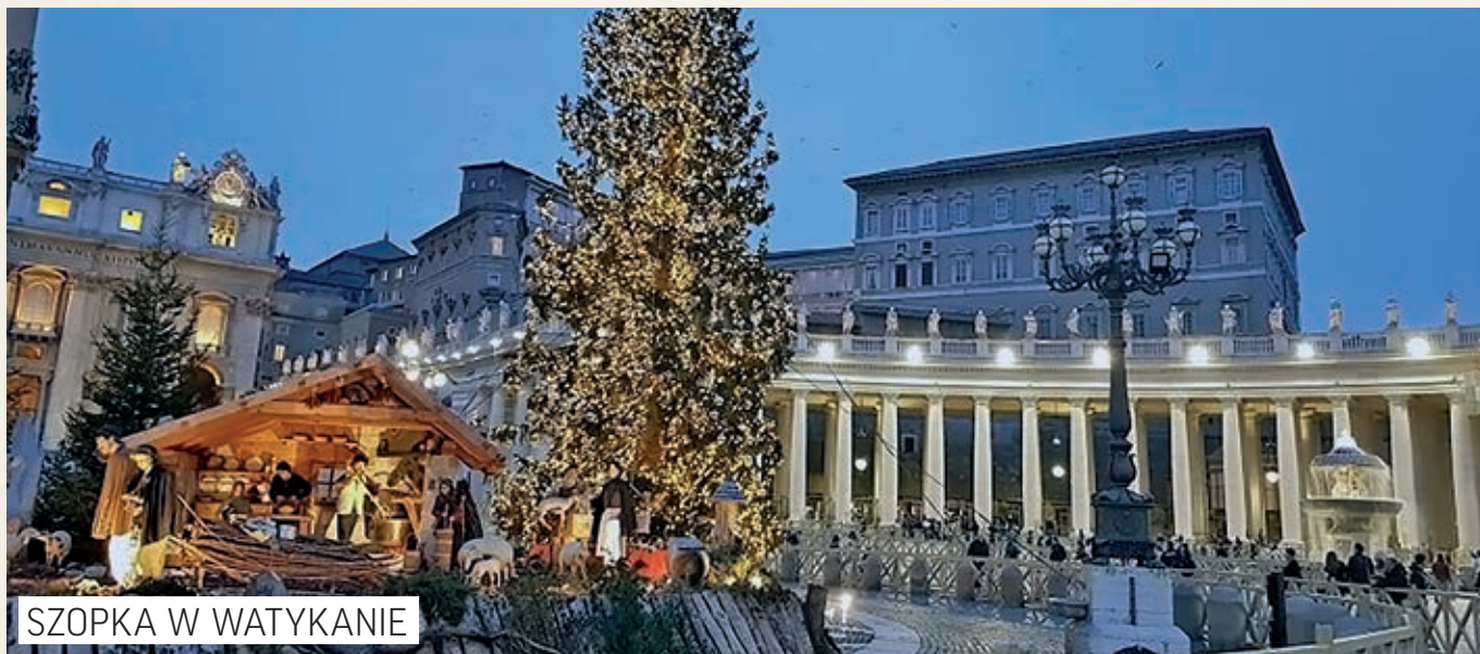
SZOPKA W WATYKANIE

Mieszkańcy Rzymu, stolicy Włoch, pośrodku miasta ustawiają wysoką, 25-metrową choinkę. Przed pałacem Papieża – na placu Św. Piotra jest ustawiana duża szopka, wysoka jak dom mieszkalny, a postacie w niej sięgają dwóch metrów. Wyobraźcie sobie, że Włosi nie mają wieczerzy wigilijnej.