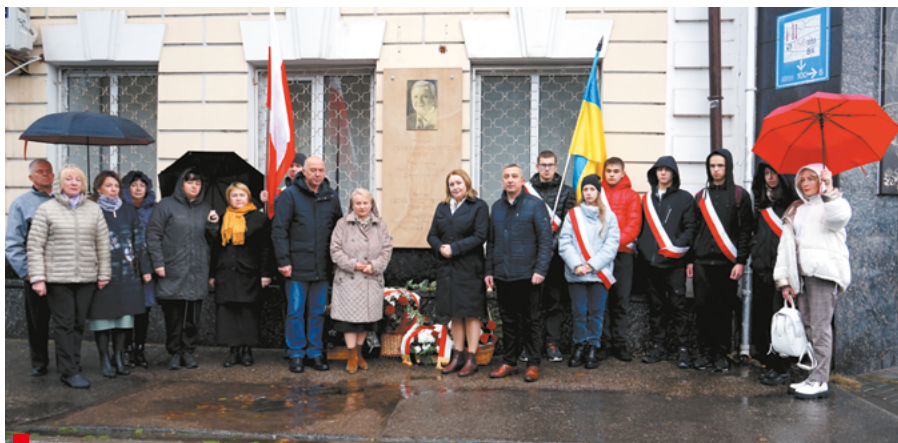
Uczestnicy obchodów uczcili pamięć prezydenta Lecha Kaczyńskiego / Учасники події вшанували пам'ять Президента Польщі Леха Качинського