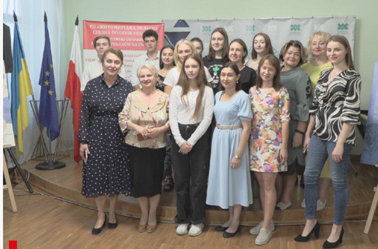
Otwarcie wystawy „Z Torunia do gwiazd. Mikołaj Kopernik w zbiorach ikonograficznych Książnicy Kopernikańskiej w Toruniu” / Відкриття виставки „Від Торуня до зірок Миколи Коперника в іконографічних колекціях бібліотеки Коперника в Торуні”

Na fasadzie szkoły znajduje się tablica pamiątkowa I. J. Paderewskiego, który był nie tylko muzykiem, ale także mężem stanu i działaczem niepodległościowym.