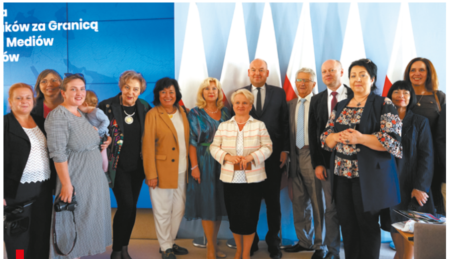
Polonijni i polscy dziennikarze uczestniczący w Zjeździe / Полонійни та польські журналісти під час роботи з їзду

W dniach 22-24 września w Warszawie po raz szósty spotkali się dziennikarze i redaktorzy działający w polonijnych redakcjach prasowych, telewizyjnych, radiowych, portalach internetowych czy prowadzący blogi w 27 krajach na sześciu kontynentach.