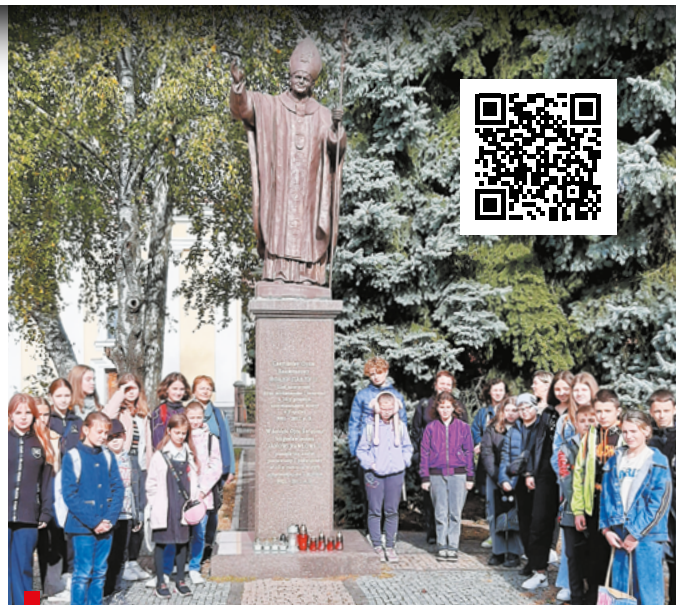
Młodzież Szkoły Sobotnio-Niedzielnej im. I.J. Paderewskiego oraz członkowie Żytomierskiego Obwodowego Związku Polaków na Ukrainie uoddali hołd papieżowi Janowi Pawłowi II / Молодь польської суботньо-недільної школи ім. І. Я. Падеревського та члени ГО "Житомирська обласна Спілка поляків України" віддали шану Папі Івану Павлу II

Karol Wojtyła urodził się 18 maja 1920 roku w Wadowicach. Został wybrany na głowę Kościoła katolickiego przez konklawe 16 października 1978 roku. Był 264. papieżem w dziejach Kościoła, pierwszym po 455 latach następcą św. Piotra, który nie pochodził z Włoch, i pierwszym papieżem Słowianinem. Funkcję objął po śmierci Jana Pawła I, który zmarł po 33 dniach pontyfikatu. Przyjął imiona Jan Paweł dla uhonorowania swojego poprzednika. W homilii wygłoszonej podczas inauguracji pontyfikatu wypowiedział słynne słowa: „Nie lękajcie się! Otwórzcie drzwi Chrystusowi”.