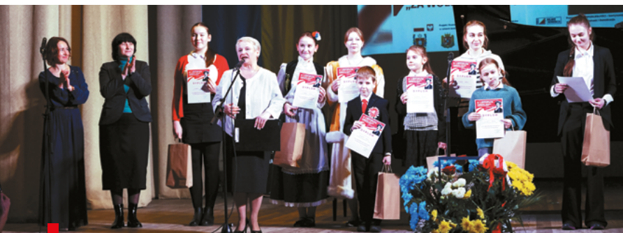
Zwycięzcy VII Konkursie Recytatorskiej Polskiej Poezji im. Walentego Grabowskiego otrzymali nagrody / Переможці VII Всеукраїнського конкурсу декламації польської поезії ім. Валентина Грабовського отримали нагороди