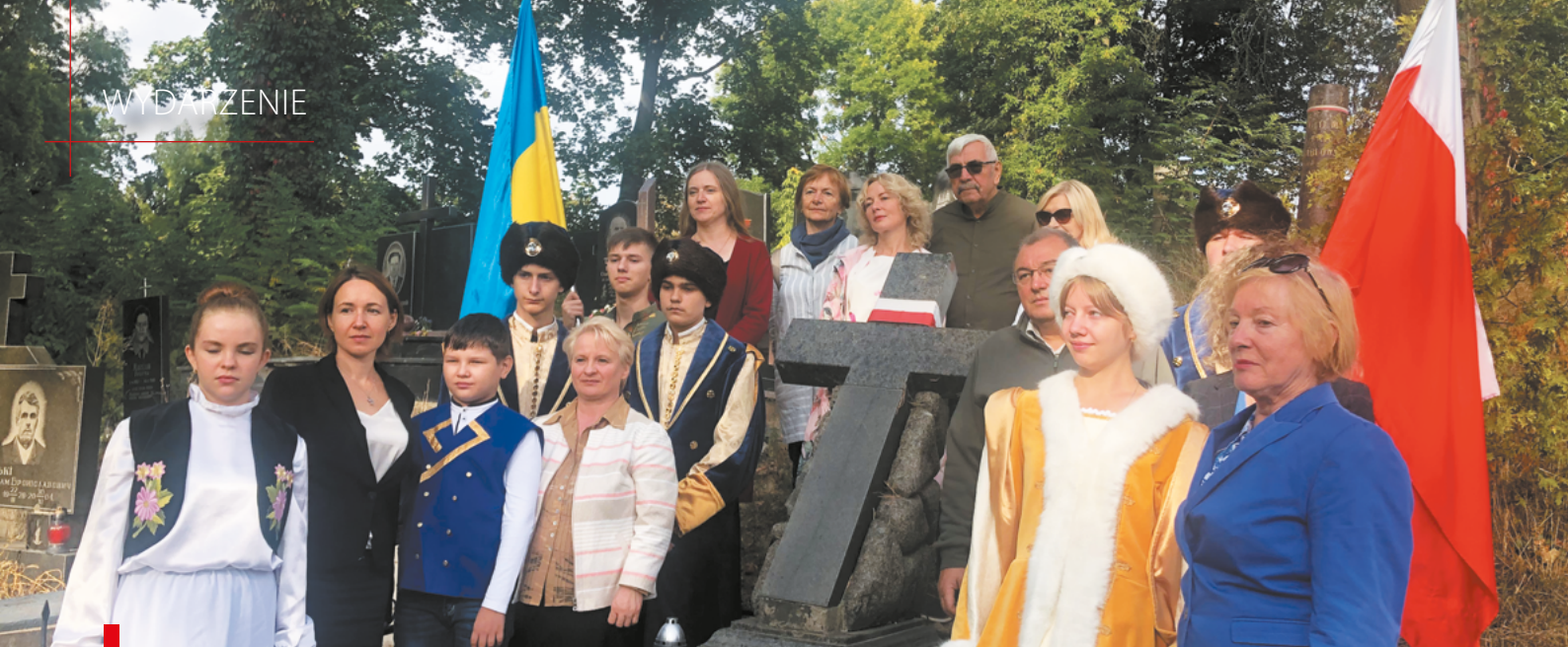
Delegacja złożyła biało-czerwone kwiaty i zapaliła znicze na grobie rodziców Ignacego Jana Paderewskiego – Jana Paderewskiego i Anny z d. Tańkowskiej na Cmentarzu Polskim w Żytomierzu / Делегація на Польському кладовищі у Житомирі поклала біло-червоні квіти та запалила свічки на могилі батьків Ігнація Яна Падеревського – Яна Падеревського та Анни, уродженої Тяньковської