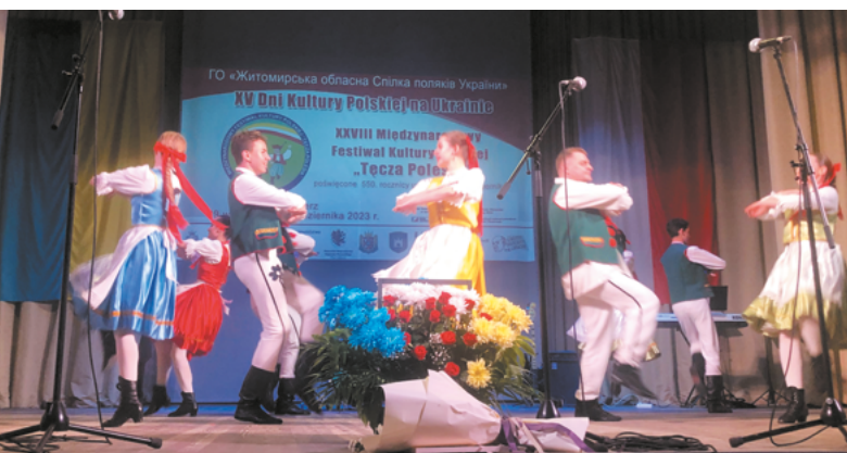
Zespół pieśni i tańca Polanie znad Dniepru z Kijowa / Ансамбль пісні й танцю «Поляни з-над Дніпра» з Києва