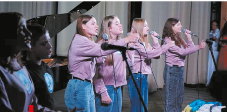
Kolorowe Ptaszki z Horoszowa na scenie Filharmonii Obwodowej / "Кольорові пташки" на сцені Житомирської філармонії