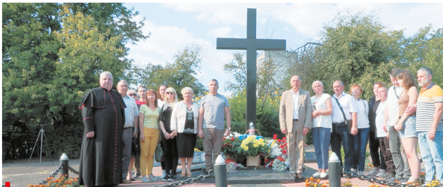
Polacy z Żytomierza, przedstawiciele władz i duchowieństwa oraz mieszkańcy miasta uczcili pamięć ofiar „operacji polskiej” NKWD przy czarnym krzyżu / Поляки Житомира, представники влади і духовенства та мешканці міста біля Чорного Хреста вшанували пам'ять жертв «польської операції» НКВД

Wiązanki kwiatów i znicze pojawiły się również na Cmentarzu Polskim na grobach Jana Paderewskiego i polskich żołnierzy poległych w 1920 roku.