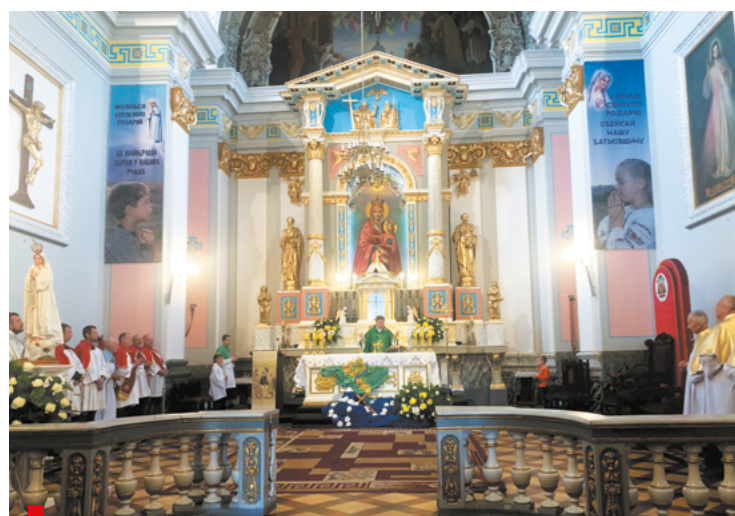
Msza święta w konkatedrze pw. św. Zofii / Свята меса у конкафедральному соборі св. Софії