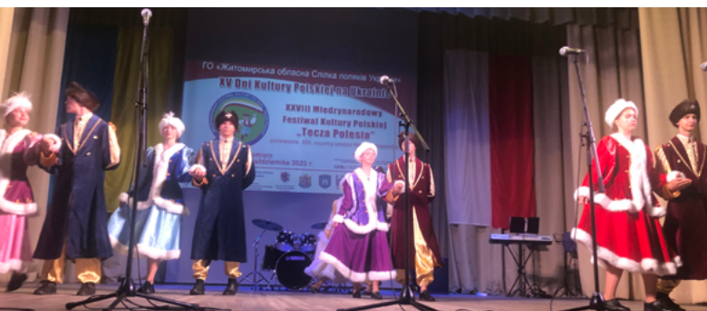
Polonez w wykonaniu zespołu Dzwoneczki / „Полонез” у виконанні ансамблю „Дзвонечки”