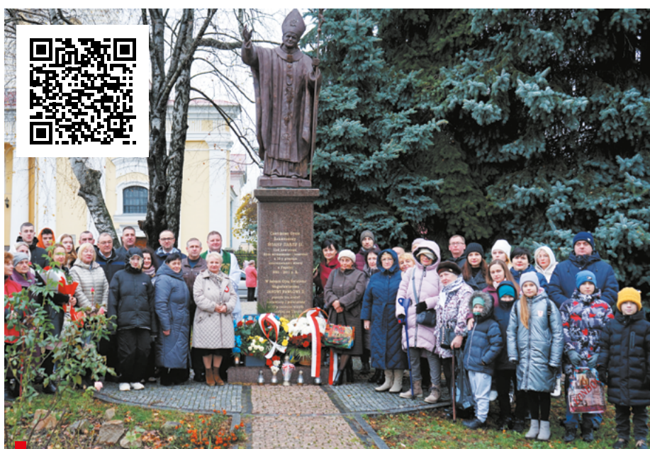
Polacy oddali hołd św. Janowi Pawłowi II / Поляки віддали шану св. Іоанну Павлу II

Zwycięzcy otrzymali dyplomy i nagrody rzeczowe: powerbanki, książki, notatniki, długopisy i termosy, które zostały wręczone także podczas koncertu.