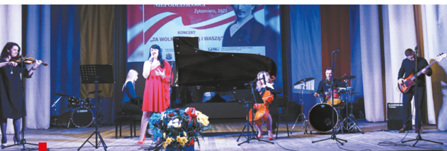
Zespół wokalnoinstrumentalny Crystal Light / Вокально-інструментальний ансамбль "Кришталеве світло"