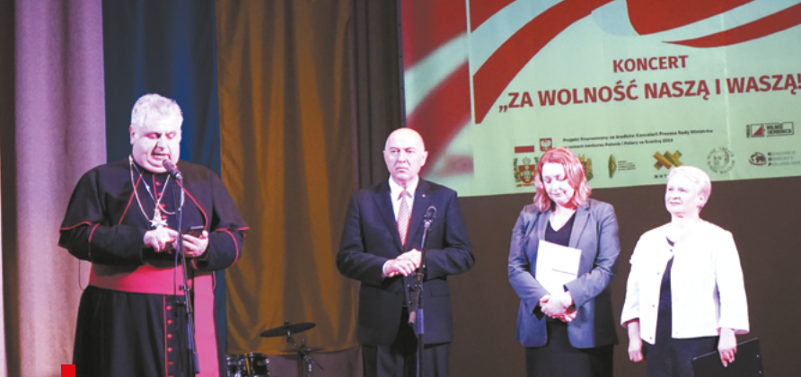
Organizatorzy i goście uroczystości / Організатори та гості заходів