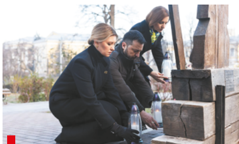
Wołodymyr Zełenski wraz z Oleną Zełenską i Maią Sandu zapalili znicze pod krzyżem w Alei Bohaterów Niebiańskiej Sotni w Kijowie Президент України Володимир Зеленський разом з дружиною Оленою Зеленською та Президенткою Молдови Маєю Санду запалили свічки під Хрестом на алеї Героїв Небесної Сотні в Києві

Aby uczcić 10. rocznicę powstania na Majdanie Niepodległości, do stolicy Ukrainy przybył również przewodniczący Rady Europejskiej Charles Michel. Odbił trójstronne spotkanie z prezydentem Wołodymyrem Zełenskim i prezydentem Maią Sandu.