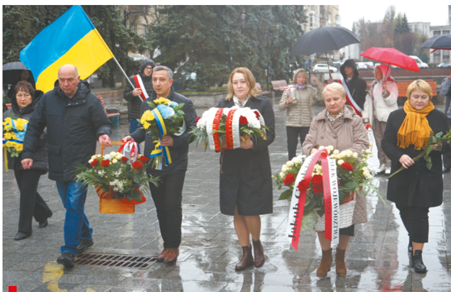
Uczestnicy uroczystości złożyli biało-czerwone i żółto-niebieski kwiaty przed pomnikiem obrońców Ukrainy w wojnie z rosyjskim agresorem / Учасники заходу поклали біло-червоні та синьо-жовті квіти до пам'ятника Захисникам України у війні з російським агресором