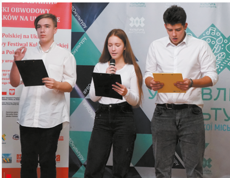
Uczniowie Polskiej Szkoły Sobotnio-Niedzielnej im. I. J. Paderewskiego i członkowie teatru ModernPol zaprezentowali sylwetkę Mikołaja Kopernika / Учні польської суботньо-недільної школи ім. І. Я. Падеревського та учасники театру ModernPol представили життєпис Миколи Коперника