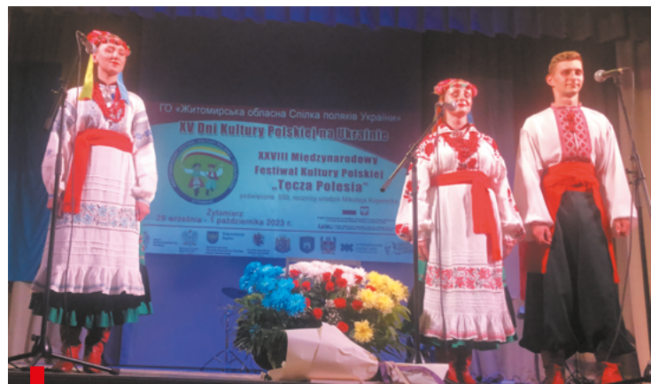
Folkowy zespół Rodosław z Żytomierza / Фольклорний ансамбль національного обряду "Родослав" із Житомира