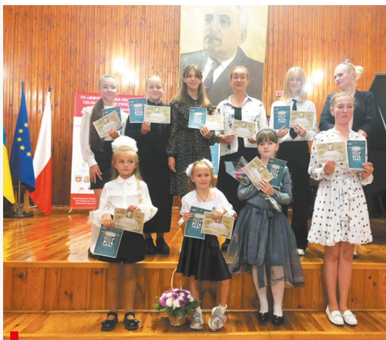
Uczestnicy koncertu w Szkole Muzycznej nr 1 im. Borysa Latoszyńskiego / Учасники концерту в музичній школі № 1 ім. Бориса Лятошинського