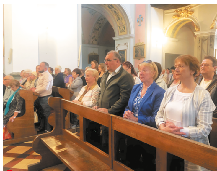
Obecni w konkatedrze modlili się za pokój na Ukrainie oraz twórców polskiej i ukraińskiej kultury, organizatorów, uczestników i sponsorów XV Dni Kultury Polskiej na Ukrainie / Присутні у конкафедральному соборі молилися за мир в Україні, за творців польської та української культури, організаторів, учасників та спонсорів XV Днів польської культури в Україні