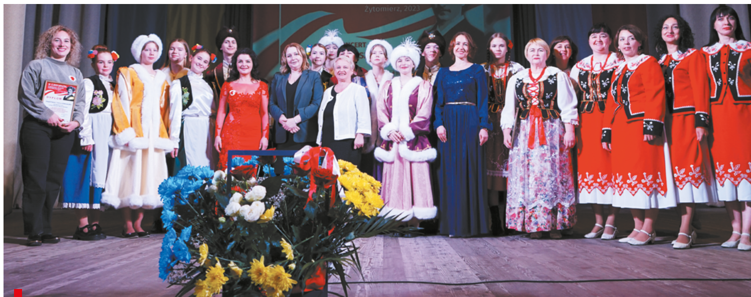
Piękną tradycją jest świętowanie w Żytomierzu odzyskania niepodległości przez Polskę / Це гарна традиція святкувати відновлення незалежності Польщі в Житомирі