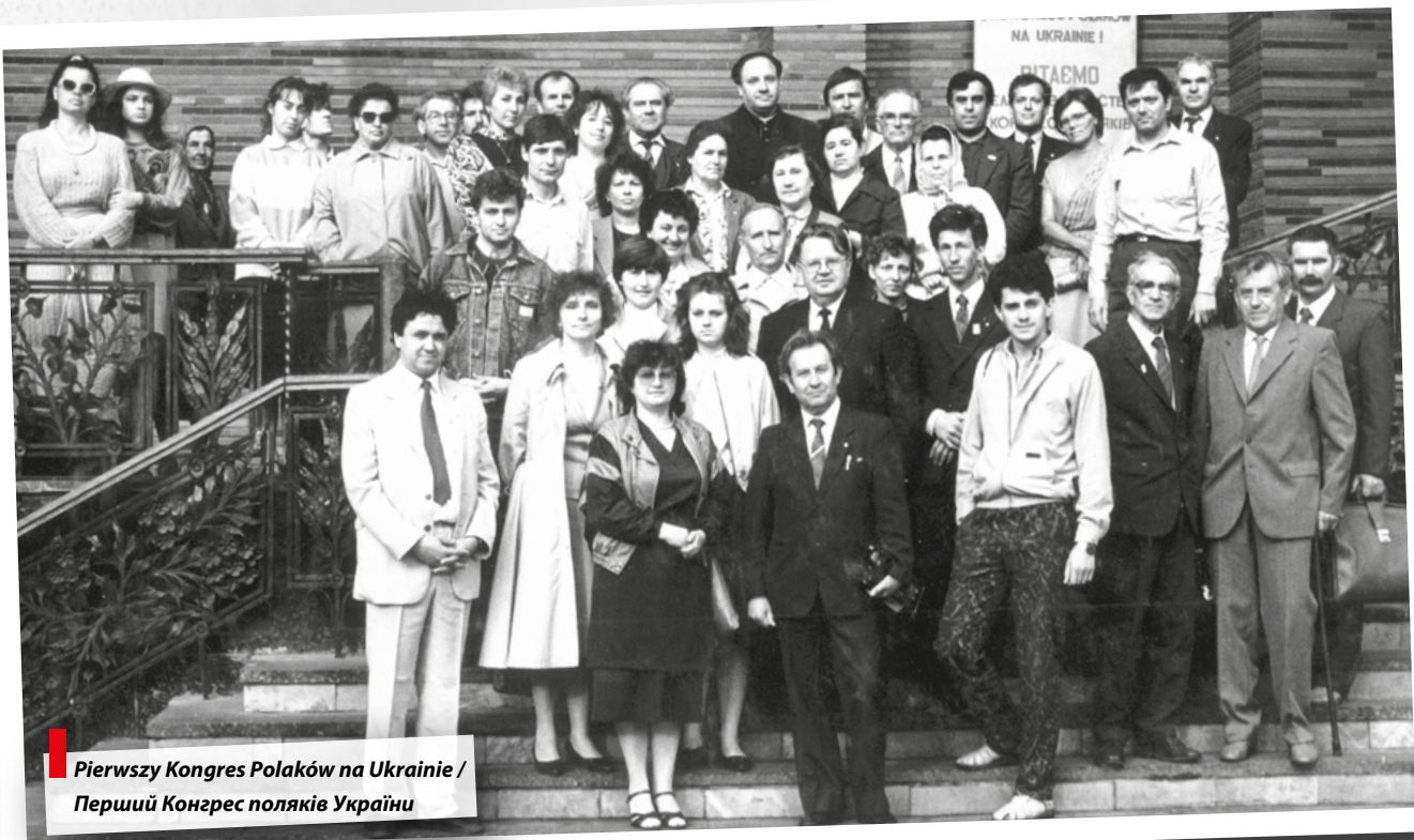
Pierwszy Kongres Polaków na Ukrainie / Перший Конгрес поляків України