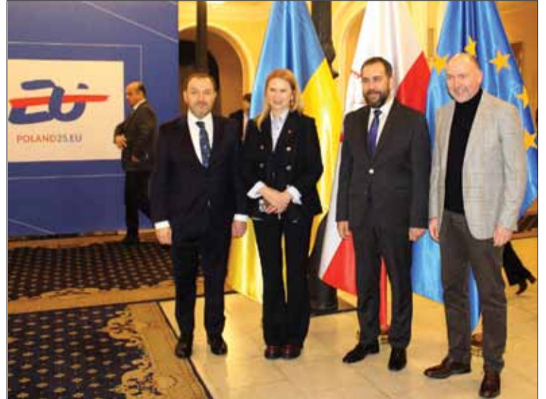
Na zaproszenie Chargé d'affaires Rzeczypospolitej Polskiej w Ukrainie Pana Piotra Łukasiewicza na koncert przybyli czcigodni goście, w tym wiceprzewodnicząca Rady Najwyższej Ukrainy Olena Kondratiuk

W imieniu rządu ukraińskiego przemówienie powitalne wygłosili: wiceprzewodnicząca