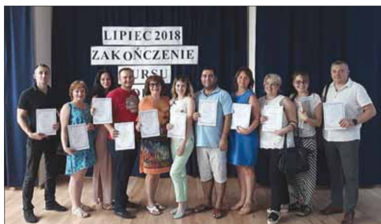
Kursy doskonalenia metodycznego (Warszawa, 2018)