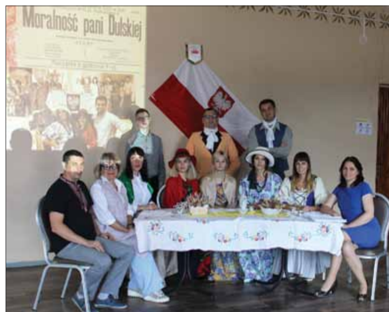
Narodowe Czytanie 2021