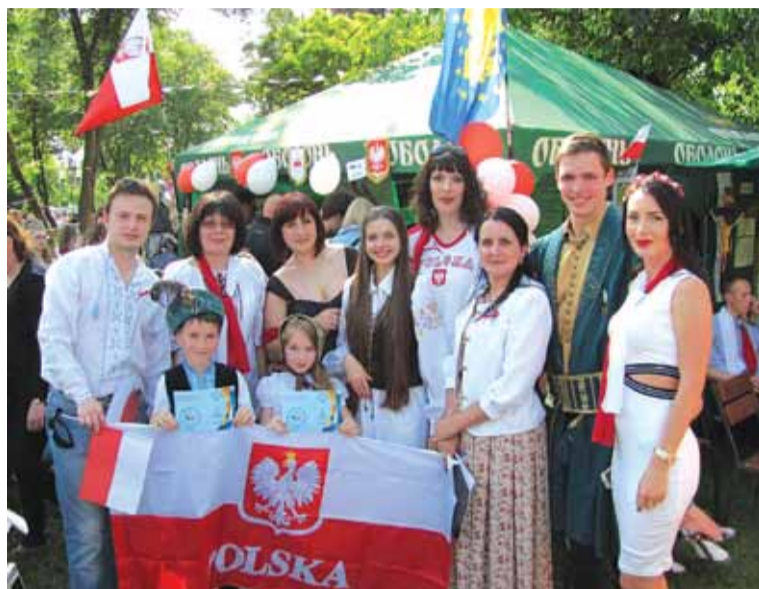
Święto mniejszości narodowych w Krzywym Rogu

Charakterystyka organizacji (osiągnięcia): Nasza organizacja jest mostem między kulturami. Centrum pełni rolę po-