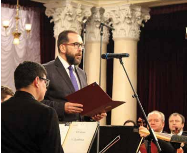
Przed koncertem Chargé d'affaires Rzeczypospolitej Polskiej na Ukrainie Piotr Łukasiewicz wygłosił przemówienie powitalne do zgromadzonych