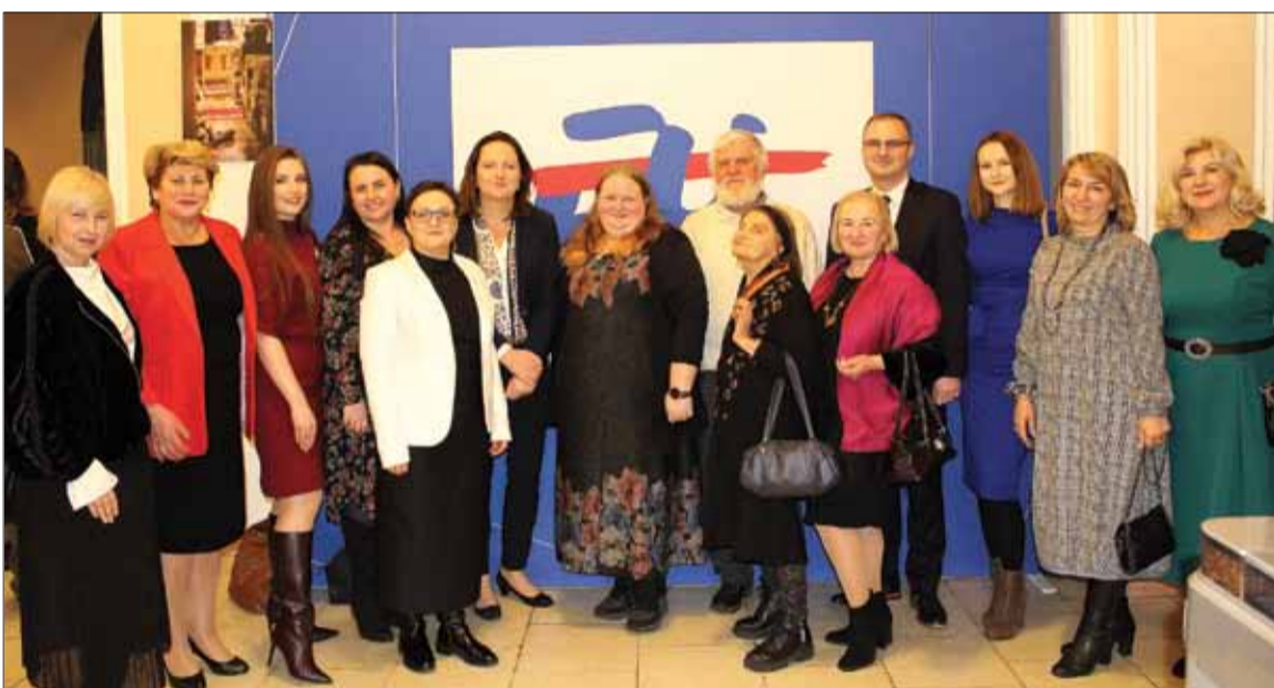
Polscy dyplomaci w gronie przedstawicieli społeczności polskiej Kijowa