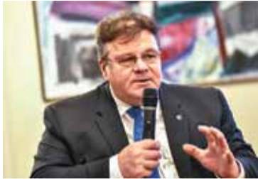
Linus LINKEVIČIUS Były minister spraw zagranicznych oraz minister obrony Litwy.