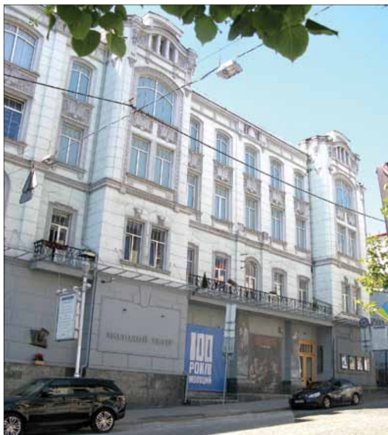
Ul. Prorizna 17- w tym budynku mieścił się Państwowy Teatr Polski w Kijowie