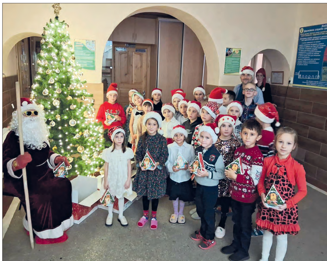
Stara Huta (Stara Krasnoszora)