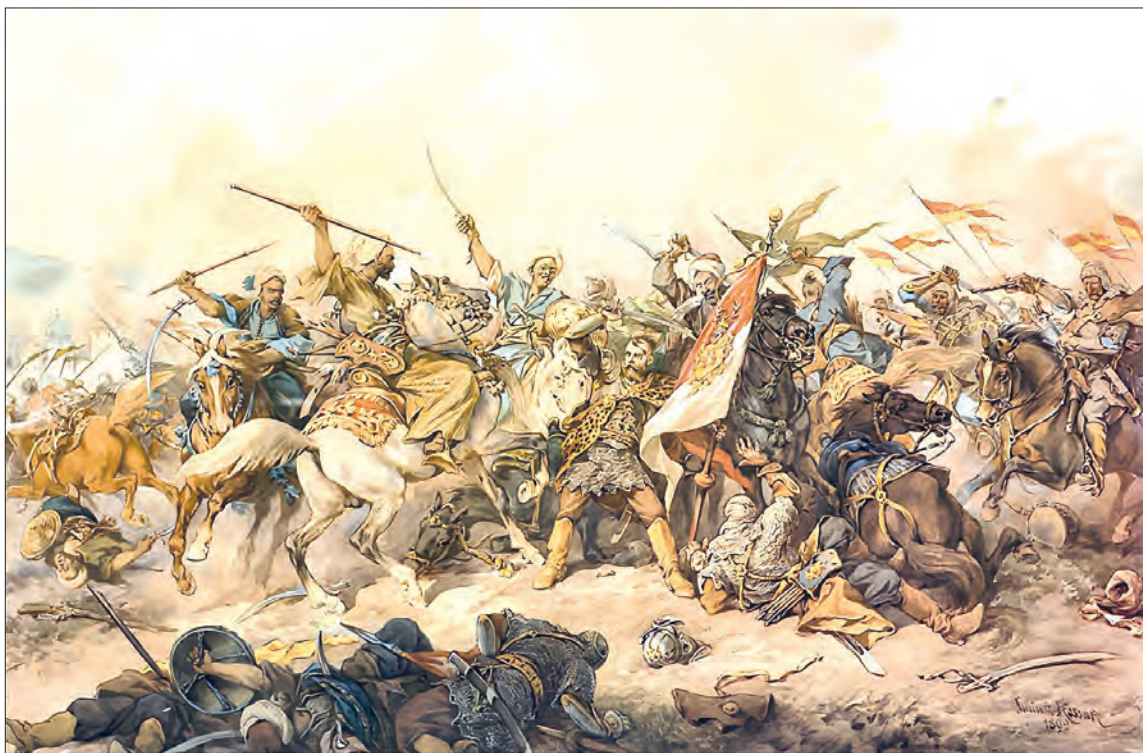
Obrona polskiego sztandaru pod Chocimiem, 1892 r.