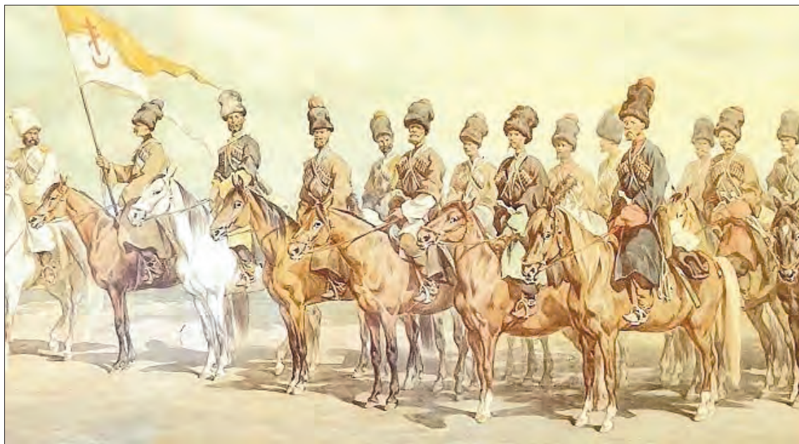
Juliusz Kossak - «Kozacy dońscy».