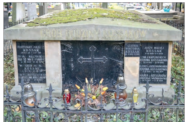
Grobowiec rodziny Kossaków na cmentarzu Rakowickim. zm. 3 lutego 1899 w Krakowie).

Przygotowane przez Janinę BILIŃSKĄ na podstawie materiałów pochodzących z różnych źródeł.