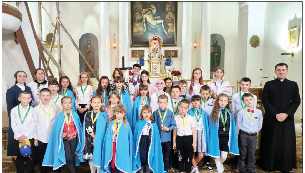
Uroczystość Pierwszej Komunii Świętej.