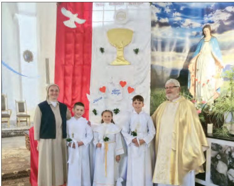
Stowarzyszenie Dzieci i Młodzieży Maryi w Starej Hucie powiększyło się o nowych członków.