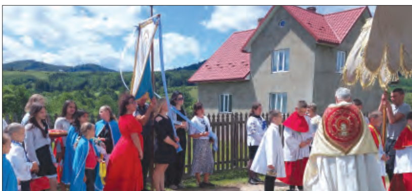
Uroczysta procesja Bożego Ciała w Starej Hucie przeszła tradycyjnie do czterech ołtarzy ulicami: Adama Mickiewicza, Tarasa Szewczenki i Jurija Fedkowycza.