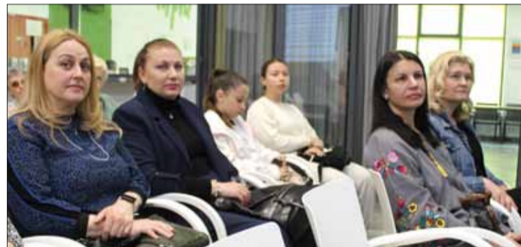
Organizator prezentacji – Polskie Kulturalno-Oświatowe Stowarzyszenie «Rodzina» w Browarach