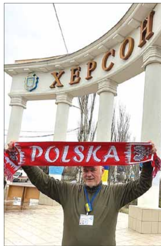
Wkrótce po wyzwoleniu

M.M.: Pierwsze odznaczenie otrzymałem w 2016 roku, drugie też