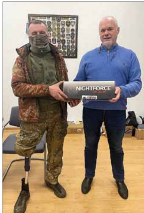
Niezłomny duch ZSU