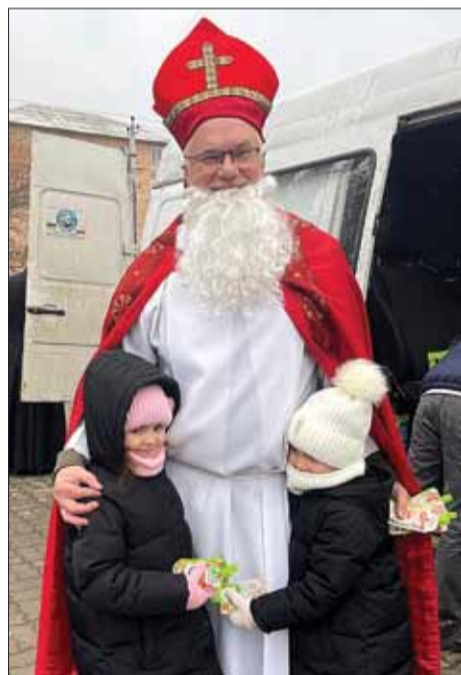
Uszczęśliwić ukraińskie dzieci zimą 2023 – to wyzwanie

M.M.: Zaraz, spróbuję to w tej chwili policzyć. To było około 20 turnusów, średnio po 20 osób. Myślę, że to było jakieś 400 osób. Oczywiście można to sprawdzić, podać dokładne dane, a nie przybliżone, ale nie zagłębiać się w te liczby. Dla mnie liczy się człowiek, który nam zaufał i powierzył swoje zdrowie, a może nawet życie, naszym lekarzom