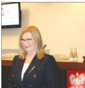
WICEMARSZAŁEK SEJMU RP MAŁGORZATA MARIA GOSIEWSKA.