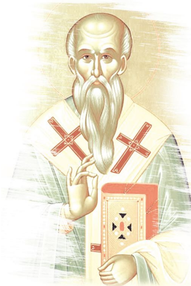
W ikonografii św. Polikarp przedstawiany jest jako męczennik lub jako biskup.

Należy do grona Ojców Apostolskich, którzy depozyt wiary i sukcesję apostolską odebrali z rąk najbliższych uczniów Chrystusa. Do końca gorliwie bronił prawowierności, utwierdzając w niej swoją trzodę. Oddał życie za wiarę w Jezusa.