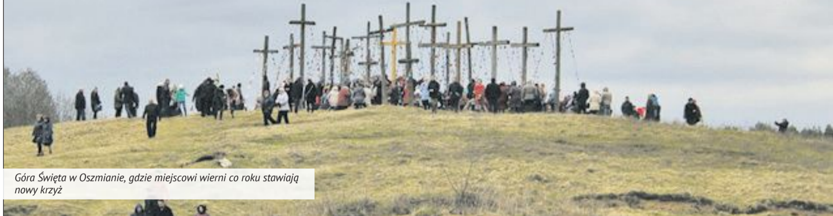
Góra Święta w Oszmianie, gdzie miejscowi wierni co roku stawiają nowy krzyż