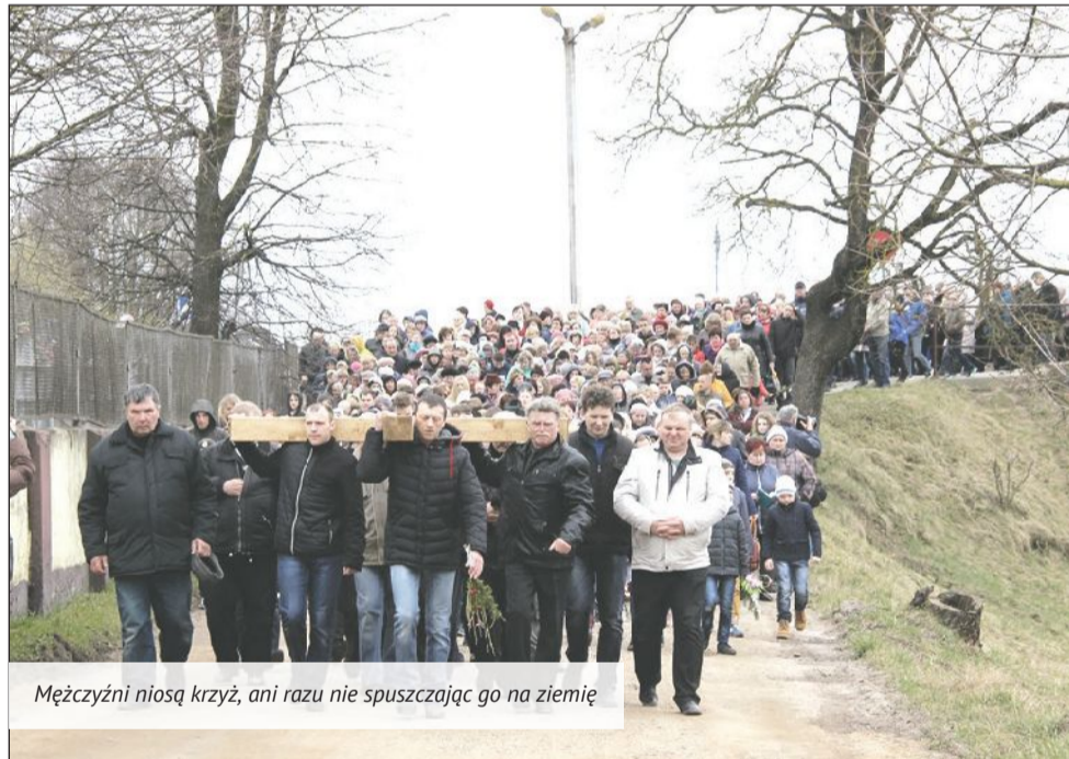
Mężczyźni niosą krzyż, ani razu nie spuszczając go na ziemię

Niektórym Chrystus uchylił tajemnicę wydarzeń Wielkiego Piątku, dając możliwość dotknąć Jego świętych ran. Wśród tych osób była św. Faustyna Kowalska, która wszystkie swoje cierpienia ofiarowała dla zbawienia świata. „Dziś w czasie Pasji ujrzałam Jezusa umęczonego, w ciernie ukoronowanego, a w ręku trzyma kawałek trzciny. Milczał Jezus, a żołdacy uwijali się na wyścigi, aby Go męczyć. Jezus nic nie mówił, tylko się spojrzał na mnie. W tym spojrzeniu wyczułam tak straszną mękę Jego, że my nie mamy nawet pojęcia co ucierpił Jezus dla nas przed ukrzyżowaniem...” (Dz 948).