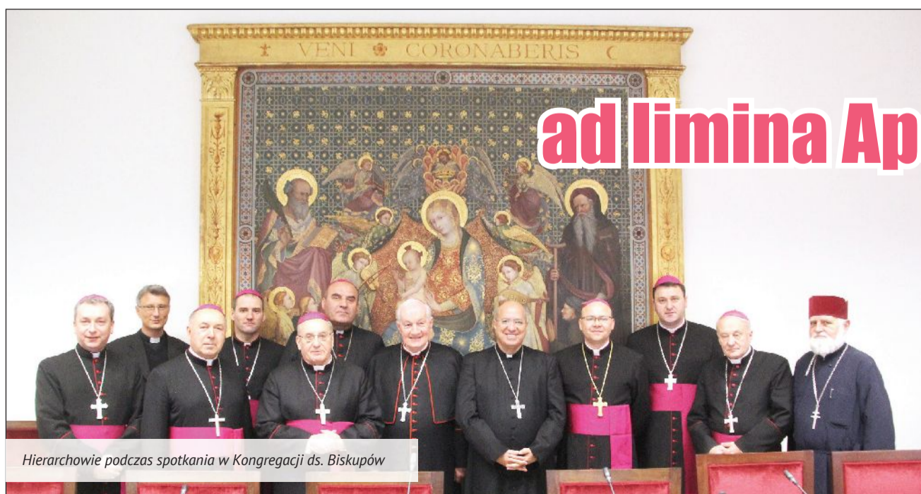
Hierarchowie podczas spotkania w Kongregacji ds. Biskupów