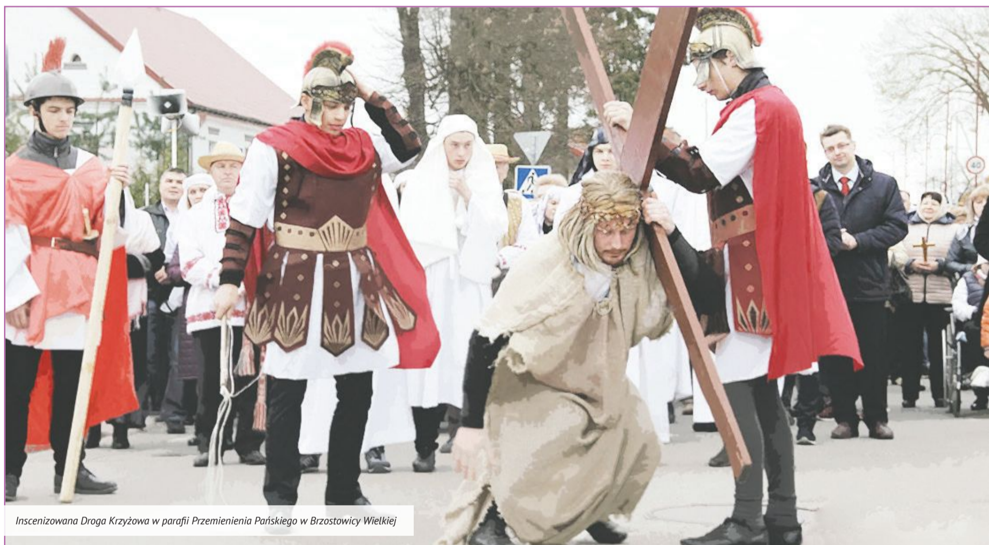
Inscenizowana Droga Krzyżowa w parafii Przemienienia Pańskiego w Brzostowicy Wielkiej

Środą Popielcową w Kościele rozpoczął się Wielki Post. W owocnym przeżywaniu okresu pokuty wiernym sprzyja udział w nabożeństwie Drogi Krzyżowej. Dlaczego tak ważne jest nie ominąć go uwagą oraz jaki plon zdobywa człowiek, ze skupieniem czerpiący z wielowiekowej tradycji?