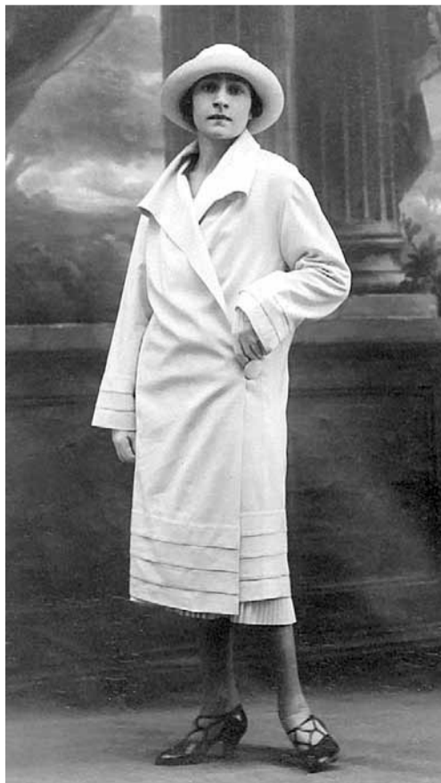
Irena Krzywicka: polska feministka, pisarka, publicystka i tłumaczka, propagatorka świadomego macierzyństwa, antykoncepcji

Jesienią 1939 roku Żeleński zaczął wyklądać na lwowskim Uniwersytecie odczyty o Prouście. W tych ciężkich czasach, zimą kiedy temperatura spadała do minus 35 stopni, tłumy ludzi przychodziły słuchać opowiadań Boya o tak odległym, wręcz nierealnym paryskim