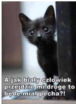
A jak biały człowiek przejdzie mi drogę to będę miał pecha?!

Najpopularniejszym przykładem wykorzystania tego związku frazeologicznego jest niewątpliwie w literaturze polskiej ballada Adama Mickiewicza „Pani Twardowska”. Kiedy mistrz Twardowski usiłuje wymknąć się diabłu, stawia przed Mefistofešem trzy trudne do wypełnienia zadania. Pierwsze z nich składa się z kilku poleceń, między innymi bohater żąda od diabła: „Skręć mi przy tym biczyk z piasku, / Aby miał czym konia chlostać”.