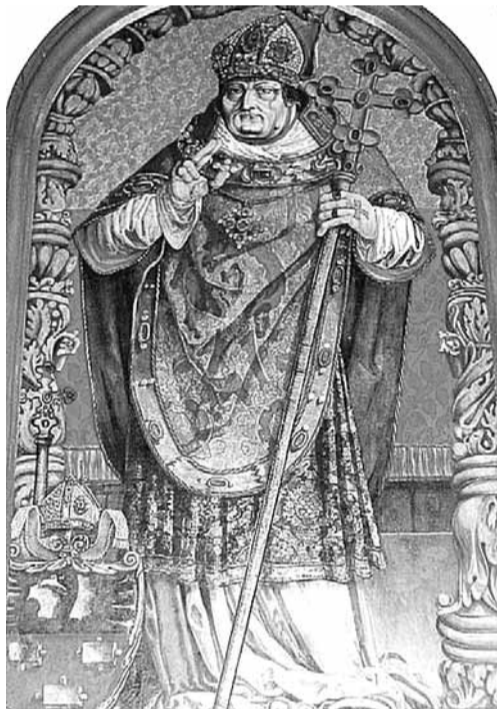
Portret Piotra Gamrata Sulimy w kościele oo. Franciszkanów w Krakowie

Wielkie znaczenie okazywano na Litwie socynianiom (nazwa wywodząca się od nazwiska orędowników kalwinizmu braci Fausta i Leliusza Sozzini) Ich apologetami od roku 1553 stali się Mikołaj Radziwiłł Czarny - wojewoda wileński, kanclerz Wielkiego Księstwa Litewskiego, czołowy potentata Księstwa i jego