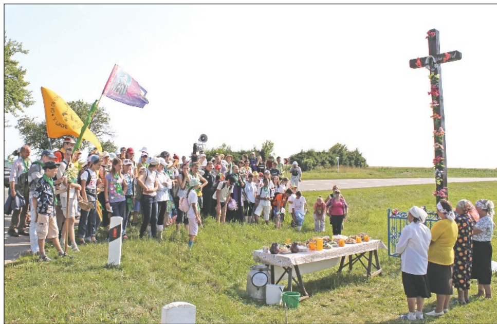
Ludzie spotykają pielgrzymów ze łzami w oczach: ich serca cieszą się z odważnych świadków wiary

Pamiętam, podczas pierwszej pielgrzymki wydawało mi się trochę dzikie zapukać do drzwi nieznanym ludzi, poprosić o pozwolenie, aby się umyć i przemocować (choć wiedziałam, że dla gospodarzy nie będzie to niespodzianka, ponieważ przygotowawali się do przyjęcia nas u siebie). Z czasem nauczyłam się pokonywać swój strach, ponieważ zrozumiałam, że nie warto wstydić się ludzi, którzy otwierają nie tylko drzwi, ale też swoje serca, z łatwością rozpoczynają rozmowę i szczerze zapraszają do domu. Uważam, że taka gościnność ludzi to prawdziwy gest chrześcijańskiego miłosierdzia.