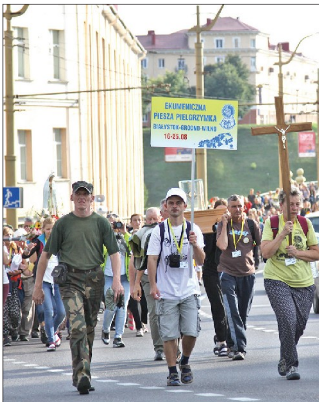
Serce pielgrzymy w trakcie drogi nasiąka wrażeniami aż do kolejnej wędrowki