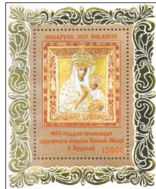
Cudowny obraz Matki Bożej Budstawskiej na zestawie znaczków, wydanym przez pocztę Republiki Białorusi

W 2013 roku białoruska poczta wydała zestaw znaczków na 400-lecie przybycia cudownego obrazu Matki