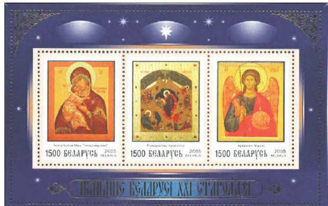
Obraz Matki Bożej Włodzimierskiej (pierwszy z lewej strony) na zestawie znaczków „Ikony Białorusi XXI wieku”

Jednym z pierwszych obrazów Królowej Niebieskiej jest starożytna ikona Bogarodzicy „Nienaruszalna Ściana”. Jej oryginał znajduje się w otwartym Soboru Sofijskiego w Kijowie. W ciągu