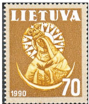
Obraz Matki Bożej Ostrobramskiej na znaczku pocztowym Litwy

dzieńskiej – Matki Bożej Ostrobramskiej, która w cudownym obrazie w sposób szczególny jest Orędowniczką ziem litewskich, białoruskich i polskich już w ciągu ponad 300 lat. Piękny obraz Najświętszej Maryi