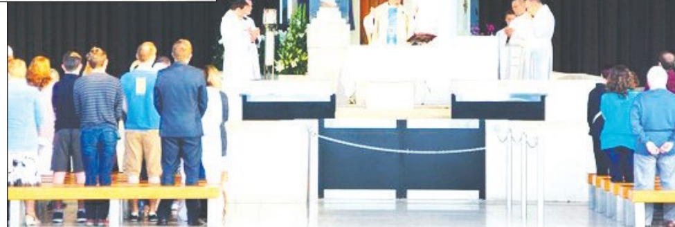
Kaplica Objawień, zbudowana w miejscu, gdzie pastuszkowie zobaczyli Maryję

jest jednym z 5 największych kościołów świata.