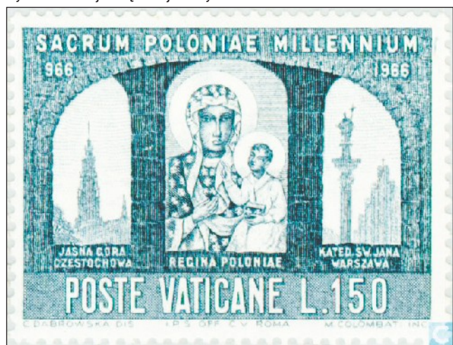
Wizerunek Matki Bożej Częstochowskiej na znaczku Watykanu

dzieńskiej – Matki Bożej Ostrobramskiej, która w cudownym obrazie w sposób szczególny jest Orędowniczką ziem litewskich, białoruskich i polskich już w ciągu ponad 300 lat. Piękny obraz Najświętszej Maryi