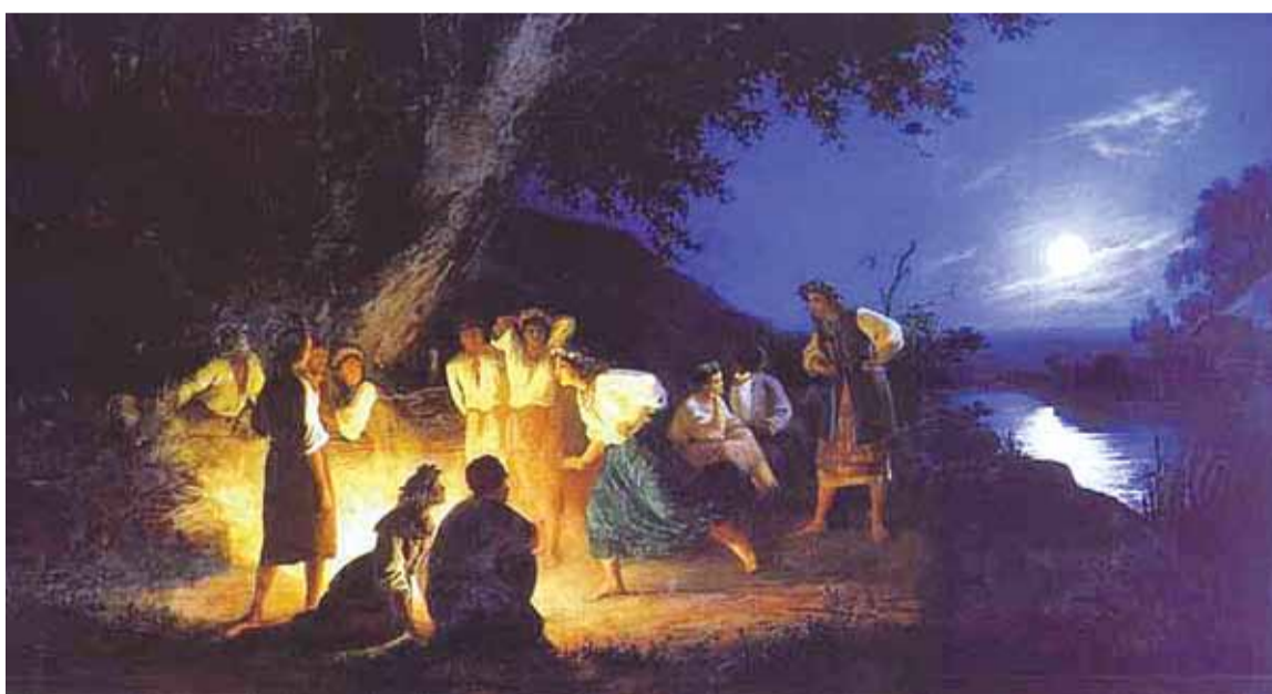
Henryk Siemiradzki, Noc świętojańska , 1892

Jedną z tych prac była trzytomowa monografia Sanockie-Krośnieńskie , uważana za bodaj najbardziej kompleksową publikację folklorystyczną twórczości ludowej regionu pogranicza. Trzytomowe wydanie „Sanockie-Krośnieńskie” O. Kolberga: Kultura ludowa Łemków poświęcono zapisom twórczości