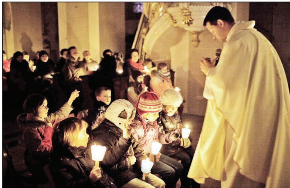
Trzymając w ręku lampion stajemy się świadkami światła Chrystusa, które nosimy w sercu

W Kościele katolickim trwa Adwent – czas, kiedy jesteśmy w radosnym oczekiwaniu na narodzenie Zbawiciela. W tym czasie wierni w swoich modlitwach szczególnie często zwracają się do Maryi Panny, aby przez Jej wstawienie lepiej przygotować się do świętowania narodzin Chrystusa, i dołączają się do pięknej tradycji – udziału w Mszach Świętych roratnich odprawianych na cześć Matki Bożej.