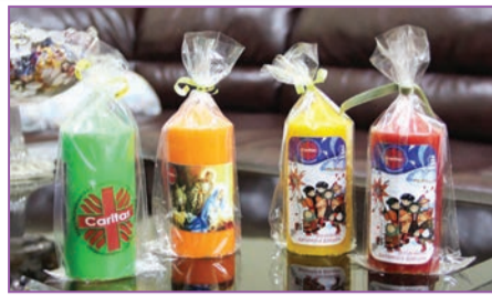
Franciszka Ksawerego w Grodnie, a także w innych parafiach diecezji.

Świece są rozprowadzane przez kościoły diecezji Grodzieńskiej przez cały Adwent. Ofiary zebrane podczas akcji zostaną przekazane na pomoc dzieciom z ubogich rodzin. Wziąć udział w akcji można w każdą niedzielę w katedrze Św.