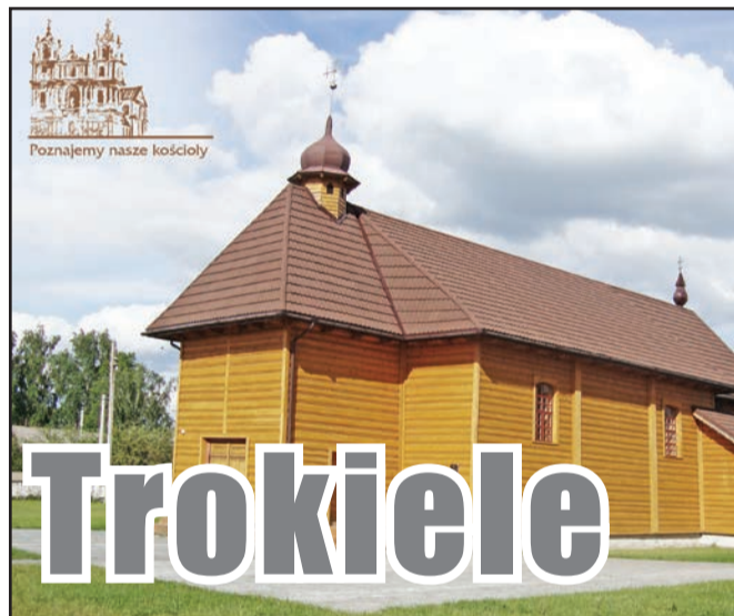
Wygląd zewnętrzny świątyni