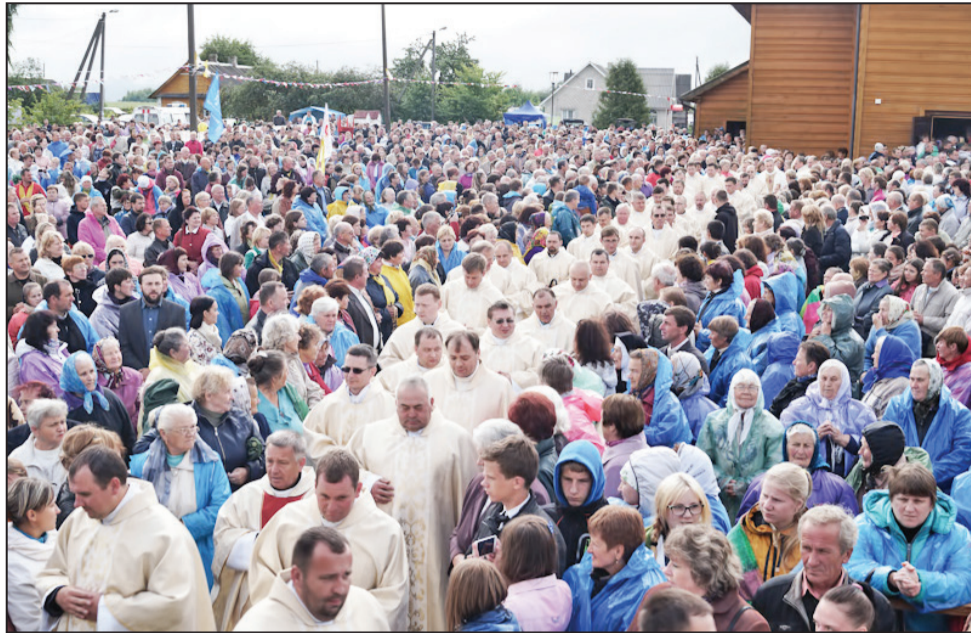
Na uroczystości w sanktuarium Matki Bożej w Trokielach co roku przybywają tysiące wiernych

Mówiąc o drodze swego powołania, osoby konsekrowane przypominały uczestnikom uroczystości w Trokielach o tym, że człowiek idzie za Chrystusem, ponieważ Jezus spojrział na niego z miłością. Opowiadając o swej codziennej służbie Kościołowi, osoby konsekrowane zachęciły młodych ludzi do zdobycia się na odwagę, zdecydowania się na ten krok – pójść za Jezusem.