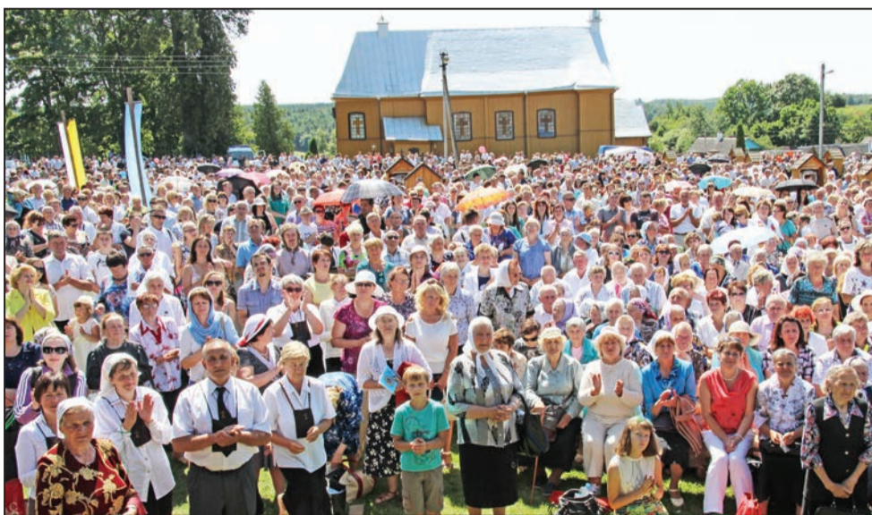
Uroczystości na cześć Matki Bożej Szkaplerznej zebrały licznych wiernych, którzy odczuwają potrzebę spotkania z Matką