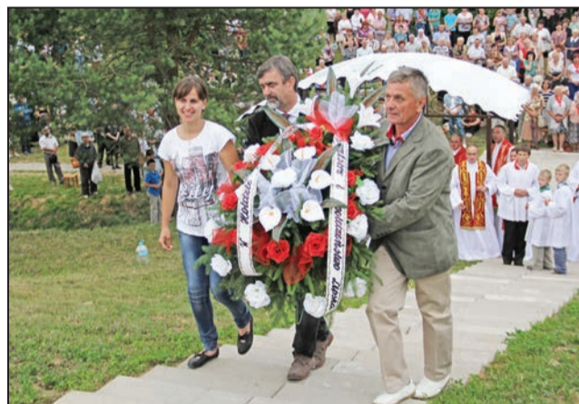
Podczas uroczystości w naumowickim lesie

W sobotę 18 lipca o godzinie 15 z kościoła parafialnego w Adamowiczach wyruszyła pierwsza w historii diecezji grodzieńskiej piesza pielgrzymka do miejsca męczeńskiej śmierci mieszkańców Grodna i Lipska (dziś teren Polski), którzy 13 lipca 1943 roku zostali rozstrzelani przez hitlerowców na Forcie nr 2 niedaleko Naumowiczów.