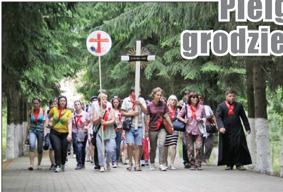
Pielgrzymi z modlitwą kroczą do miejsca, gdzie zginęli mieszkańcy Grodna i Lipska