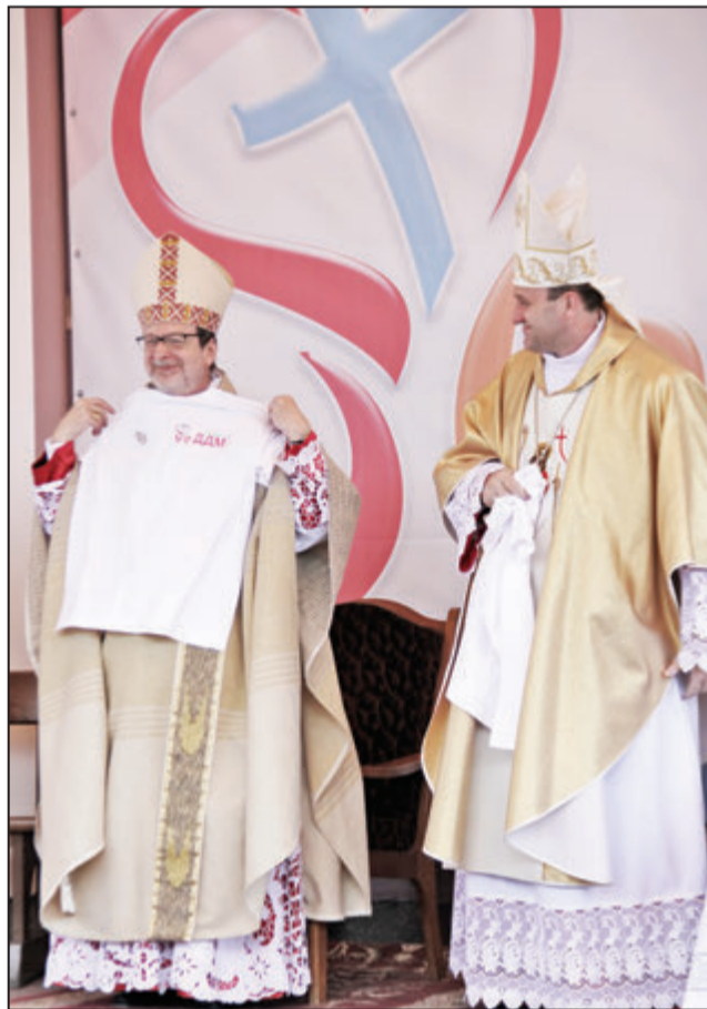
Prezent dla Nuncjusza od młodych ludzi