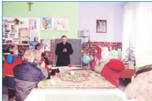
Podczas katechezy dla dzieci

W 2005 roku odbyło się to długo oczekiwane wydarzenie.