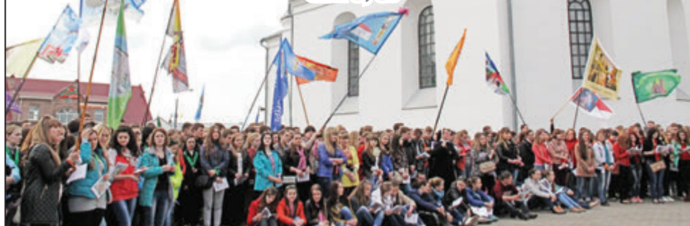
Młodzi podczas wspólnej modlitwy