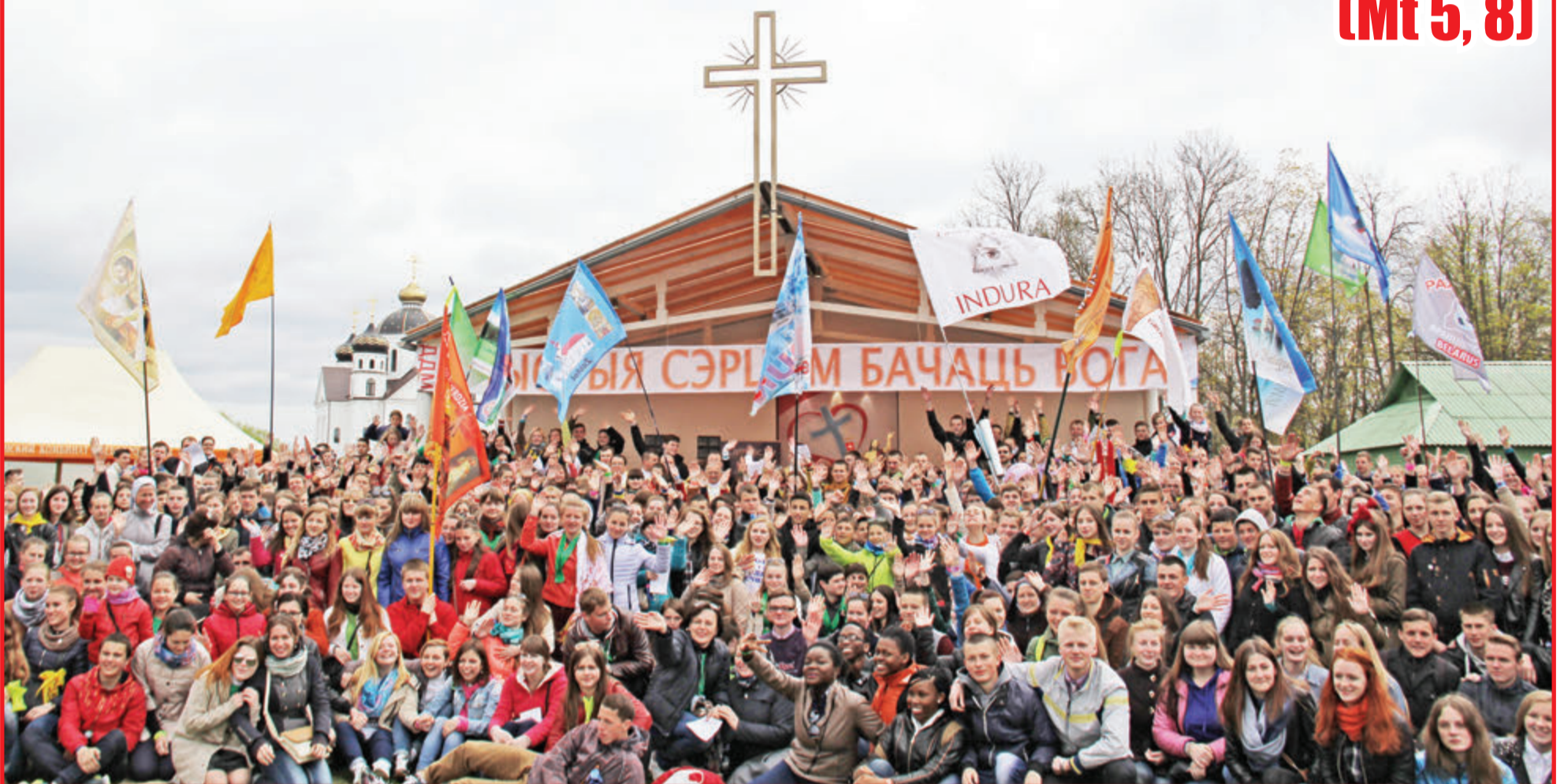
Wspólne zdjęcie na zakończenie Dni Młodzieży w Smorgoniach

W dniach 1–3 maja w Smorgoniach odbyły się XXII Diecezjalne Dni Młodzieży. W tym czasie miasto wyglądało inaczej niż zwykle, gdyż przy parafii św. Michała Archanioła zgromadziło się około dwóch tysięcy młodych ludzi z diecezji Grodzieńskiej, a także z poza jej granic, którzy przybyli tu, aby wspólnie chwalić Boga modlitwą, śpiewem i tańcem, rozważając nad darem czystego serca.