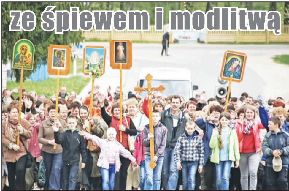
W Dniu Matki pielgrzymi licznie przychodzą do Sanktuarium Matki Bożej Jasnogórskiej w Kopciowce

Jak co roku niezapomnianym wielkim przeżyciem, pełnym wzruszenia i radości, stała się dla pielgrzymów z Grodna droga do sanktuarium Matki Bożej na Wzgórzu Nadziei w Kopciowce. Z okazji Dnia Matki, który jest obchodzony w diecezji Wzgórzskiej w pierwszą niedzielę maja, matki wraz ze swoimi dziećmi i mężami przybyły do tego prawdziwie świętego miejsca, żeby zawierzyć Matce Bożej Cierpliwie Słuchającej swoje prośby, złożyć dziękczynienia i poprosić o wstawiennictwo.