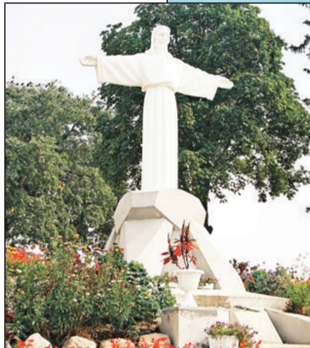
Figura Chrystusa Odkupiciela, postawiona przy kościele