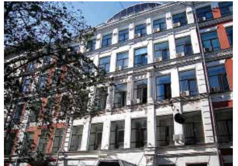
„Гімназія Стельмашенка” у Києві, де в період апогею розвитку польського національного району були створені Вищі педагогічні курси імені Фелікса Кона. Сьогодні це офіс комерційного банку.

Так, у 1925 році було створено Польський національний район з центром у селі Довбиш (у 1926 році перейменовано на Мархлевськ) на території нинішньої Житомирської області. При губернських комітетах створювалися польські відділи. В Києві діяло Центральне польське партійне бюро.