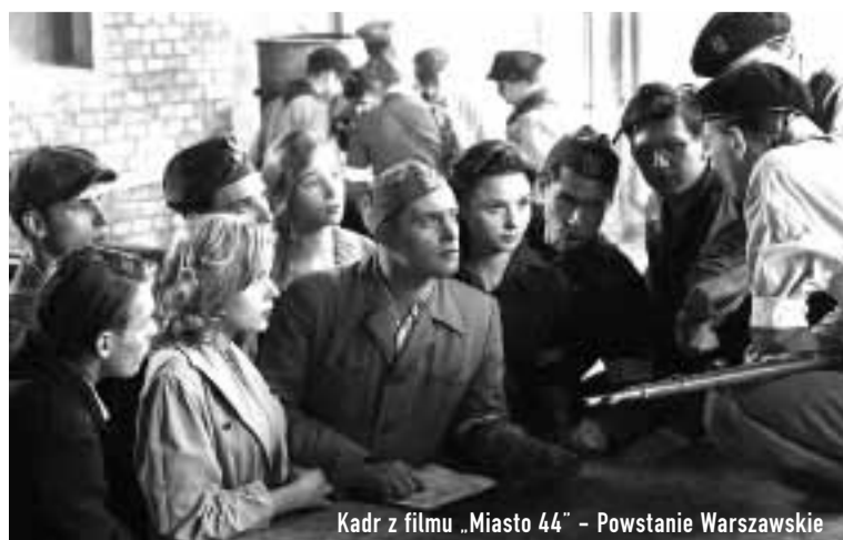
Kadr z filmu „Miasto 44” – Powstanie Warszawskie