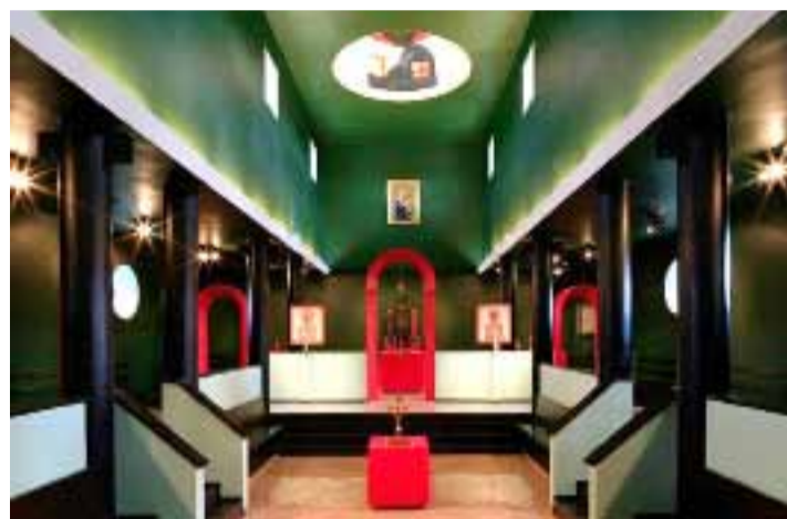
Cerkiew Narodzenia Przenajświętszej Bogurodzicy Białe Bórze (w województwie zachodniopomorskim)

Wybudowana w latach 1992-1997 według projektu profesora Jerzego Nowosielskiego we współpracy z architektem Bogdanem Kotarbą. Ta greckokatolicka świątynia nawiązuje do surowej architektury bazylik starochrześcijańskich. Wnętrze powtarza schemat trójnawowej bazyliki.