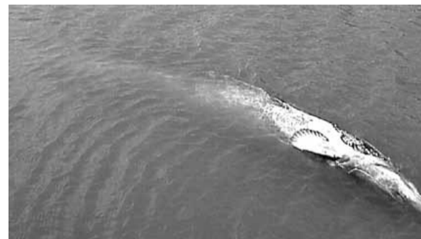
Dwumetrowy sum pływał brzuchem do góry na płytkiej wodzie pod mostem Śląsko-Dąbrowskim

Sum jest największym drapieżnikiem polskich wód, dorasta nawet do długości dwóch i pół metra i wagi stu kilogramów. Rozmawiałem z rybakiem, który krótko po wojnie łowił na