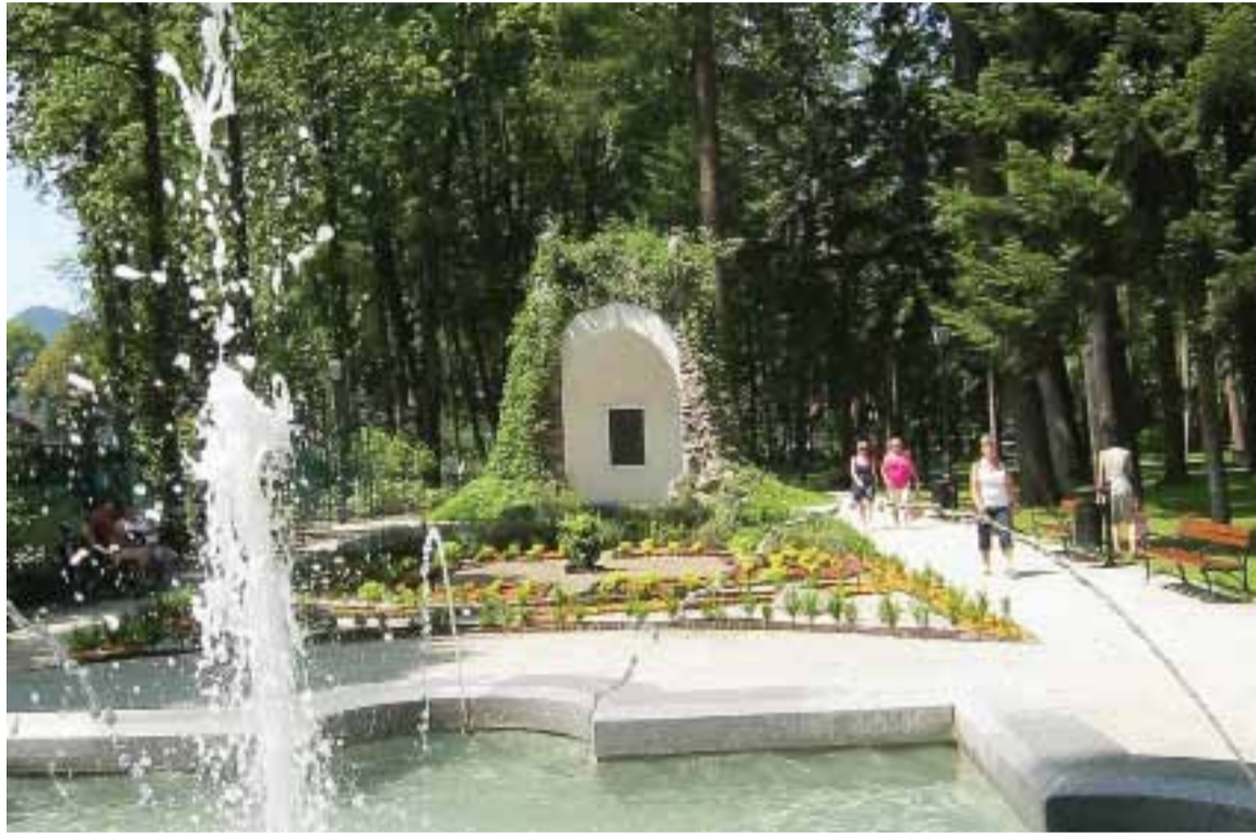
Wbudowana w kamienny kopiec tablica poświęcona Mikołajowi Zyplikiewiczowi

Także Lwów miał ulicę im. Mikołaja Zyplikiewicza (od