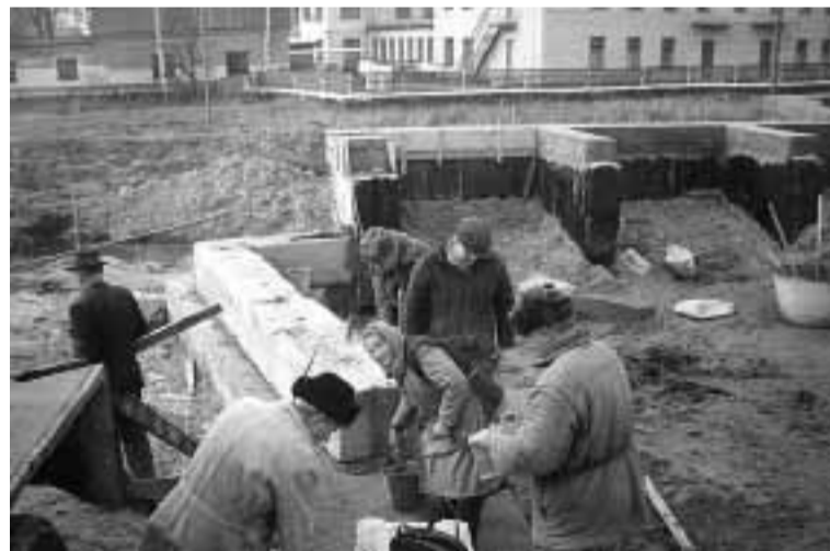
Budowa świątyni w Dowbyszu

na różne mało istotne rzeczy stwarza się wrażenie o rozproszeniu zarówno wysiłków jak i naszego strategicznego celu. A jest nim w miarę możliwości różniejsza odbudowa i wzrost liczby wspólnoty polskiej na