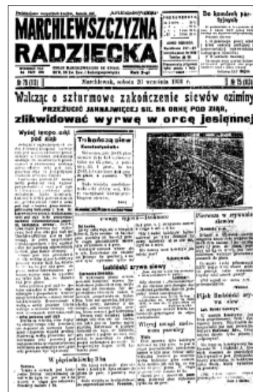
Gazeta nr 113 z dnia 26 września 1931 r. (Cyt.: „Pijak Rudziński zrywa siew”)

Dzięki wsparciu „Wspólnoty Polskiej” otrzymują podręczniki i inne pomoce do nauki języka polskiego. Około dwustu dzieci z 550 uczących się w szkole objętych jest katechezą. Krócej odrodzenie i kultywowanie tożsamości narodowej polskiej trzyma się na tych dwóch wielorybach – kościele i szkole. Chociaż stwierdzenie to jest oczywiste i proste, jednak sądząc z obserwowanej niekiedy krzątaniiny wokół starań o dotacje od Ukrainy i Polski, czyli od polskich i ukraińskich podatników,