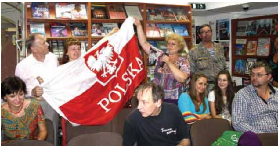
W finale spotkania dziennikarzom polskim podziękowali aktywiści z Majdanu, reprezentujący spoleczność polską stolicy

Kiedy zadaję sobie pytanie czy Majdan był nacjonalistyczny - odpowiadam, że zgodnie z tą definicją Majdan był w swej całości nacjonalistyczny i bardzo dobrze że tak było. Dodam, iż były na Majdanie momenty, które budziły i we mnie pewien strach na tle historycznych wspomnień. Ale właśnie na Majdanie zrozumiałem, że nie akceptując części Waszych historycznych bohaterów, jednocześnie możemy mieć inne wspólne cele, które będziemy realizować razem”.