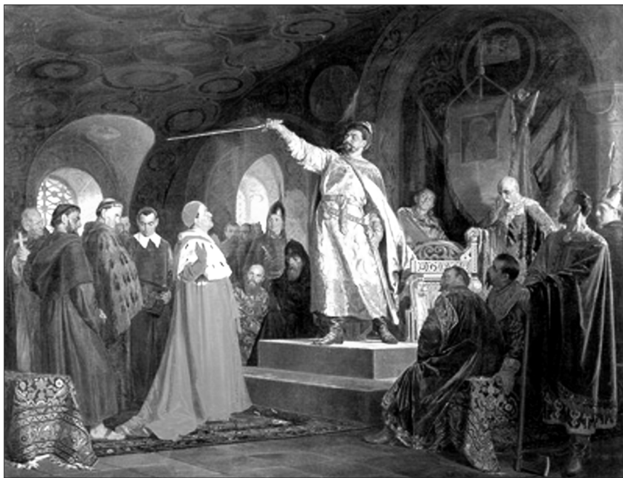
Roman Halicki przyjmuje nuncjusza papieskiego. Obraz pędzla Nikołaja Newrewa z 1875 r.

Zwolennicy polityki przymierza z książętami ruskimi tworzyli na dworze Kazimierza tzw. stronnictwo ruskie, któremu przewodzili wojewoda krakowski Mikołaj z Lisów i sandomierski magnat Mikołaj Skotnicki herbu Bogoria. Ten ostatni zapisał się w historii wyjątkowo szlachetnymi uczynkami wobec cystersów* - m.in. jako fundator klasztoru w Koprzywnicy i okazałych dóbr ziemskich na wschód od Wisły. Osadzeniu owych zakonników, ściągniętych aż z Francji, najprawdopodobniej przyświecała idea nie tylko