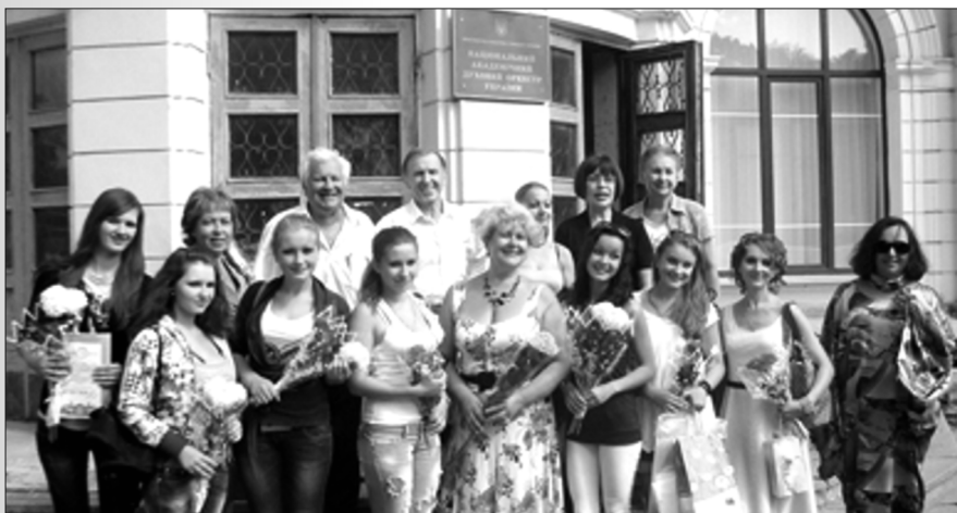
Młodych wykonawców i doświadczonych jurorów połączyła wspólna pasja – muzyka