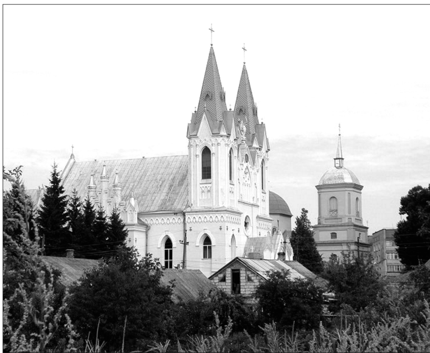
Костел Святої Анни в місті Бар

Летичеві Хмельницької області встановлено пам'ятник Папі Іоанну Павлу II. Костел Успія Пресвятої Діви Марії тут повернуто католикам наприкінці 1980-х років.