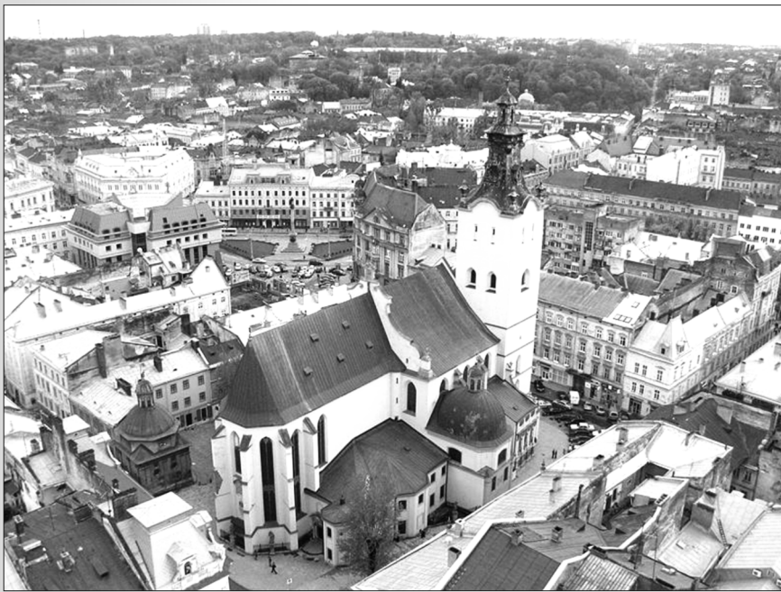
Латинський кафедральний собор (митрополитна базиліка-санктуарій Успія Пресвятої Діви Марії) у Львові

Головний храм центральної частини Львова, що презентує Західну Україну в почесному списку всесвітньої спадщини ЮНЕСКО, – Латинський кафедральний собор є показовою згадкою про найчисленнішу католицьку громаду міста з часів його перебування у складі Польського королівства, Речі Посполитої, Австрії, Австро-Угорської імперії та відродженої Польщі.