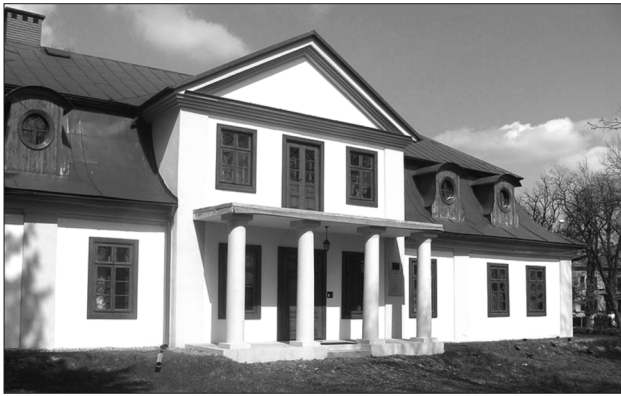
Plebania w Hrubieszowie, w której urodził się Bolesław Prus

W „Kurierze Warszawskim” od 1875 roku do 1887 roku ukazało się 345 felietonów tygodniowych autorstwa Głowackiego. Innym ważnym czasopismem w życiu artysty był „Kurier Codzienny”, w którym w latach 1887 – 1901 opublikował aż 373 felietonów. Lata 1905 – 1911 to okres współpracy Prusa z „Tygodnikiem Ilustrowanym”, dla którego napisał 178 kronik. W 1876 roku Prus rozpoczął współpracę z czasopismem „Ateneum” (do którego pisał głównie „Kroniki miesięczne”), natomiast w 1877 z tygodnikiem „Nowiny”. W 1882 objął redakcję tej gazety. Na jej łamach zamieścił m.in. kontrowersyjny dokument „Szkielet programu w warunkach obecnego rozwoju społeczeństwa”, w którym proklamował program pozytywistycznej pracy i opowiadał się przeciwko kolejnym powstaniom.