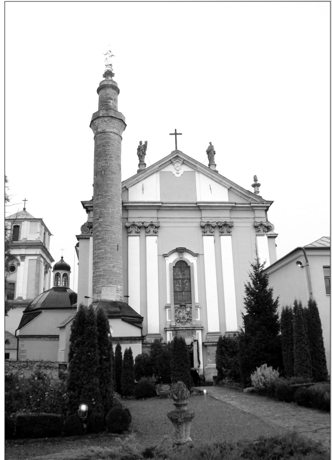
Кафедральний костел Святих Апостолів Петра і Павла в Кам'янці-Подільському

Долі костелів різні. Костел домініканського кляштору у Вінниці перебудований на православну церкву ще у XIX ст. Нині це Свято-Преображенський кафедральний собор Вінницької єпархії Української православної церкви Московського патріархату. У 1920 році православне духовенство приймало тут керівника відродженої Польщі Юзефа Пілсудського.