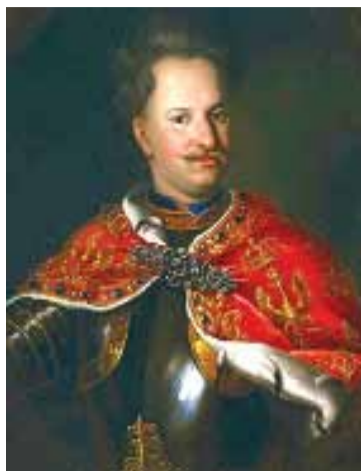
Stanisław Leszczyński, dwukrotnie wybierany królem Polski

nej w 1663 r., kiedy to powrócił na Ukrainę naddnieprzańską w poselstwie wiozącym buławę hetmańską Pawłowi Teterze. Wtedy objął po ojcu urząd podczaszego czernihowskiego, a także mocno podupadły na skutek napadów kozackich majątek Mazepińce. W czasie walki o urząd hetmański związał się z obozem późniejszego hetmana Prawobrzeża, Piotra Doroszenki. Na jego dworze pełnił funkcję dowódcy gwardii przybocznej, a następnie pisarza generalnego Prawobrzeża.