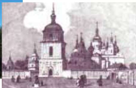
Staraniem Mazepy powstało wiele budowli w stylu baroku kozackiego, m.in. dzwonnica soboru Sofijskiego

du przez Rosję, pod jej naciskiem został wybrany hetmanem. Niejako w podzięce, czy też po prostu chcąc zyskać przychyłość ówczesnego cara Rosji Piotra I, Mazepa zgodził się na udział oddziałów kozackich po stronie Rosji w wyprawach przeciwko Turcji i w III wojnie północnej**. Nie protestował również przeciw wprowadzeniu wojsk rosyjskich na terytorium Hetmanatu po rozpoczęciu wojny ze Szwecją, mimo negatywnych reakcji społeczeństwa.