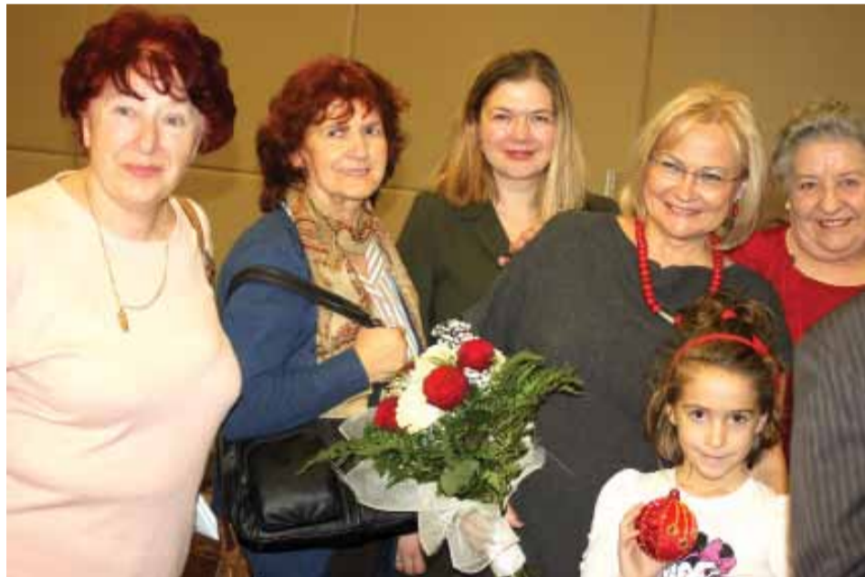
Polki z Czarnogóry z ambasadorem RP Grażyną Sikorską (druga z prawej)

Przyjęło się o nas mówić, że jesteśmy emigracją sercową. Czarnogóra to piękny, górzisty kraj na południu Europy, ze śródziemnomorskim klimatem. Coraz więcej rodaków z kraju przyjeżdża tu na wakacje. Wielu z nich chce się tu o siedlić na stałe.