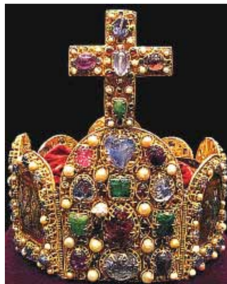
Korona Rzeszy, Korona Cesarstwa Rzymskiego. Wykonana jest ze szczerzego złota, ozdobiona licznymi kamieniami szlachetnymi, perłami oraz emaliowanymi przedstawieniami figuralnymi