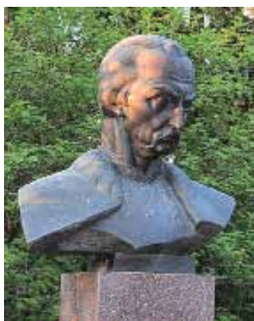
Pierwszy na Ukrainie i w Europie pomnik hetmana Mazepy we wsi Mazepinka. Na piedestale umieszczono jego sentencję: «А за віру хоч уміре і вольностей бороніте».

Jego ojciec – Adam – był podczaszym czernihowskim, a w młodości pokojowym króla Jana Kazimierza. Iwan kształcił się w Akademii Kijowsko-Mohylańskiej w Kijowie, kolegium jezuickim w Warszawie, a następnie na uniwersytetach Europy Zachodniej. W latach 1659–1663 był angażowany w służbie dyplomatycznej Rzeczypospolitej, zakończono-