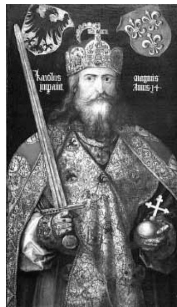
Karol I Wielki – „Z taski Bożej cesarz rzymski, zawsze August, król Franków, Włoch, Longobardii, Burgundii, Alzacji, Akwitanii i Hiszpanii”

Pierwsze uderzenie poszło na Inflanty. Podbój ich przeprowadził utworzony w 1202 roku Inflancki Zakon Rycerzy Chrystusa (Fratres Militiae Christi de Livonia), zwany Kawalerami Mieczowymi. Cztery lata wcześniej, w 1198 roku w Palestynie, powstał Zakon Szpitala Najświętszej Marii Panny