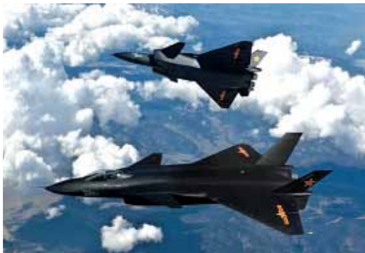
Chińczycy dokonują olbrzymich postępów na Ziemi i w powietrzu

W pierwszej piętnastce państw z największymi budżetami wojskowymi w 2013 r. były tylko cztery kraje UE. Budżet Wielkiej Brytanii oceniono na