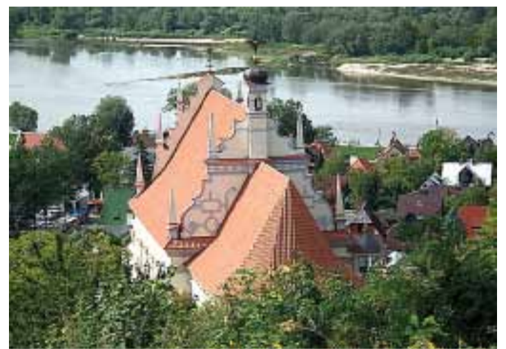
Widok z Góry Trzech Krzyży na Kazimierz Dolny

Na tym tle wyróżniają się okolice Wąwolnicy i Kazimierza Dolnego, gdzie występuje największe nagromadzenie wąwołów lessowych w Europie (11 km na 1 km 2 ). Najbardziej wartościowym przyrodniczo jej obszarem są Lasy Janowskie, w których znajduje się mnogość stawów hodowlanych. Do najciekawszych miejscowości należy zaliczyć sam Lublin, Kazimierz Dolny, Janowiec, uzdrowisko Nałęczów, Kozłówkę oraz Puławę.