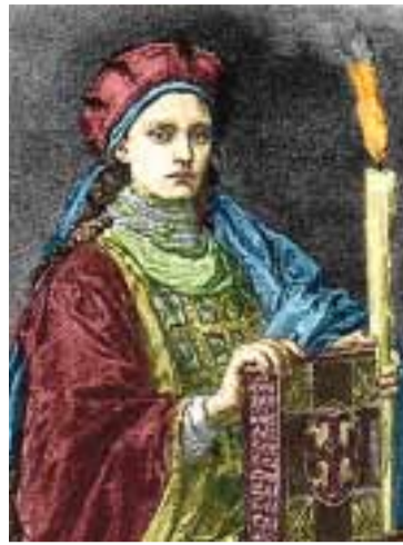
Mieszko I, z poganina, sugerowany przez żonę Dobrawę, staje się krzewicielem wiary

Stąd sławne określenie: gente Ruthenus, natione Polonus – „z rodu Rusin, z narodu Polak”. Takim z rodu Rusinem był dla przykładu książę Jarema Wiśniowiecki, tłumiący w imieniu Rzeczypospolitej powstanie na Ukrainie, wzniecone przez szlachcica Bohdana Chmielnickiego, innego z rodu Rusina; zaś Michał Korybut,