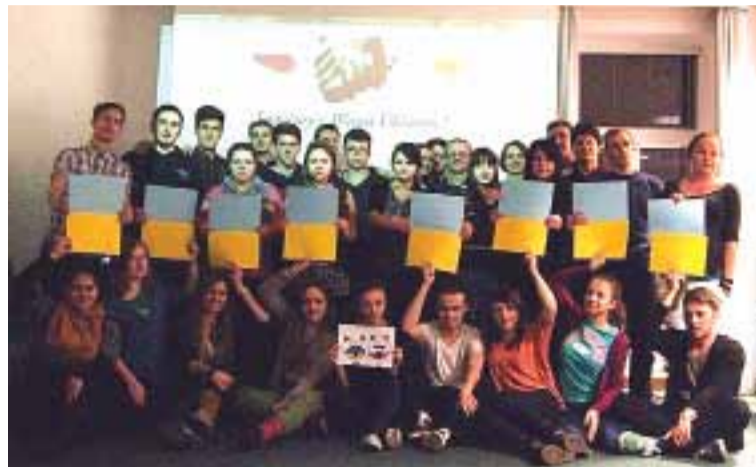
Jesteśmy z Wami, Ukraino!

W uzdrowiskowej podwarszawskiej miejscowości Konstancin-Jeziorna w dniach od 19 do 24 lutego br. w odbyło się szkolenie w ramach programu „Młódzież w Działaniu”, prowadzone przez Młódzieżową Akademię Liderów Lokalnych.