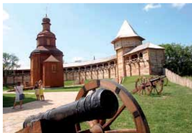
Baturin. Twierdza. Król Stefan Batory (1575) organizując Kozaków w sotnie i pułki założył tu miasto jako siedzibę hetmanów zaporoskiego wojska, dając mu swoje imię

***) III wojna północna (wielka wojna północna) toczyła się w latach 1700-1721 pomiędzy Królestwem Danii i Norwegii, Rosją, Saksonią, Prusami i Hanowerem (od 1715) z jednej strony a Szwecją z drugiej. Rzeczpospolita formalnie pozostała neutralna aż do 1704 roku, ale faktycznie znaczna część walk toczyła się na jej terytorium i jej kosztem już od 1700 roku. Zakończyła się podpisaniem pokoju w Nystad, w wyniku którego wzrosło znaczenie Rosji,