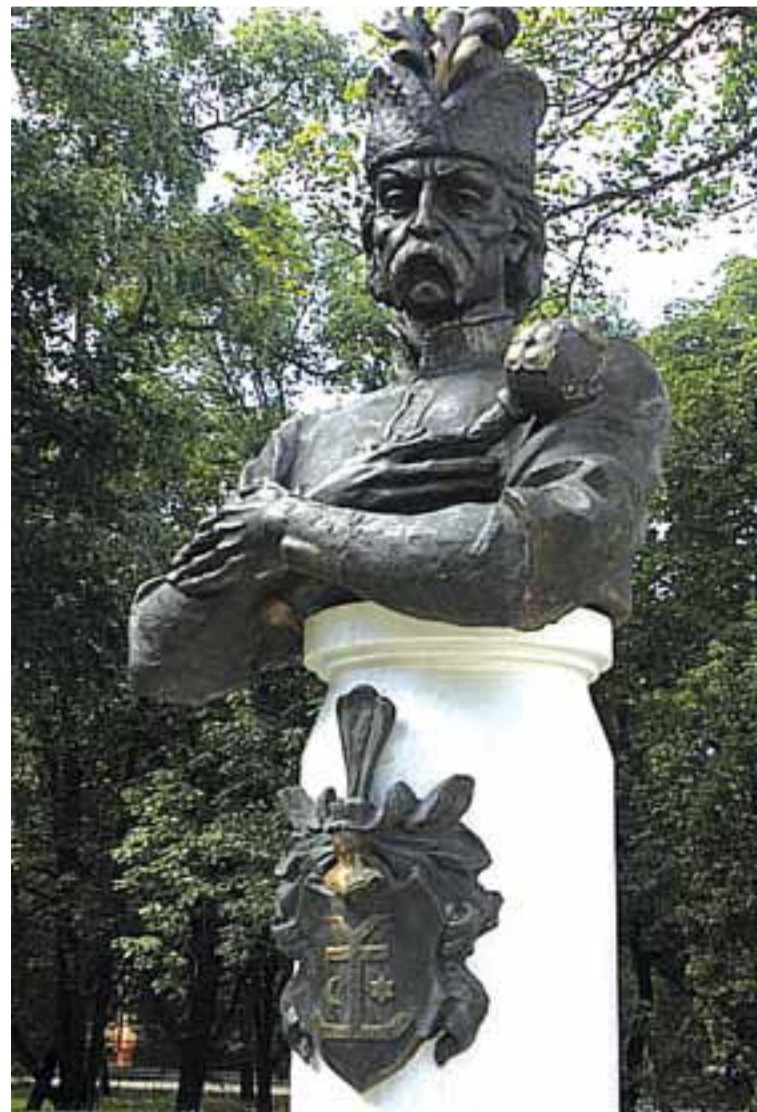
Pomnik Iwana Mazepy w Czernihowie. Na postumencie herb hetmana