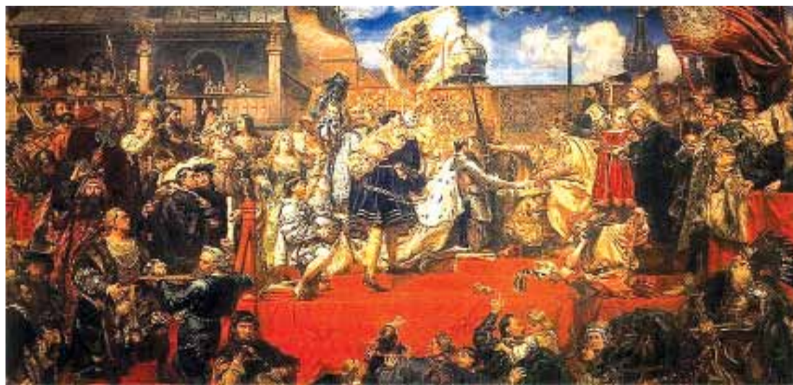
Hołd pruski (Marcello Bacciarelli)

Chrześcijanami byli wtedy tylko ci z nich, którzy osiedlili się na południe od Dunaju, wśród chrześcijańskiej już od IV wieku ludności Imperium Romanum – Słowianie i Chorwaci wśród społeczności wyznania rzymsko-katolickiego, Serbowie i pozostali Słowianie bałkańscy wśród społeczności wyznania grecko-prawosławnego – i odpowiednio do tego – nowi przybysze przyjęli chrześcijaństwo bądź z Rzymu, bądź