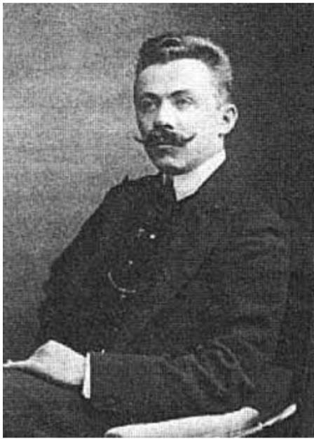
Jasnovidz w młodości

Tak jak pisaliśmy powyżej, sam Stefan Ossowiecki uważał swoje umiejętności za zupełnie naturalne i nie chwalił się nimi. Traktował je zwyczajnie,