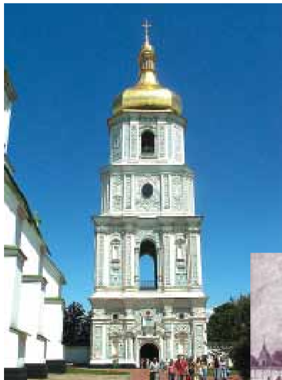
Dzwonnica soboru Sofijskiego. Widok obecny

Mazepa wraz z Karolem XII schronił się na terytorium Turcji. Zatrzymał się pod Benderami (rum. Tighina, obecnie Mołdawia), gdzie