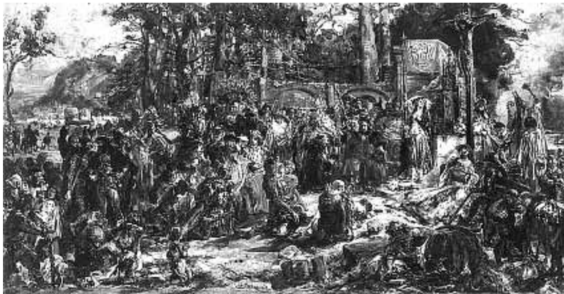
Chrzest Litwy, obraz Jana Matejki

Prusy sąsiadowały z Polską, która przez ponad dwa stulecia ponawiała bezskuteczne próby ich chrystianizacji; Litwa i Inflanty sąsiadowały z prawosławną Rusią, ale i z tamtej strony chrześcijaństwo nie czyniło postępów.