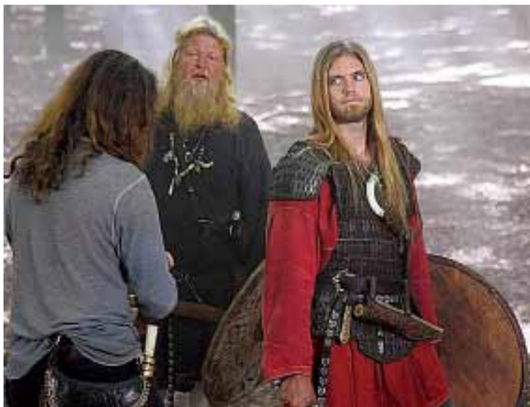
Wikingowie. Słowianie i Grecy nazywali ich Waregami (czyli „zaprzysiężeni ludzie” od lub prastowiańskiego trzonu *war – „zysk”). Arabowie zwali ich Rusami lub Rhosami, co wywodzi się od trzonu rōps-, związanego z wiosłownikiem, lub Rostagen, środkowo-wschodnim rejonem Szwecji. Skąd pochodziła większość wikingów odwiedzających ziemie Słowian

Kim był Dagome iudex, Dagome sędzia? Odpowiedź wydaje się znana, pojawia się już w samym tekście: to Mieszko I. W porządku, ale czemu nie występuje pod swym imieniem, tylko jako Dagome? Otóż, twierdzą niektórzy, Dagome to pierwsze imię księcia nasuwające normańskie skojarze-