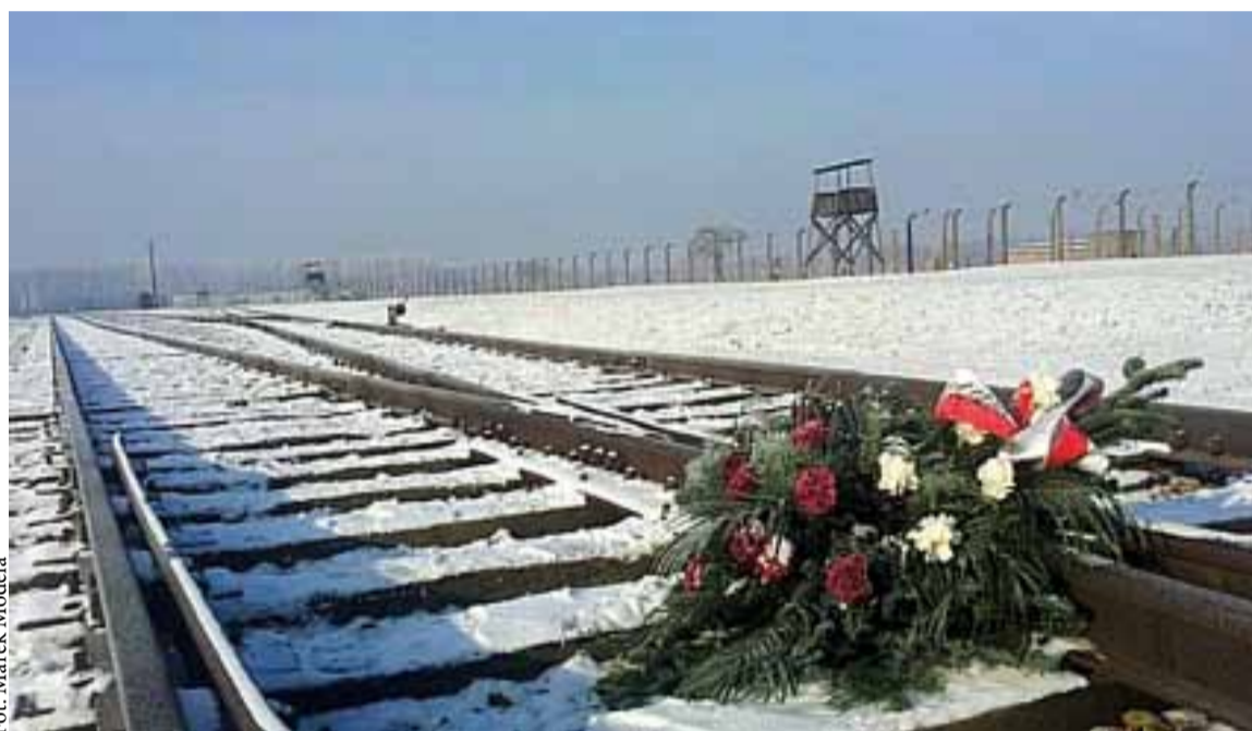
Ekumeniczna modlitwa pod pomnikiem w Birkenau zakończyła obchody 69. rocznicy wyzwolenia byłego, nazistowskiego obozu zagłady Auschwitz-Birkenau. W tym roku do Oświęcimia przyjechali parlamentarzyści z 20 krajów, w tym liczna, kilkudziesięcioosobowa delegacja Izraelskiego Knesetu. Jak co roku jednak najważniejszymi gośćmi byli byli więźniowie Auschwitz. Tym razem do Oświęcimia przyjechało ich około setki (Patrz str 5.)