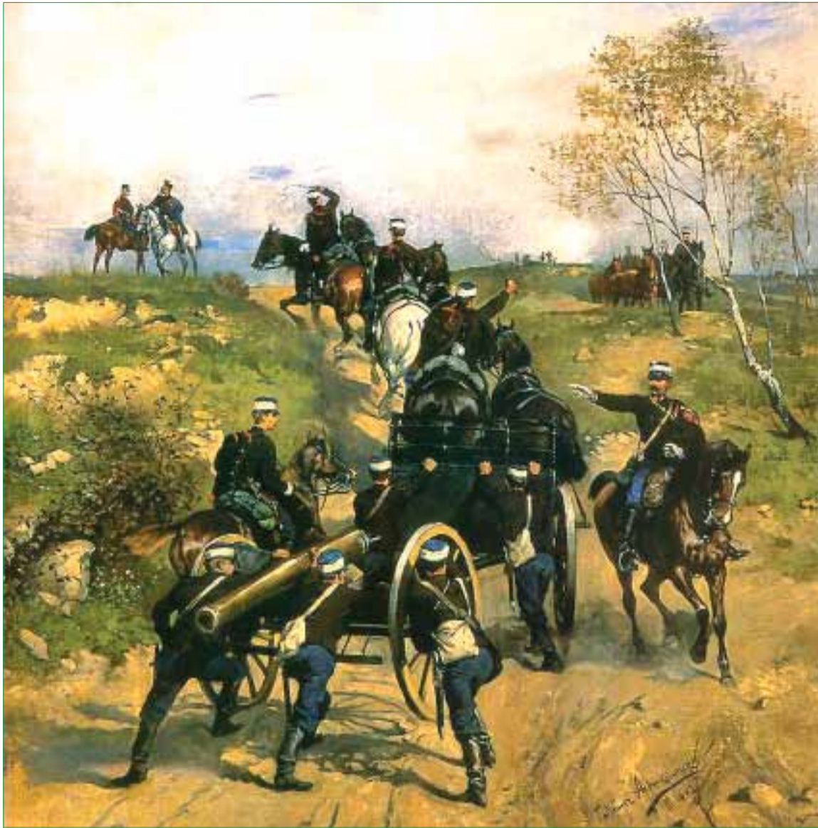
ARTYLERIA KONNA AUSTRIACKA. 1882. Olej na płótnie. 77 x 65 cm. Muzeum Okręgowe w Lublinie