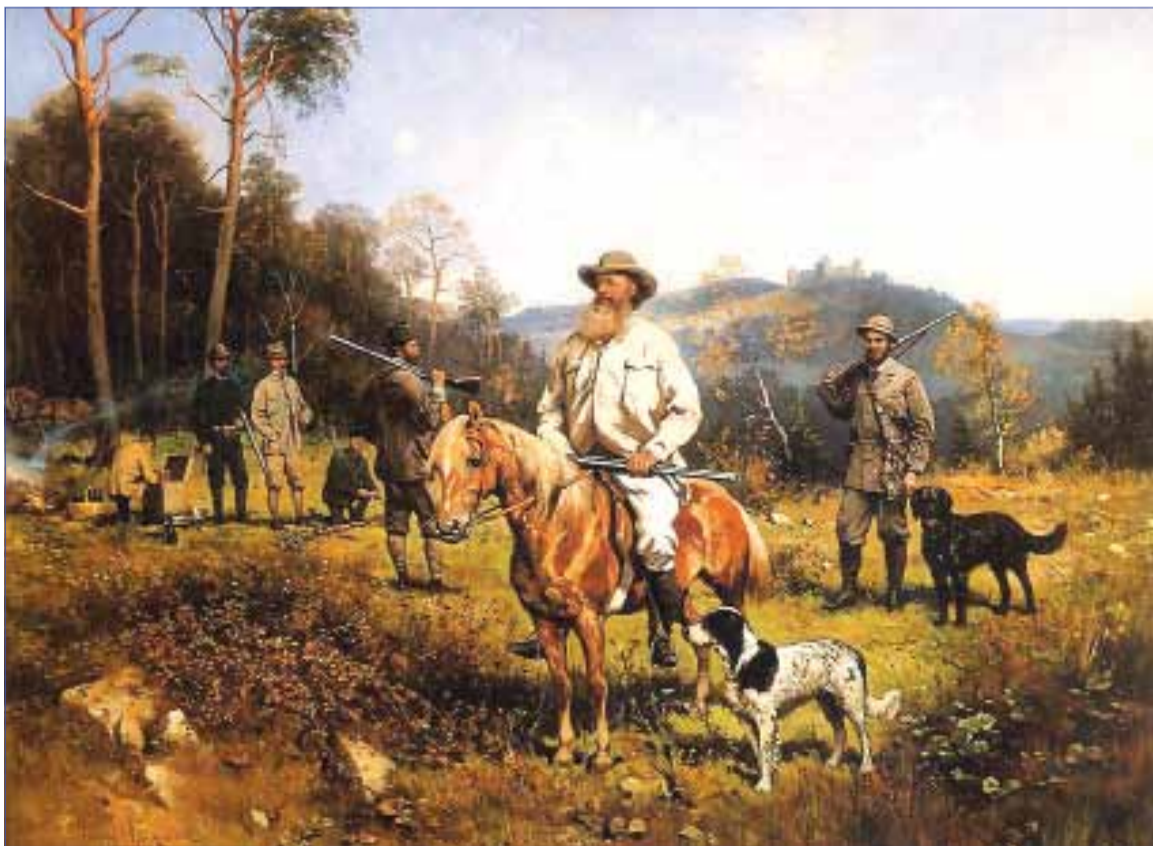
KONSTANTY BRANICKI NA POLOWANIU. Olej na płótnie. 63,7 x 79,5 cm. Muzeum Narodowe w Warszawie

Mając ponad 60 lat zaciągnął się do Legionów. Trudy wojenne zmogły go, w 1916 roku zmarł w wojskowym szpitalu. ■