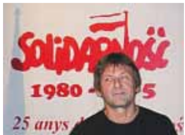
Twórcą znaku graficznego „Solidarności” jest grafik Jerzy Janiszewski

Szczególna rola w upowszechnianiu idei „Solidarności” przypadła grafikom - projektantom plakatów. Ten burzliwy okres lat osiemdzie-