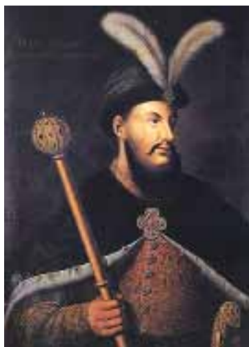
Petro Doroszenko w latach 1665–1676 był hetmanem Ukrainy Prawobrzeżnej

Następcą Pawła Teterę stał samozwańczo pułkownik czehryński Stepan Opara, który w czerwcu 1665 roku z pomocą Tatarów pomagał obalać Teterę.