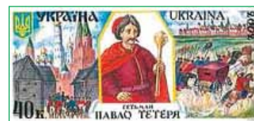
Hetman Paweł Tetera na współczesnym znaczku

Dzięki pomocy tatarskiej pokonał obu przeciwników