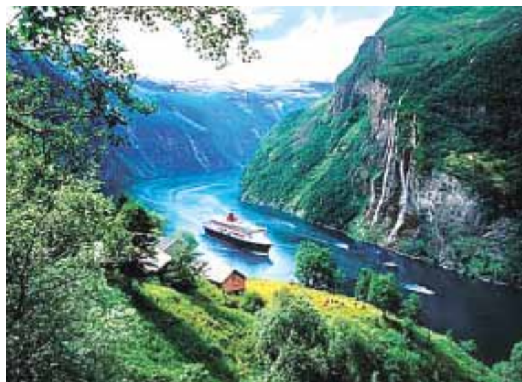
Norwegia - kraj Wikingów i legend

Skrok twierdząc, że dawni polscy historycy i archeolodzy z PRL-u, opierali się przed zaakceptowaniem dowodów na udział wikingów w tworzeniu