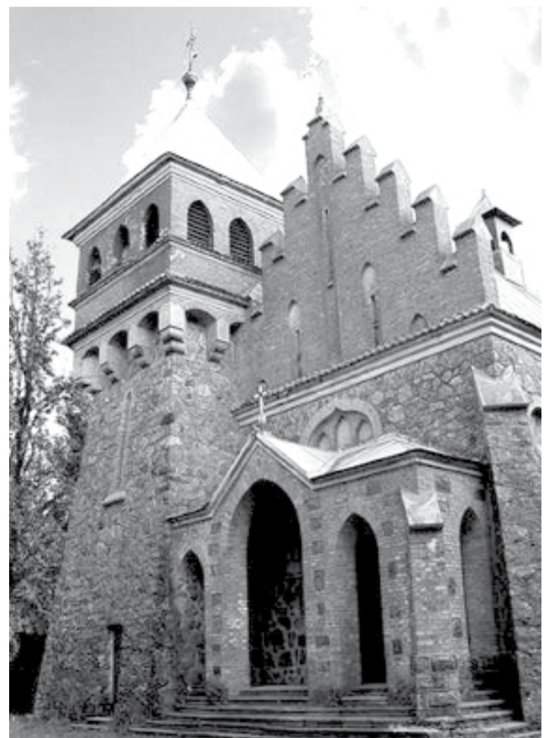
Kościół Św. Klary w Chałaimgródku, wybudowany w 1913 roku

zdarzeń i opowieści tyczących dziejów Polski i Ukrainy. Autor podkreśla wielką rolę świętych polskich, takich jak św. Stanisław, św. Kinga, św. Stanisław Kostka w dziejach narodu polskiego. Przypisuje im obronę Ojczyzny podczas zagrożeń dziejowych. Wielkość i potęgę dawnej Polski upatruje w głębokim życiu religijnym narodu, na którego służyła za pośrednictwem Najświętszej Maryi Panny Łaska Boska.