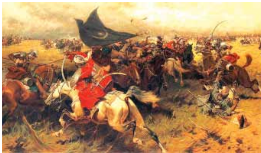
Walka o sztandar turecki – epizod wojny polsko-tureckiej 1672–1676 (mal. Józef Brandt)

Pierwszym z nich był Paweł Tetera (właściwie Morzkowski). Nie znamy jego dat urodzin i śmierci – urodził się przypuszczalnie po roku 1610, zmarł po 1670. Pochodził z drobnej szlachty prawosławnej. Kształcił się w kijowskim Kolegium Mohylańskim, a wcześniej w Mińsku, gdzie poznał łacinę i sztukę przemawiania. Był dwukrotnie żonaty, drugi raz z córką Bohdana Chmielnickiego. Dzięki teściowi robił szybką karierę. Zaczynał jako pisarz pułku perejasławskiego, by wkrótce stać się jego dowódcą. Powierzane mu były misje dyplomatyczne, m.in. posłował w 1654 r. do Moskwy i był głównym gospodarzem spotkań do ugody perejasławskiej. Po śmierci Bohdana Chmielnickiego brał udział w pertraktacjach z Rzeczypospolitą, zakończonych umową hadziacką. Jako pisarz generalny przy hetma-