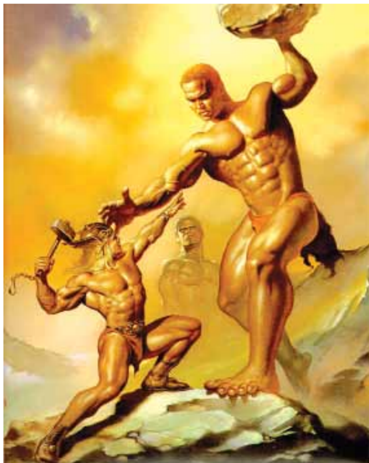
Thor – jeden z najważniejszych bogów nordyckich. Wikingowie wierzyli, że bóg Thor wywołuje błyskawice, rzucając swym młotem i że grzmot to stukot jego kót rydwanu