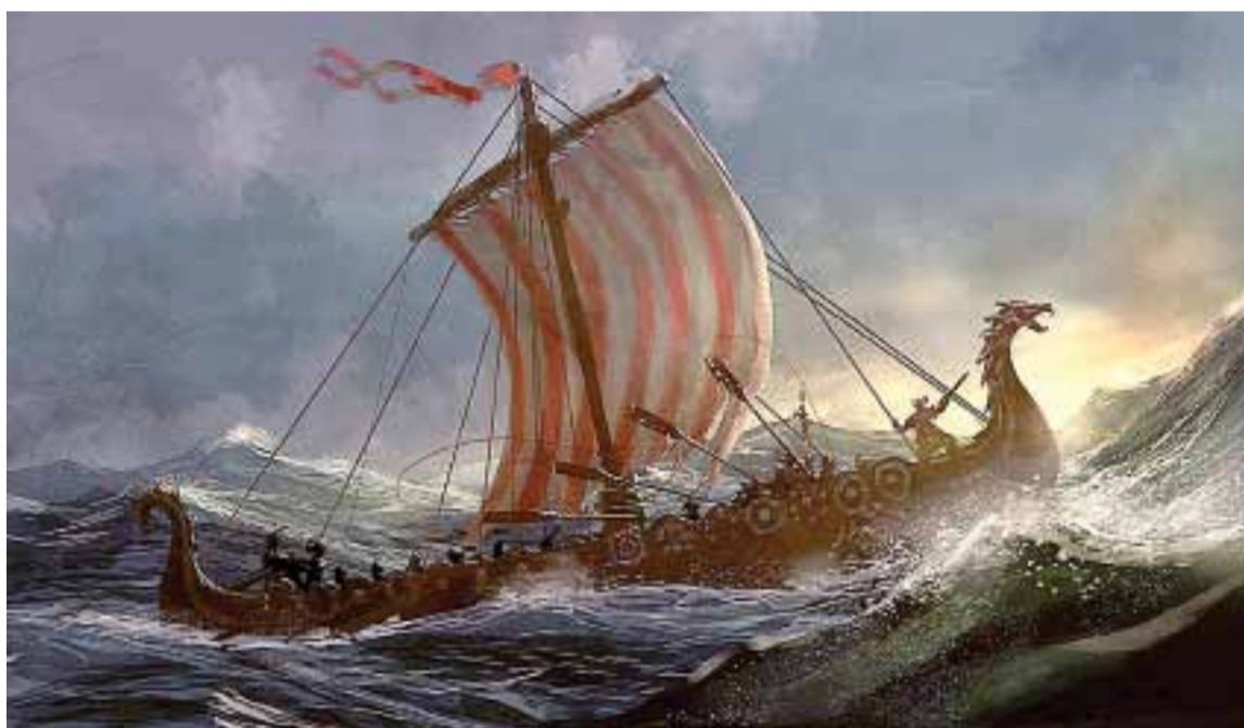
Wikingowie od VIII wieku podejmowali dalekie wyprawy o charakterze kupieckim, rabunkowym lub osadniczym