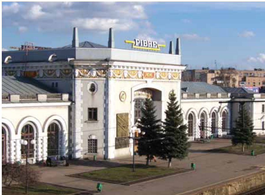
Рівненський залізничний вокзал

Dofinansowano ze środków Senatu RP dzięki pomocy Fundacji „Pomoc Polakom na Wschodzie” Дофінансовано на кошти Сенату РР при допомозі Фондації «Допомога Полякам на Сході»