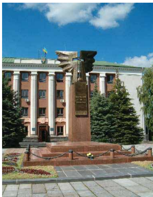
Пам'ятник загиблим за Україну