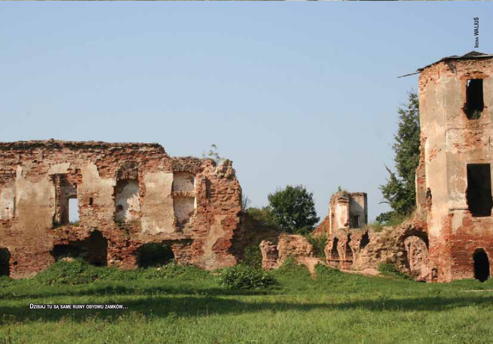
DZISIAJ TU SĄ SAME RUINY OBYDWU ZAMKÓW...