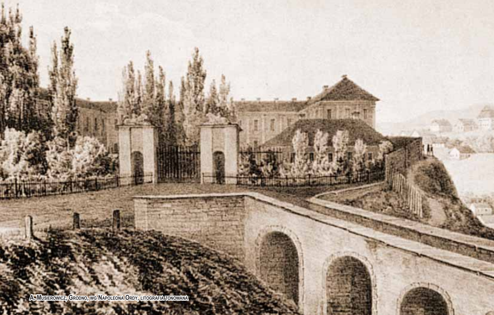
A. MUSIEROWICZ, GRODNO, WG NAPOLEONA ORDY, LITOGRAFIA TONOWANA